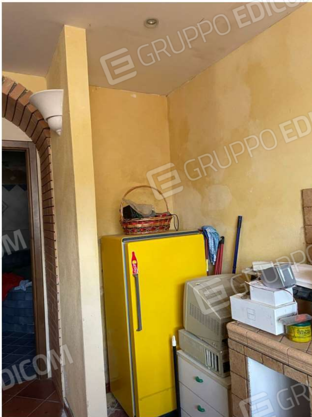
CUCINA E SOGGIORNO