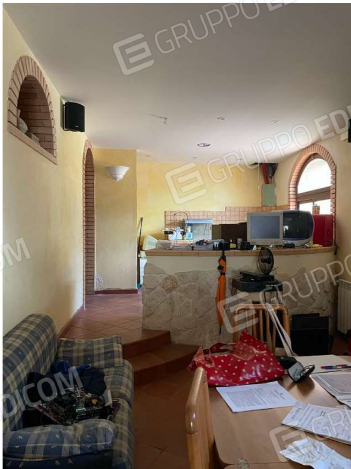
CUCINA E SOGGIORNO