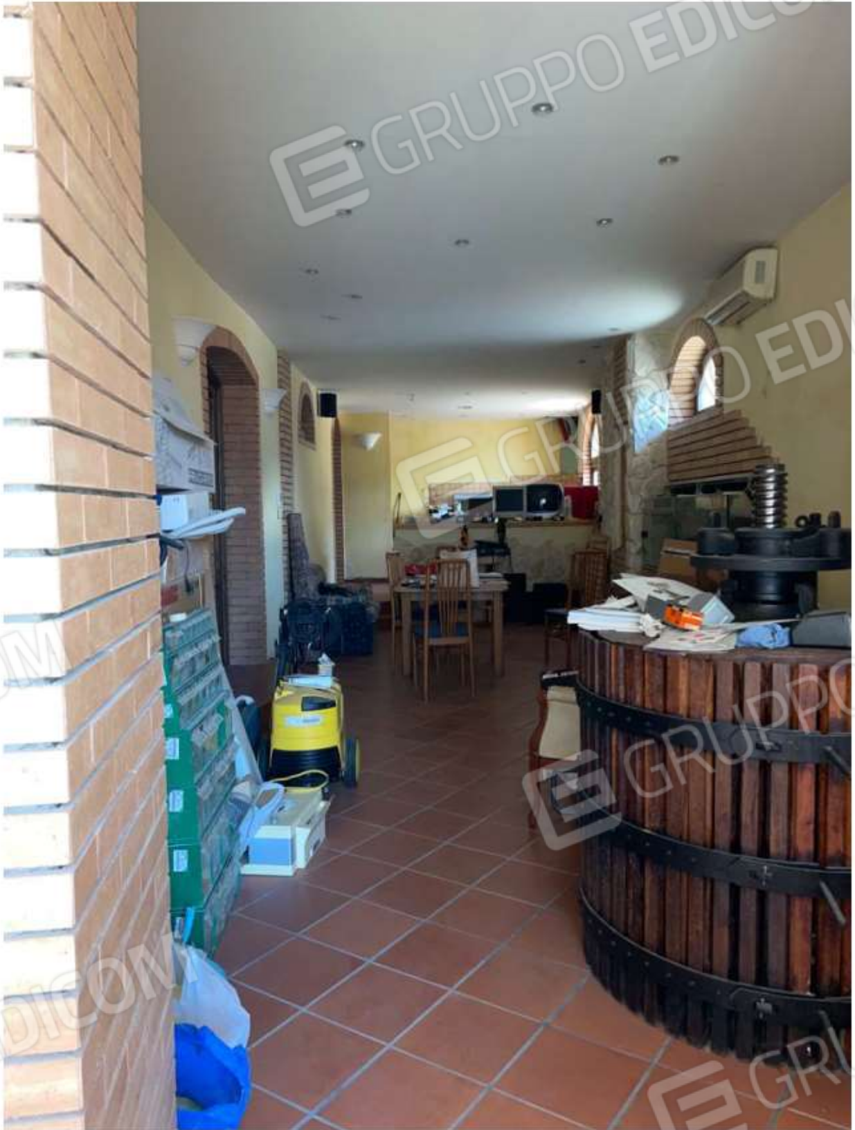
CUCINA E SOGGIORNO