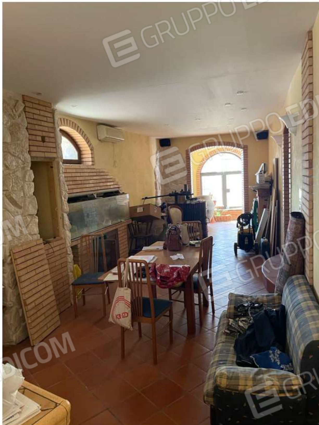
CUCINA E SOGGIORNO