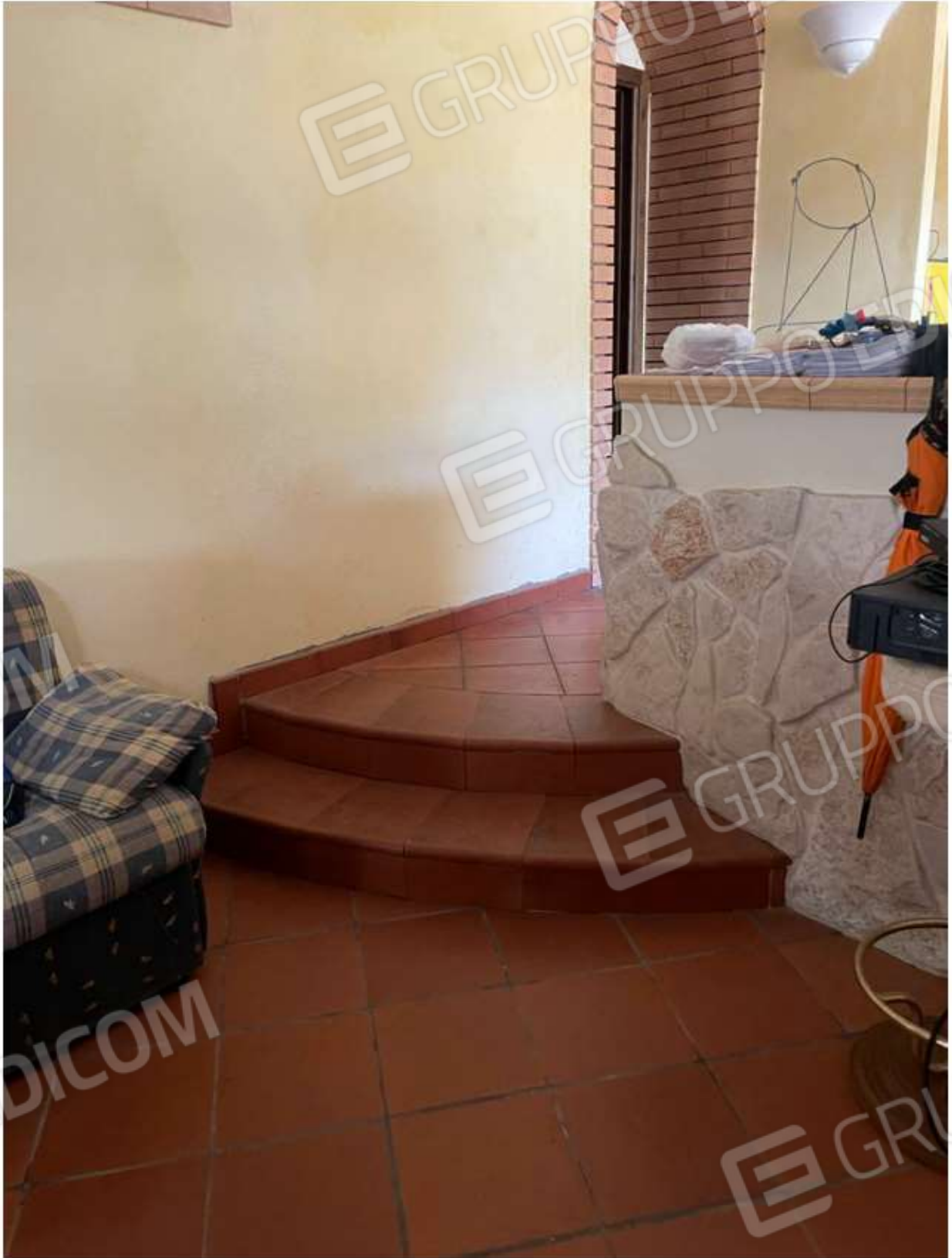
CUCINA E SOGGIORNO