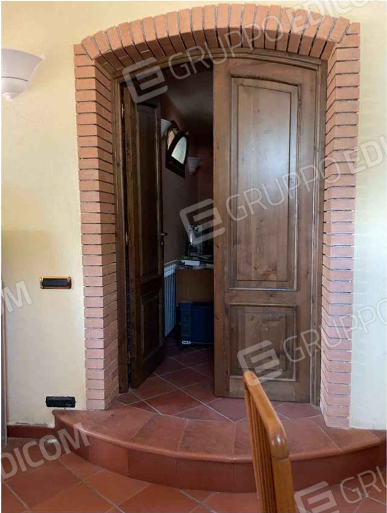
PORTA D'INGRESSO ALLA CAMERA