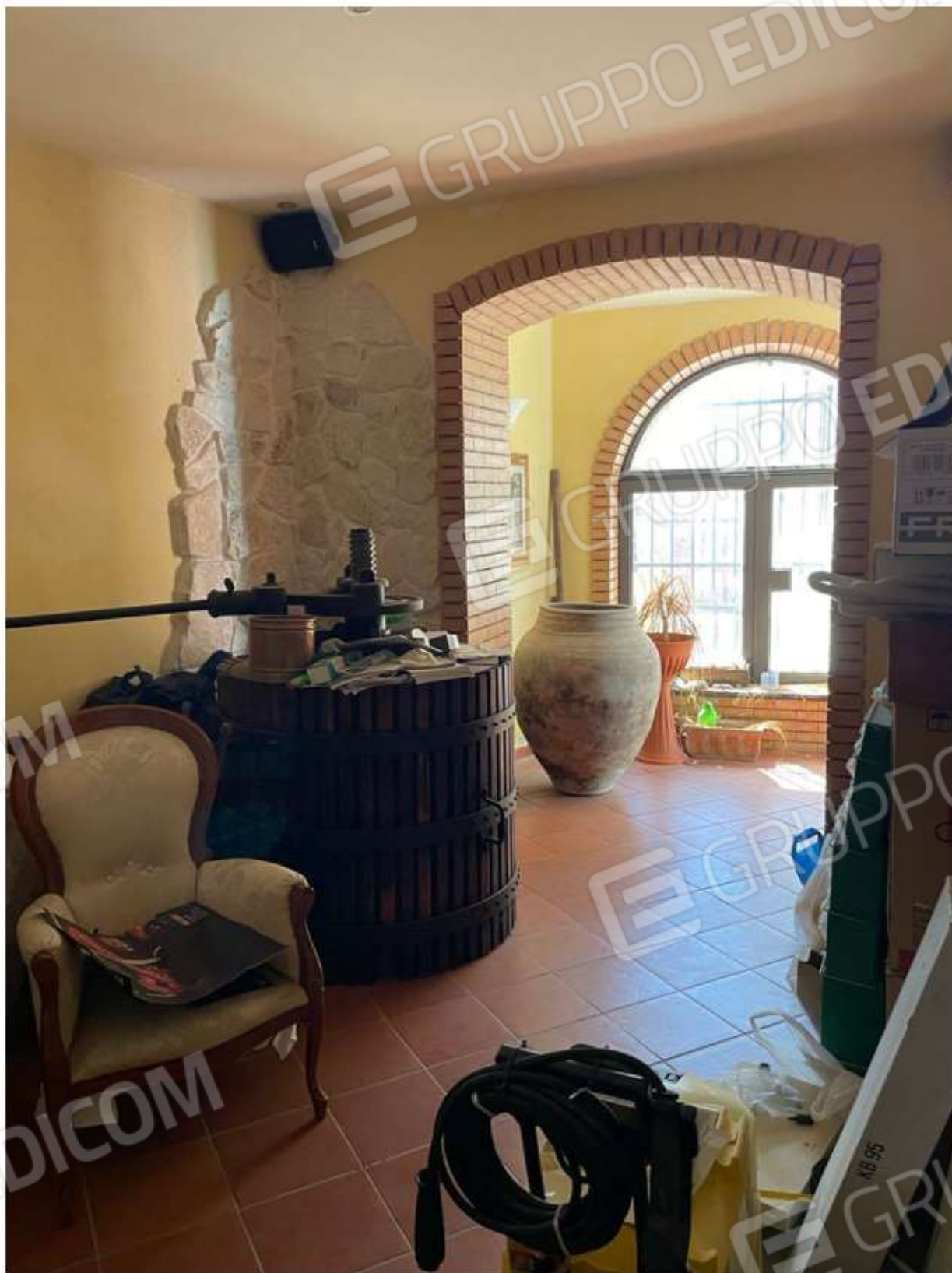
CUCINA E SOGGIORNO