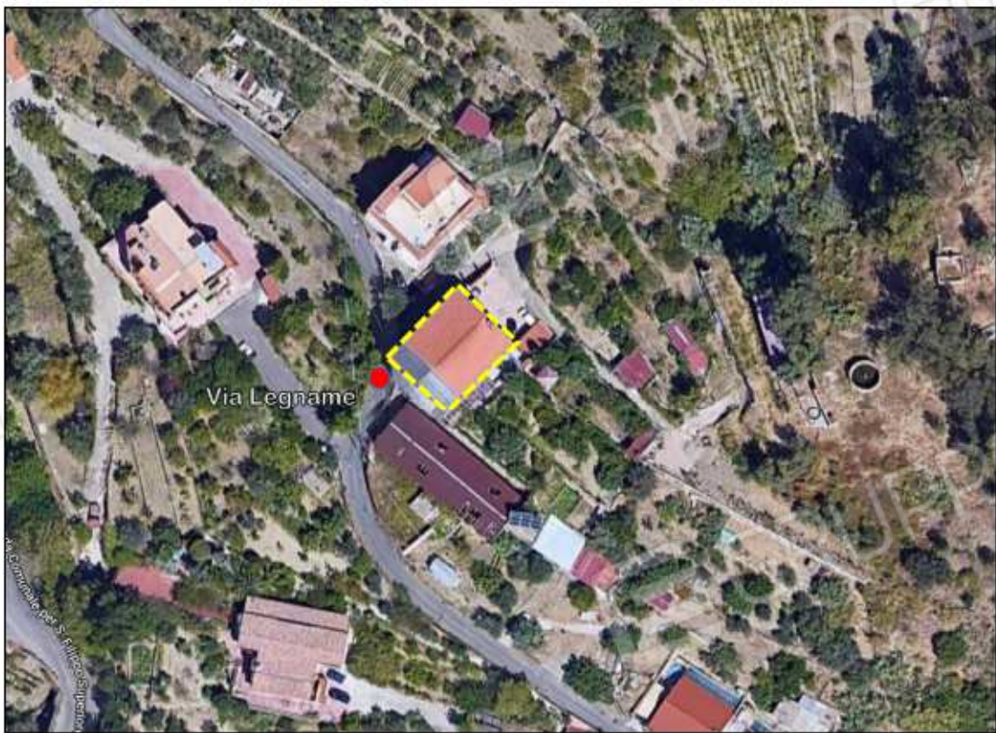
Foto 02: foto satellitare con perimetrazione della Particella 1363 Foglio 131 del Catasto Fabbricati.

Procedimento N. 183/2021 R.G.Es. promosso da ELROND NPL 2017 S.r.l.