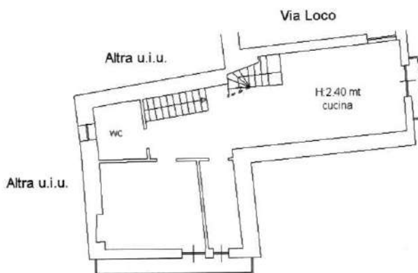
Piano Secondo Via I Settembre