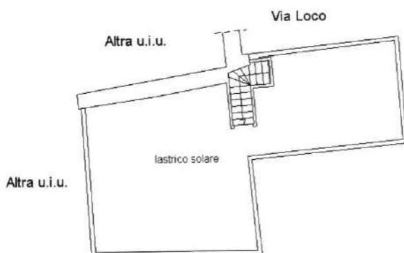
Piano Terzo Via I Settembre