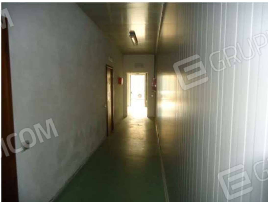
FOTO n. 18 : Interno Capannone (disimpegno servizi igienici e uffici)