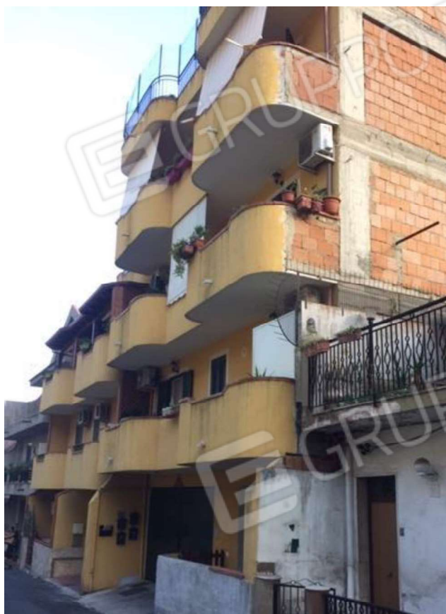
Foto n. 2 _Portone di accesso all'androne interno