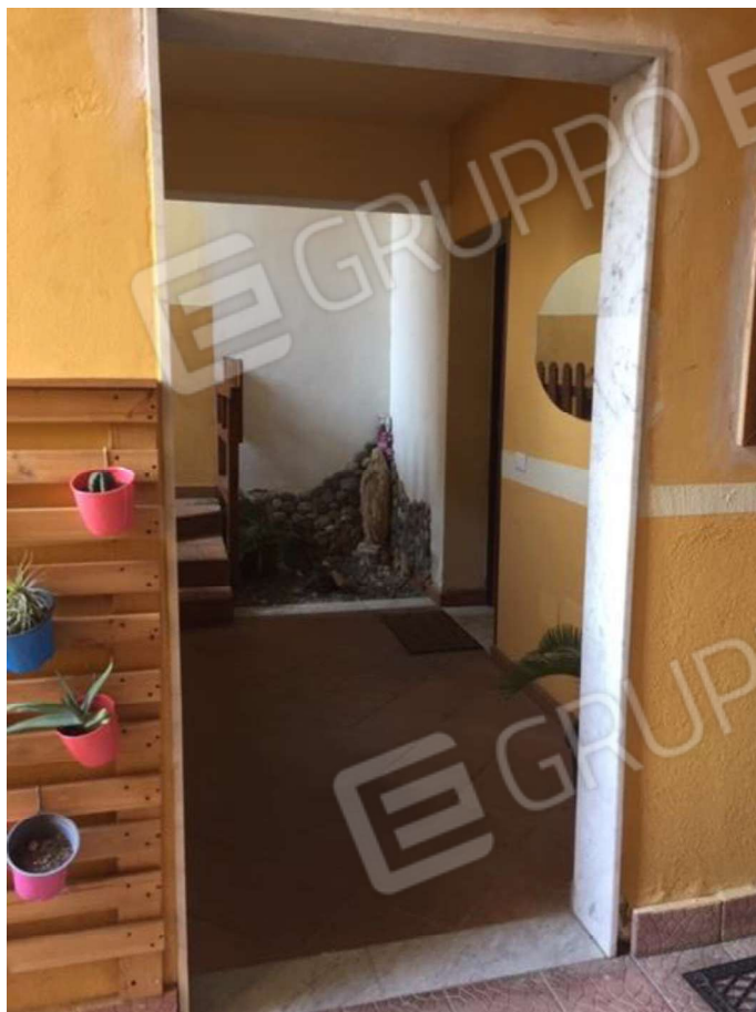
Foto n. 4 _Portone di ingresso all'immobile