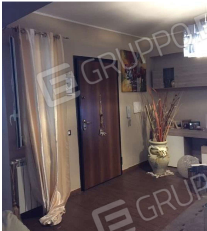
Foto n. 6 _Vista del living