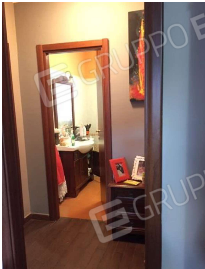
Foto n. 8 _Vista del bagno principale