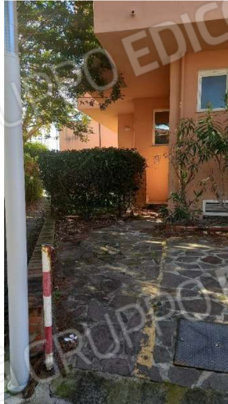
accesso pedonale dal parcheggio sub. 12