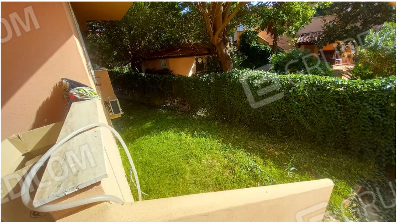
particolare del giardino esterno