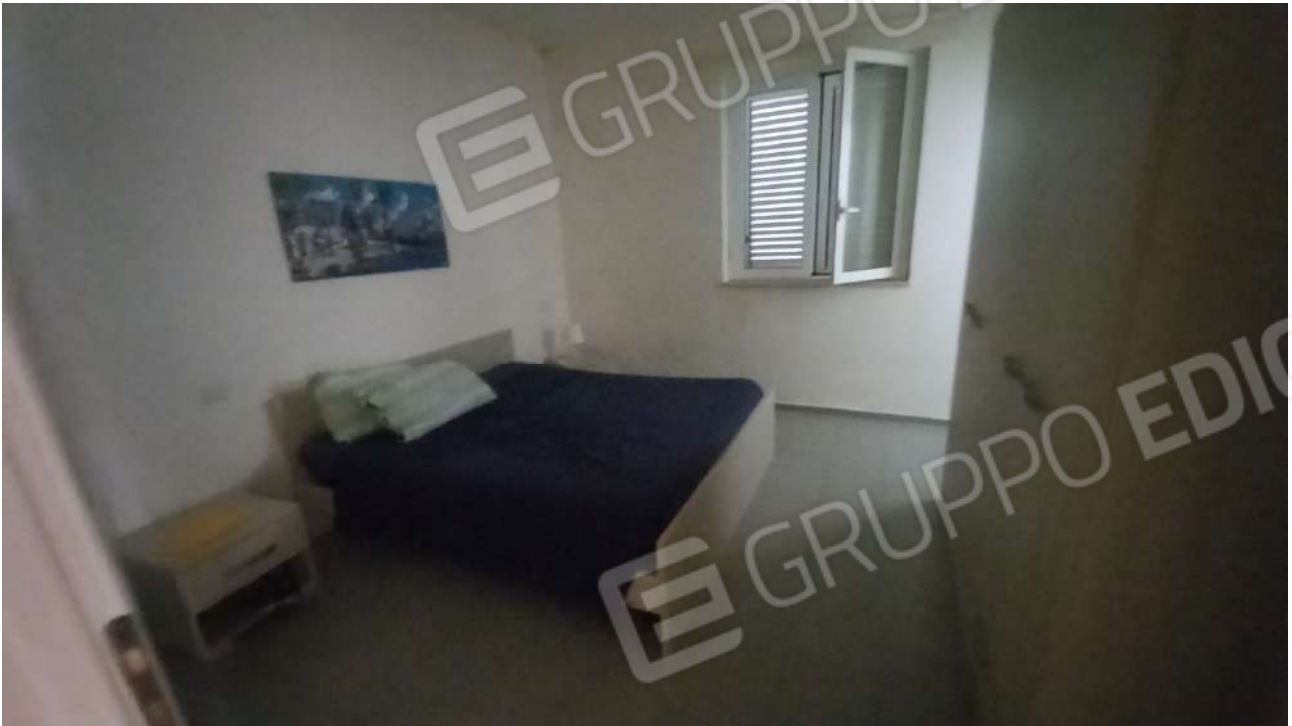
Camera matrimoniale con bagno in camera