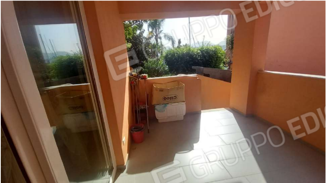
particolare del portico