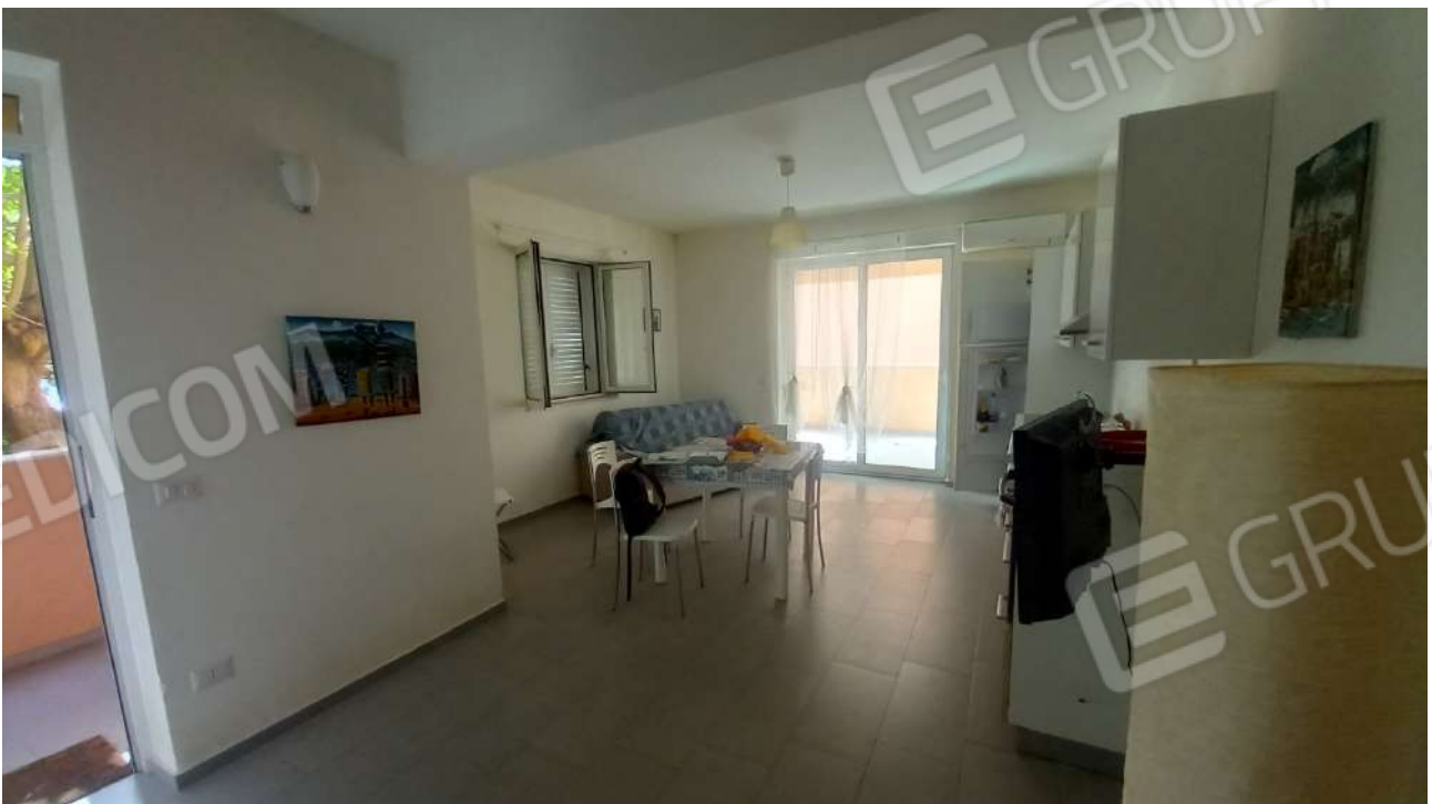
Pranzo soggiorno del villino