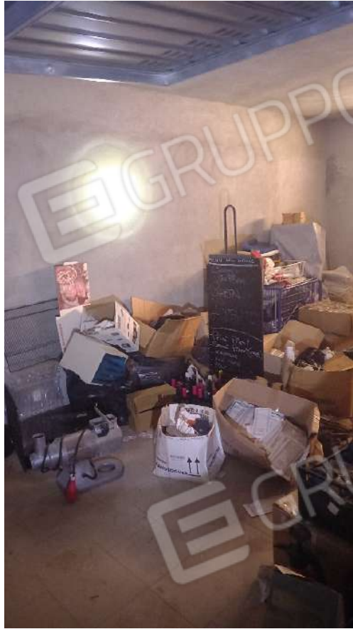
PARTICOLARE DELLA CANTINA SUB. 23 –