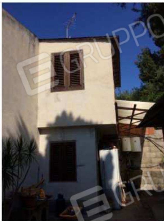
Foto n. 3 Prospetto lato est