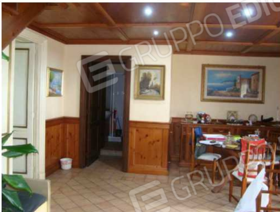
Foto n. 5 - Soggiorno