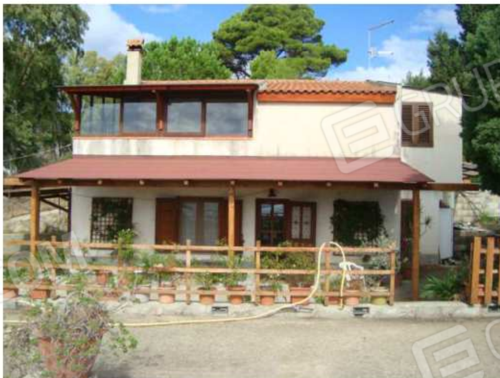
Foto n. 2 Prospetto principale