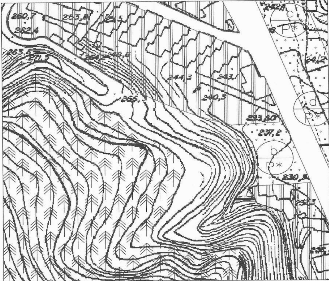
Stralcio P.R.G. vigente