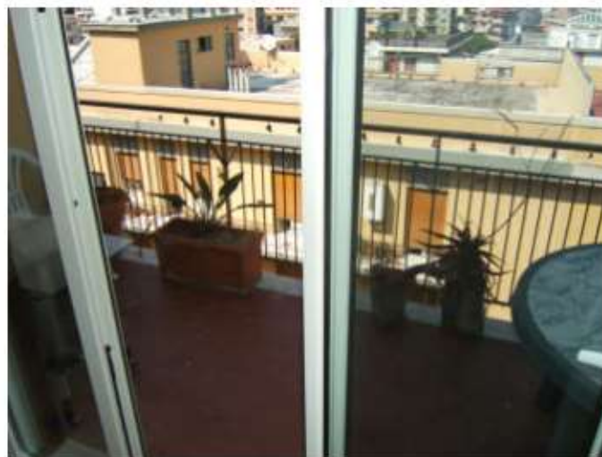
Foto n. 30: Lotto 3 – Balcone prospettante su via Primo S. Licandro