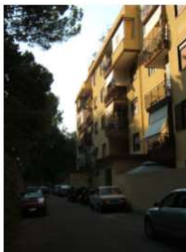
Foto n. 20: Lotto 3 – Prospetto dell'edificio sul cortile condominiale lato monte