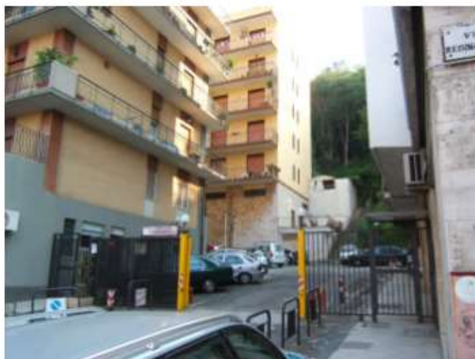
Foto n. 19: Lotto 3 – Ingresso del complesso “Concordia” su viale R. Elena