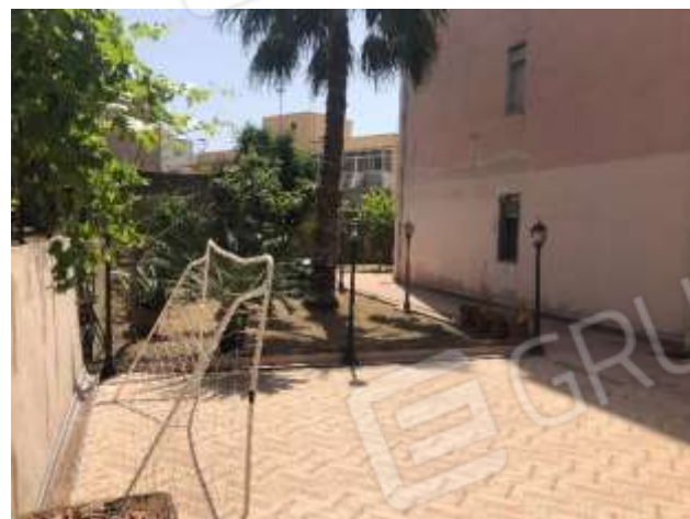
Figure 24-25 – Terrazza e giardino lato Nord