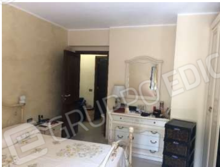
Figura 16 – Camera da letto