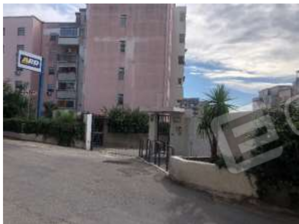
Figura 2 – Ingresso del complesso “Residence Puglisi”