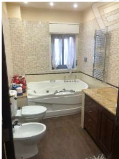
Figura 18 – Bagno con vasca