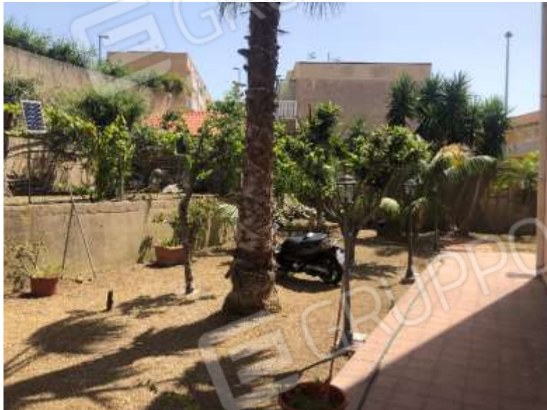
Figura 29 – Giardino lato Nord