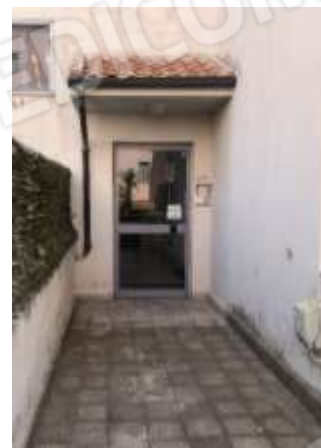
Figura 3 – Portone d’ingresso