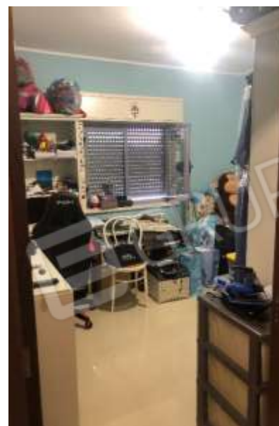
Figura 14 – Cameretta