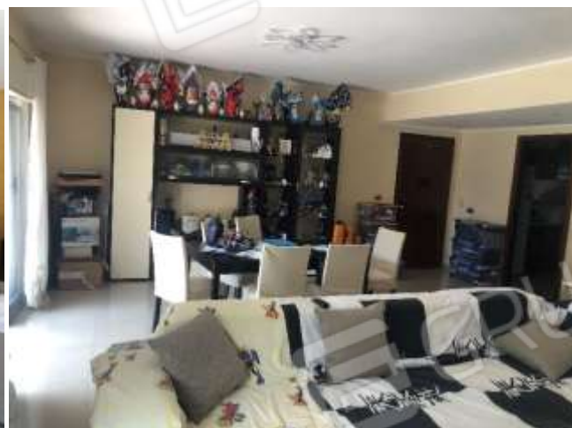
Figura 7 – Pranzo/soggiorno