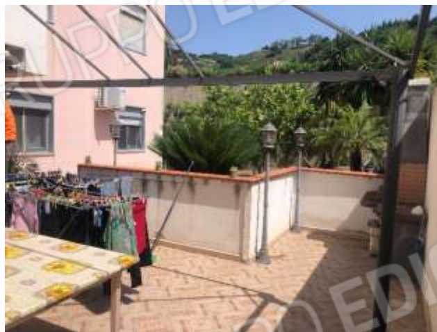
Figure 20-21 – Terrazza lato Est fronte zona pranzo/soggiorno