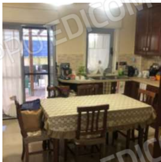
Figura 9 – Cucina