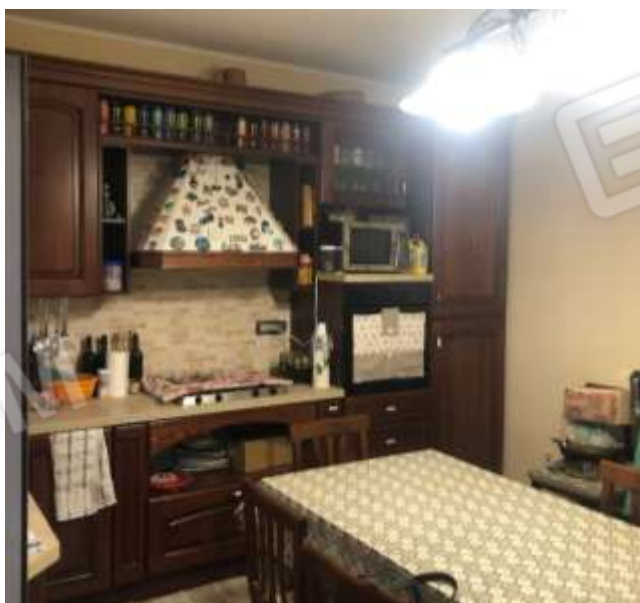
Figura 10 – Cucina