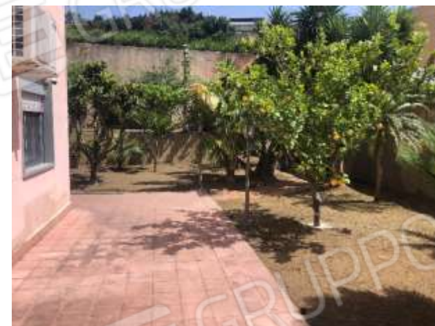
Figure 22-23 – Terrazza e giardino lato Est fronte zona pranzo/soggiorno