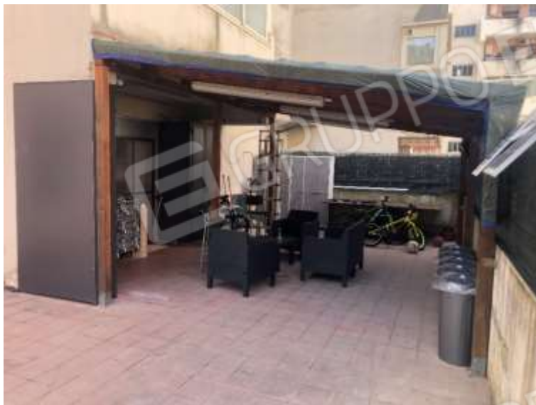
Figura 32 – Tettoia su terrazza lato Ovest fronte cucina