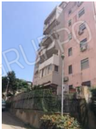
Figura 1 – Palazzina 20-21