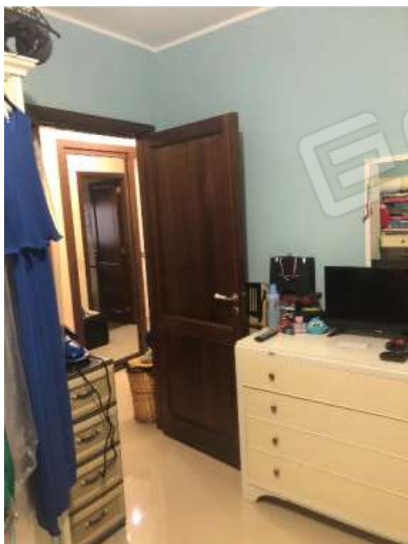
Figura 15 – Cameretta