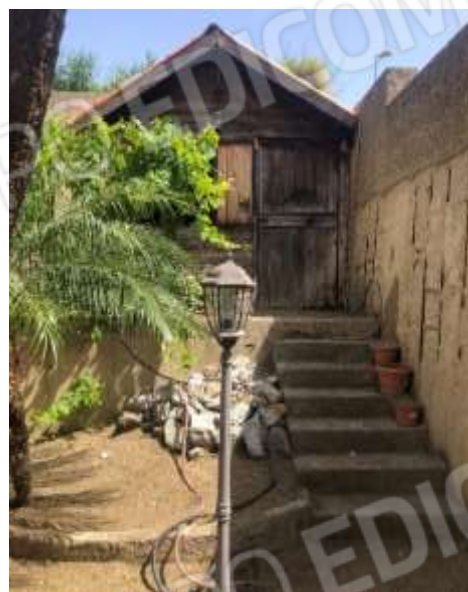
Figura 27 – Scala di collegamento tra i due livelli del giardino