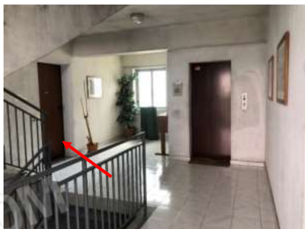
Figura 4 – Ingresso dall’androne condominiale