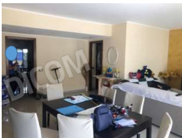
Figura 6 – Pranzo/soggiorno