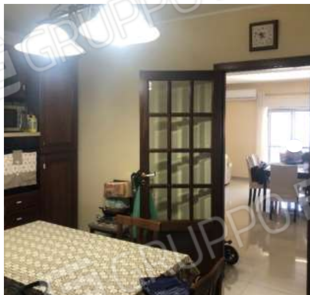
Figura 11 – Cucina