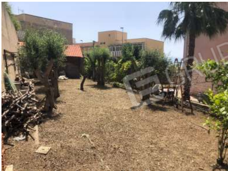
Figura 26 – Giardino lato Nord a quota più alta