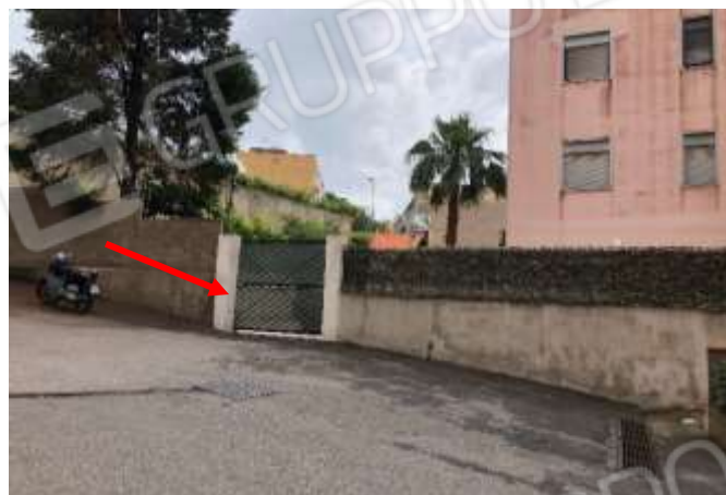
Figura 5 – Ingresso privato diretto