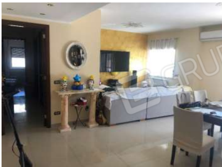
Figura 8 – Pranzo/soggiorno