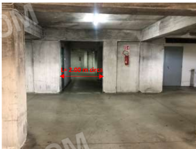
Figura 33 – Passaggio obbligato per raggiungere il posto auto