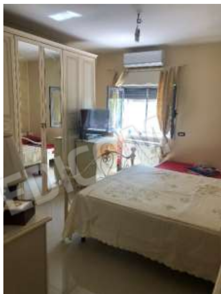
Figura 17 – Camera da letto