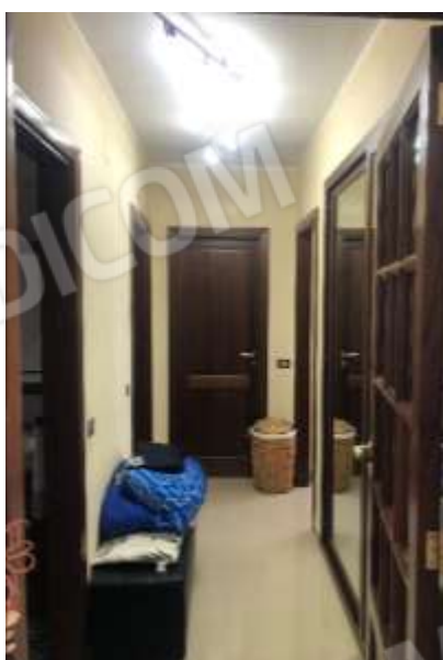
Figura 12 – Disimpegno