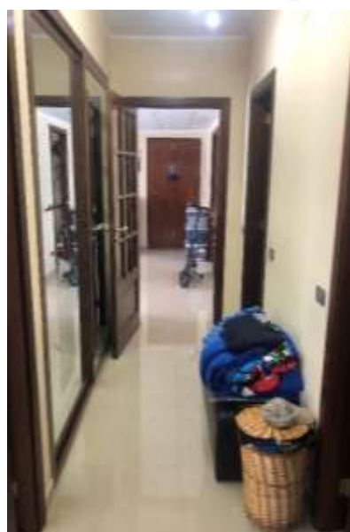
Figura 13 – Disimpegno