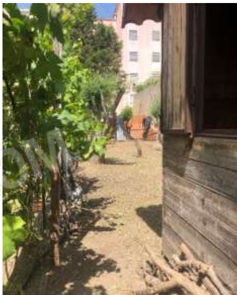
Figura 28 – Giardino lato Nord a quota più alta