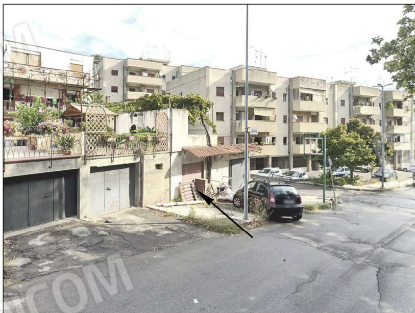
altro prospetto lato strada