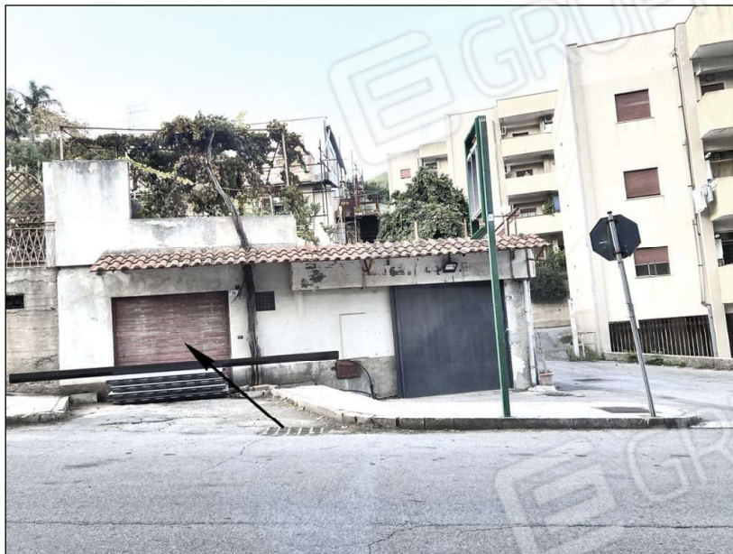
prospetto lato strada