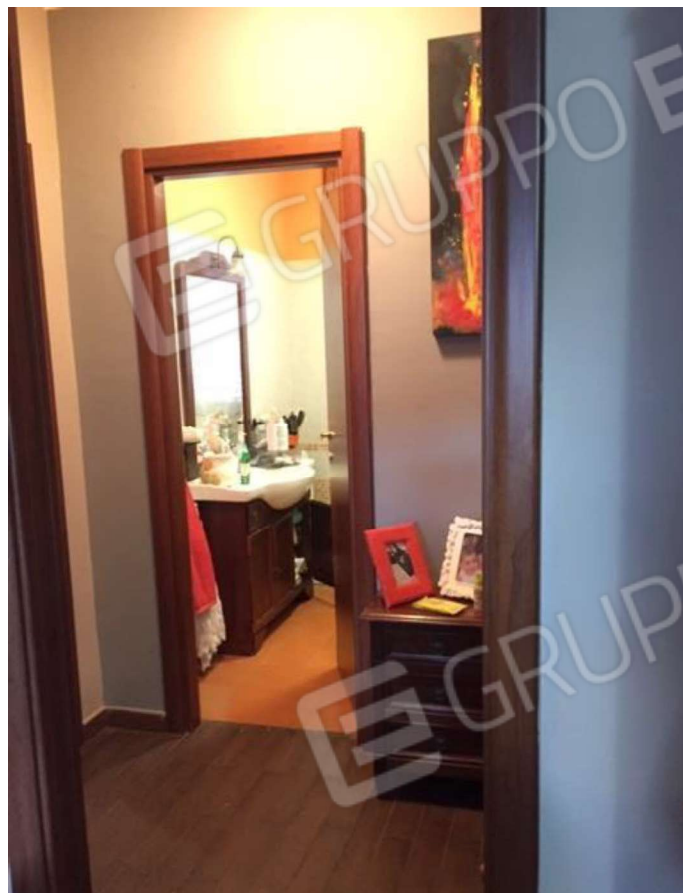
Foto n. 8 _Vista del bagno principale