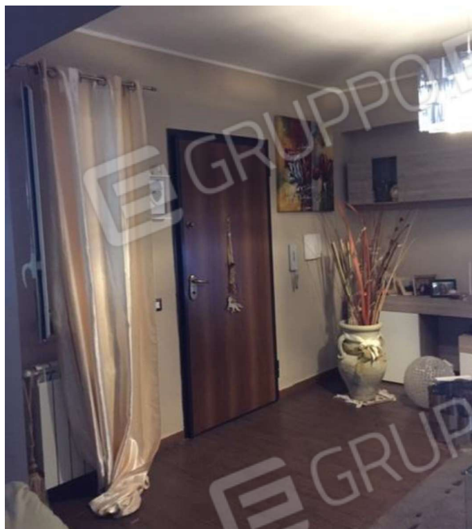
Foto n. 6 _Vista del living