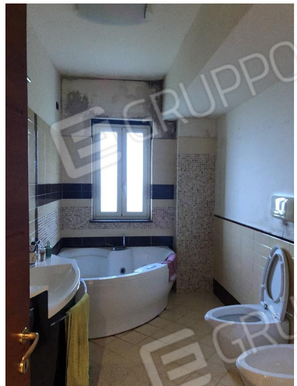
Bagno su corridoio