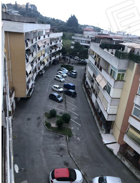
Fig. 122 – part. 2511 – sub. 23