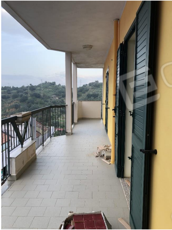
Balcone piano 4°