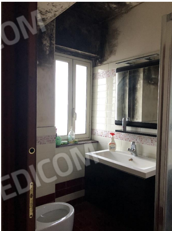
Bagno interno stanza matrimoniale