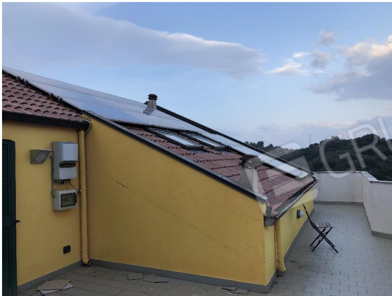
Terrazza piano 5°