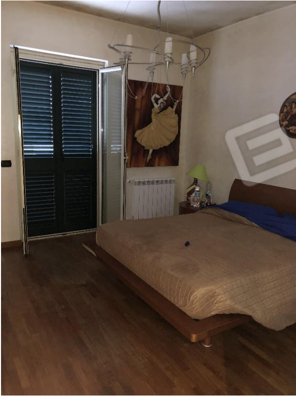
Stanza matrimoniale con cabina armadio