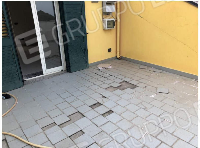
Condizioni della pavimentazione