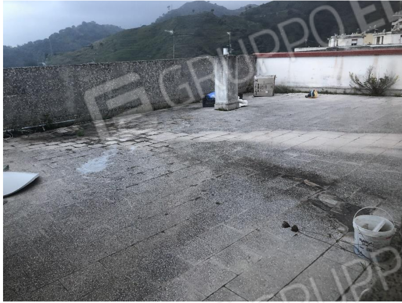
Stato di manutenzione generale