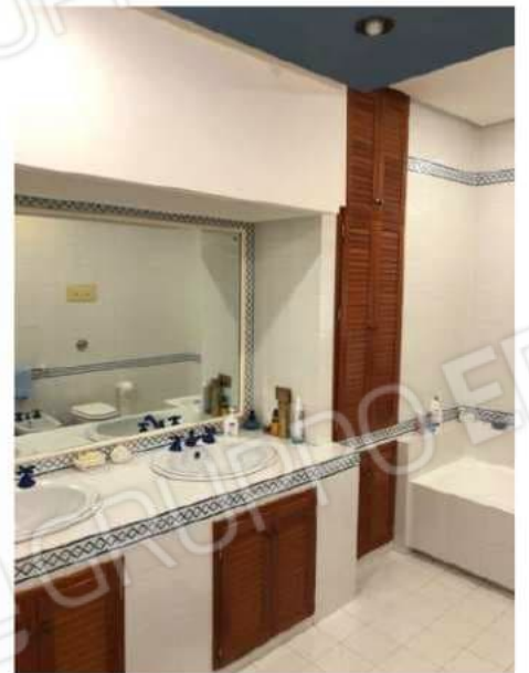
w.c. n. 1