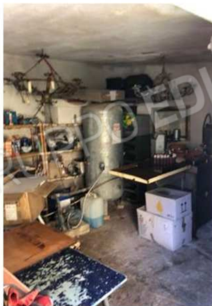
deposito e locale caldaia esterno abusivi da demolire