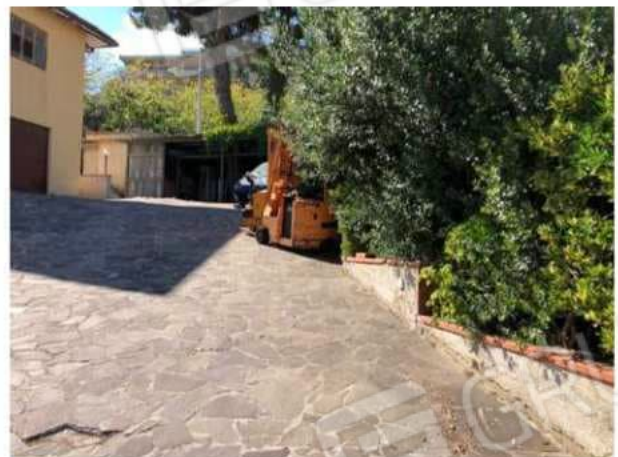
area a parcheggio