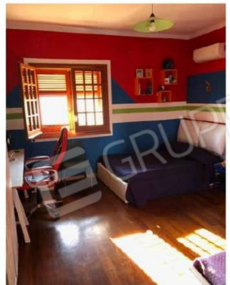
camera n. 2

Architetto Pietro Gioviale pietro.gioviale@archiworldpec.it