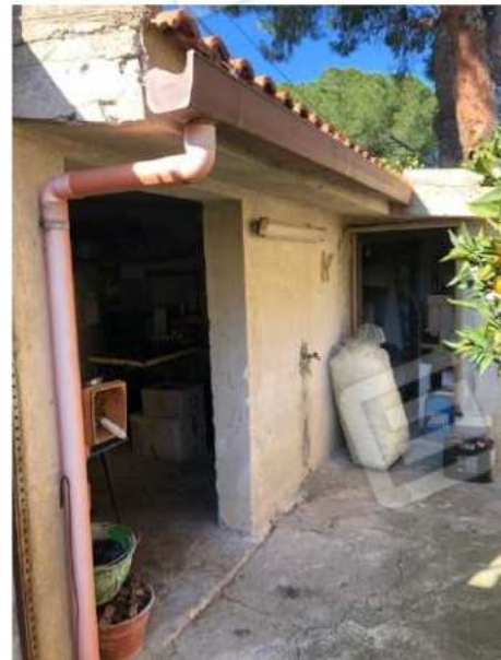
deposito e locale caldaia esterno abusivi da demolire