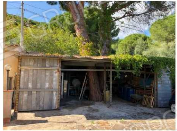
deposito esterno abusivo e da demolire