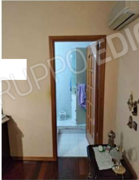
w.c. n. 2