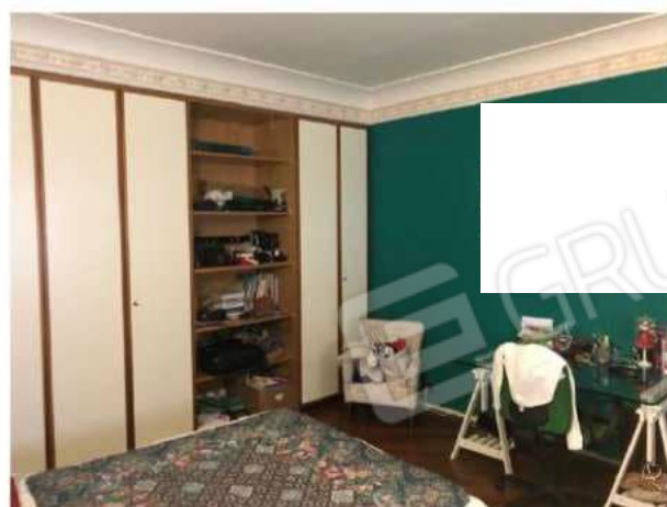
camera n. 3