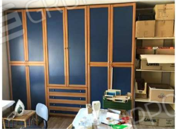
appartamento piano primo quota + 3,20