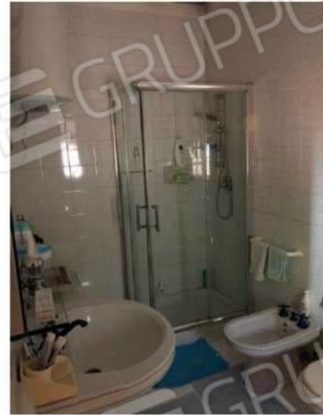
w.c. n. 2