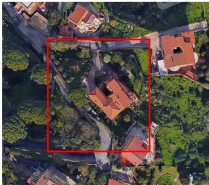
inquadramento dell'immobile