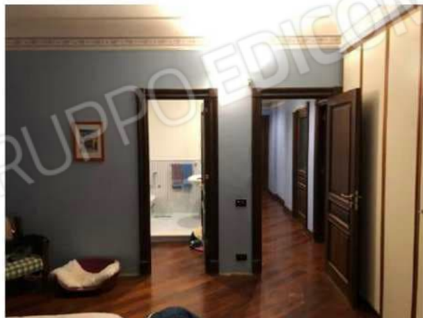
camera n. 2