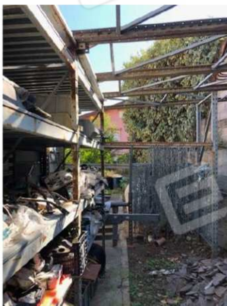
deposito esterno abusivo e da demolire