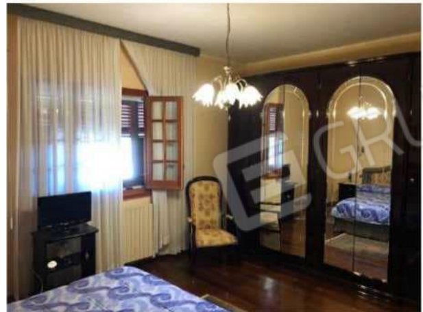
camera n. 3