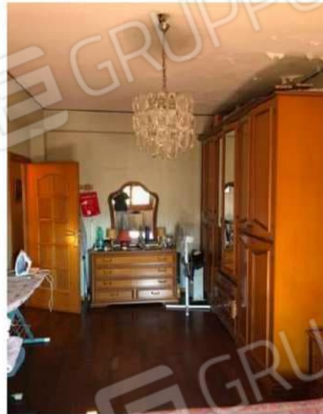
camera n. 1