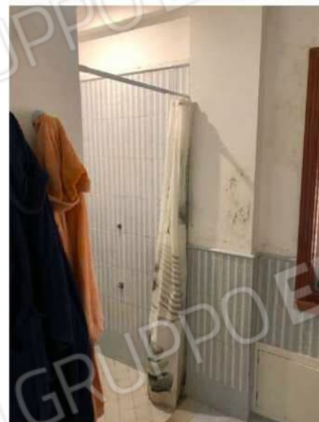
w.c. n. 1