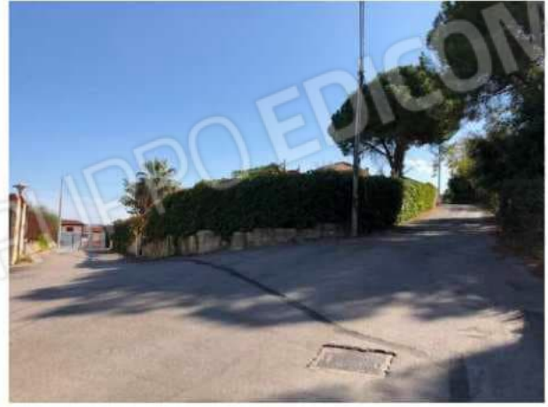
via Bronte n. 26