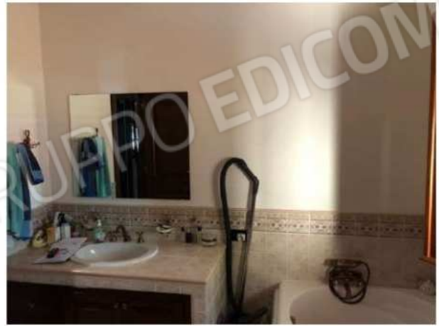
w.c. n. 2