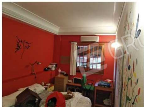
camera n. 1