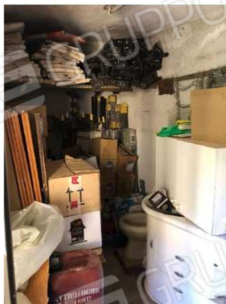
deposito e locale caldaia esterno abusivi da demolire