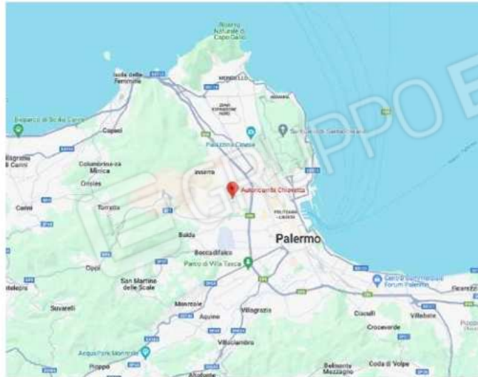
inquadramento del comune - estratto da googlemaps