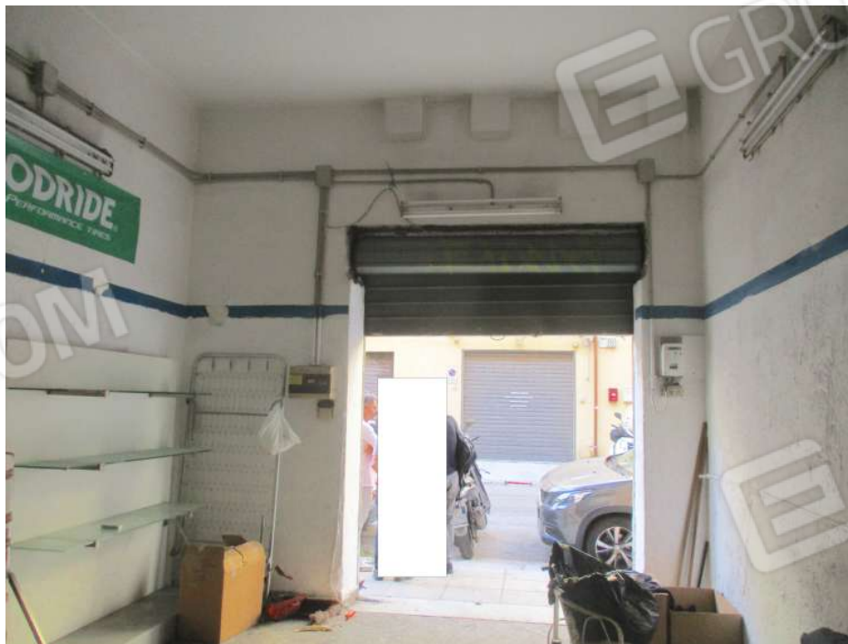
Foto 4: vista del primo ambiente del magazzino sito in Palermo via R.Riolo 63