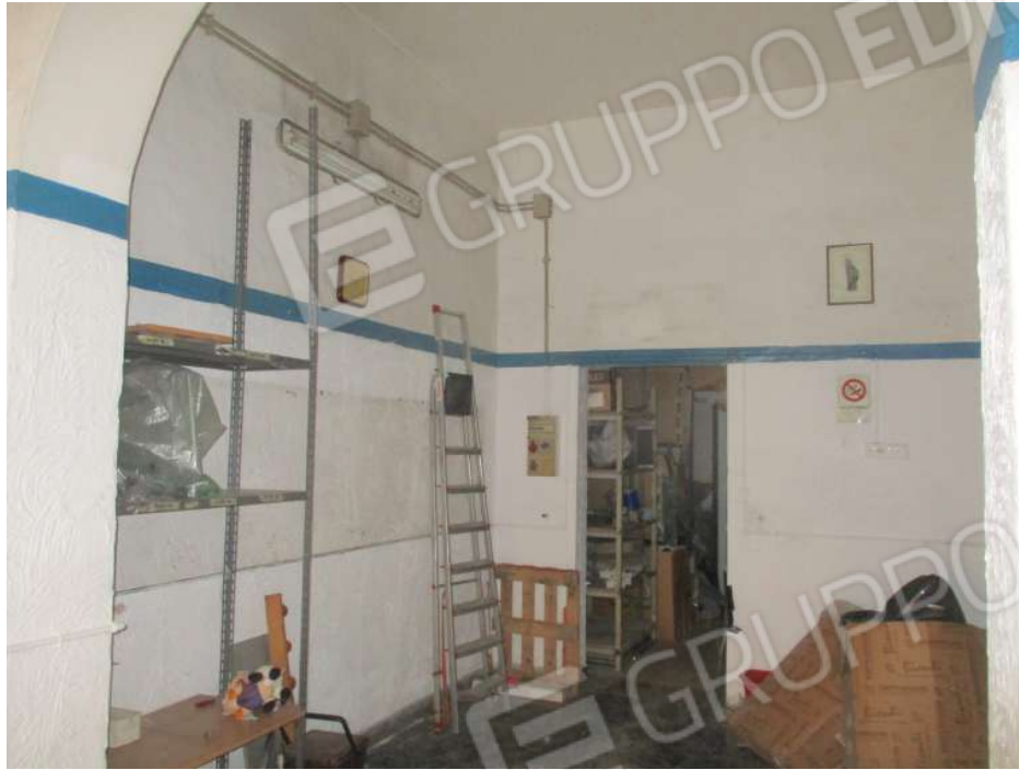
Foto 7: vista dell'ambiente centrale del magazzino sito in Palermo via R.Riolo 63