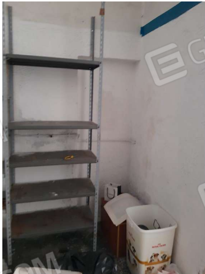
Foto 10: vista della posizione della porta di accesso dal vano scala, murata