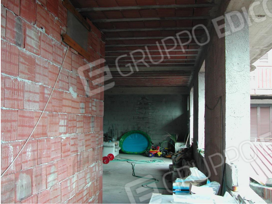
Foto 7 – Corridoio di collegamento al piano terra con la pizzeria