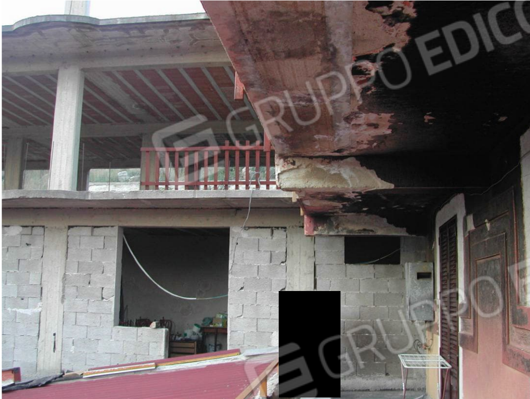
Foto 5 – Vista del prospetto principale dal balcone della villa adiacente in uso