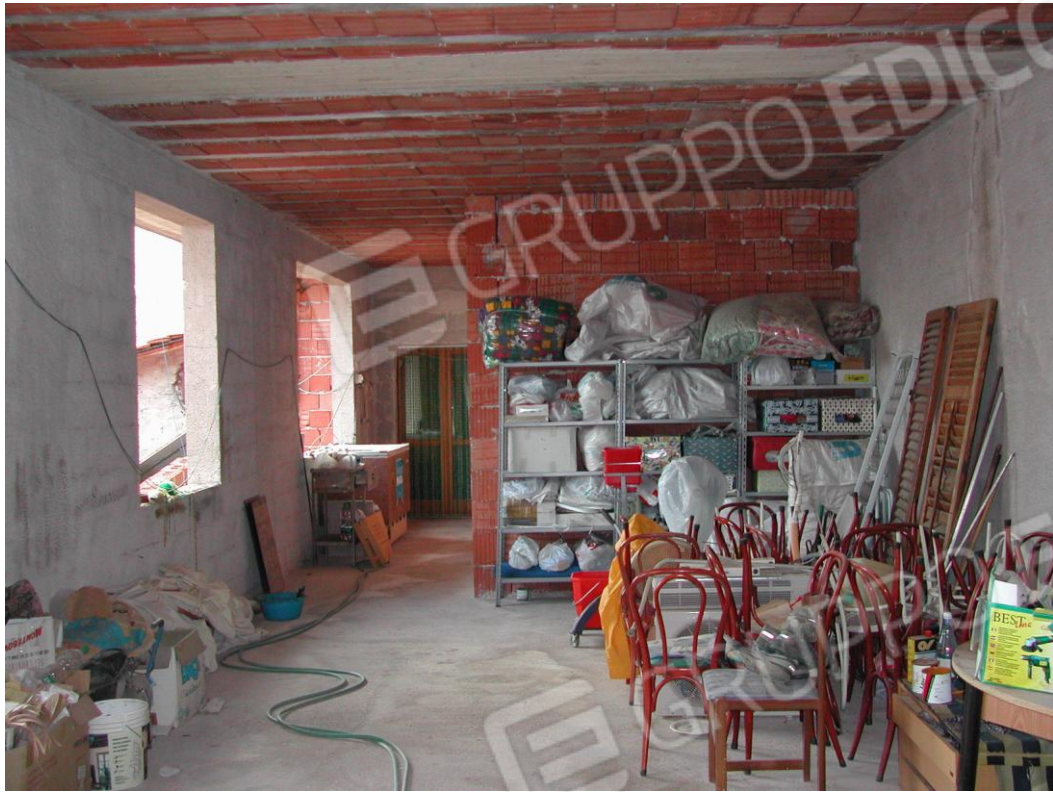
Foto 9 – Ambiente al piano terra e vista, in fondo, del collegamento alla pizzeria adiacente