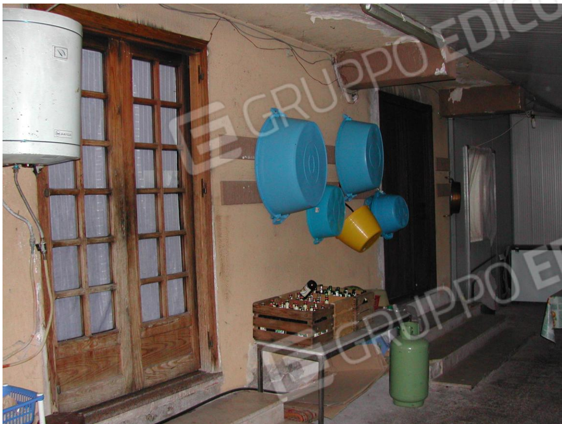
Foto 17 – Ingresso a piano terra dell'edificio attualmente occupato da una veranda adibita a cucina della pizzeria