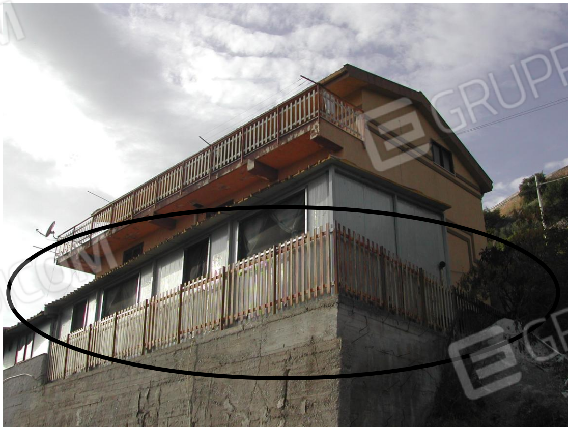
Foto 16 – Vista dalla Strada Provinciale provenendo da Misilmeri (in primo piano la veranda adibita a cucina)