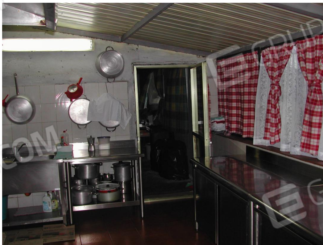
Foto 18 – Cucina della pizzeria nella veranda sul prospetto principale dell'edificio