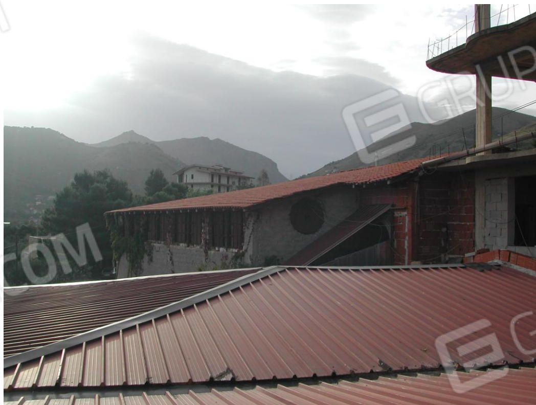
Foto 4 – Vista dall’alto della copertura della pizzeria adiacente all’edificio