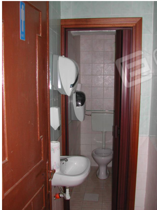
Foto 14 – Servizio igienico distinto per sesso (wc uomini) della pizzeria