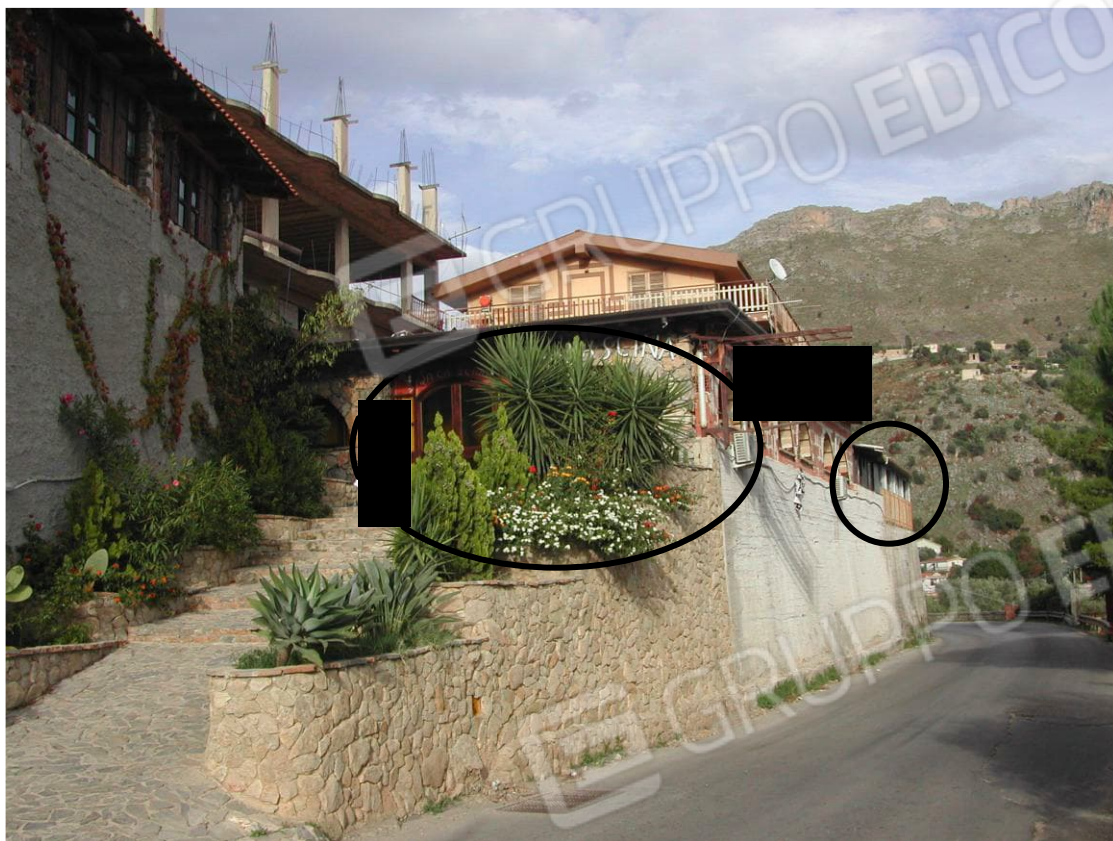
Foto 3 – Vista d’insieme del lotto edificio-pizzeria dalla Strada Provinciale percorsa verso Misilmeri. Sono evidenziati la sala pizzeria “La Cascina” (ellisse nera) e la veranda cucina della pizzeria (cerchio nero).