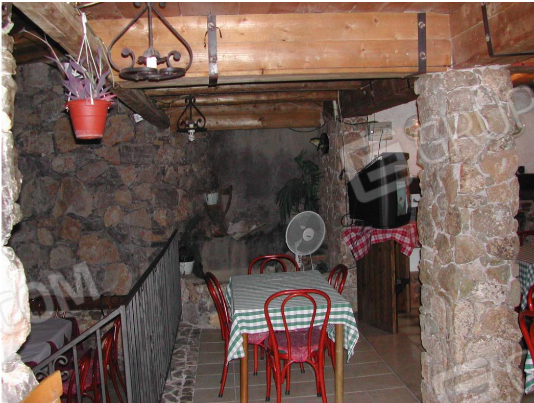
Foto 12 – Limite della zona a pizzeria al piano terra con quella di recente realizzazione con copertura di legno