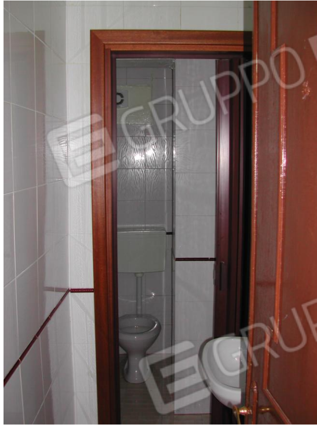
Foto 13 – Servizio igienico distinto per sesso (wc donne) della pizzeria