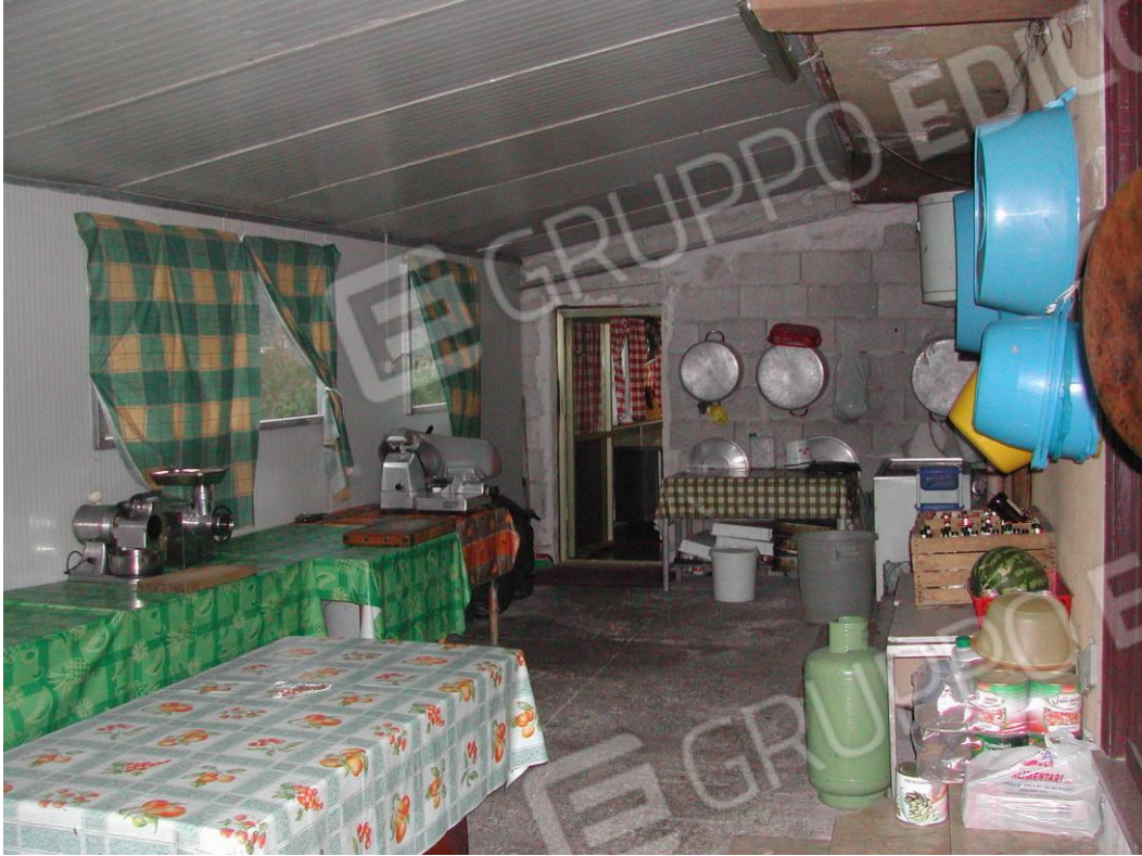
Foto 21 – Veranda e ambiente adiacente alla cucina della pizzeria