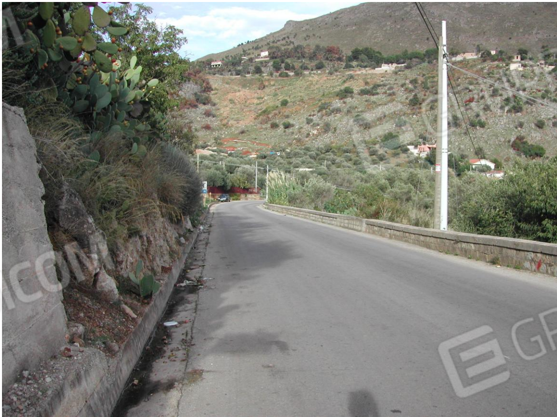
Foto 2 – Strada Provinciale da cui si accede all'immobile in esame