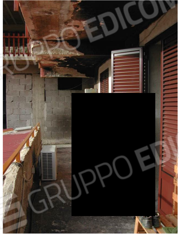
Foto 18 – Balcone sul prospetto laterale al piano 1 e porta finestra della cucina