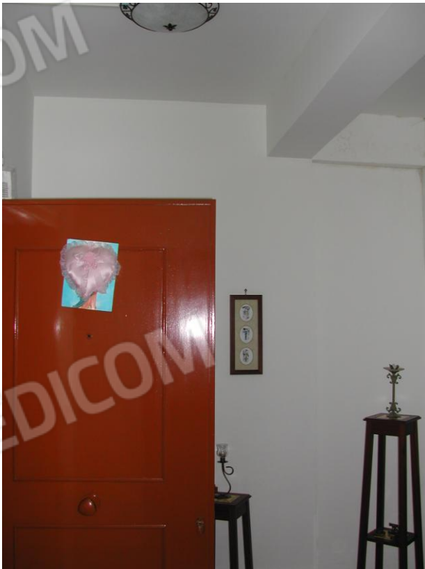
Foto 9 -Ingresso dell'appartamento al piano primo