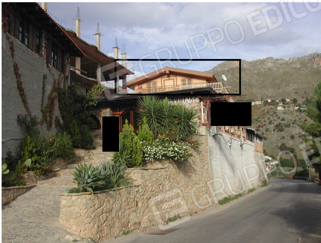
Foto 3 – Vista d'insieme del lotto edificio-pizzeria dalla Strada Provinciale percorsa verso Misilmeri. E' evidenziato l'edificio a 3 elevazioni fuori terra (rettangolo nero).