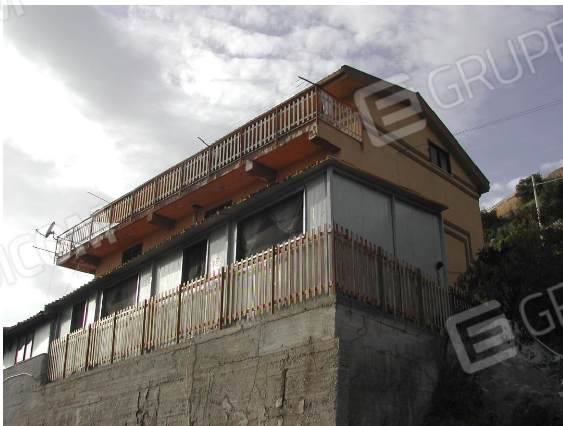
Foto 4 – Vista dalla Strada Provinciale provenendo da Misilmeri (in primo piano la veranda e sul retro l'edificio)