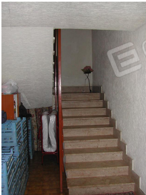
Foto 6 - Scala di accesso dal piano terra al piano primo