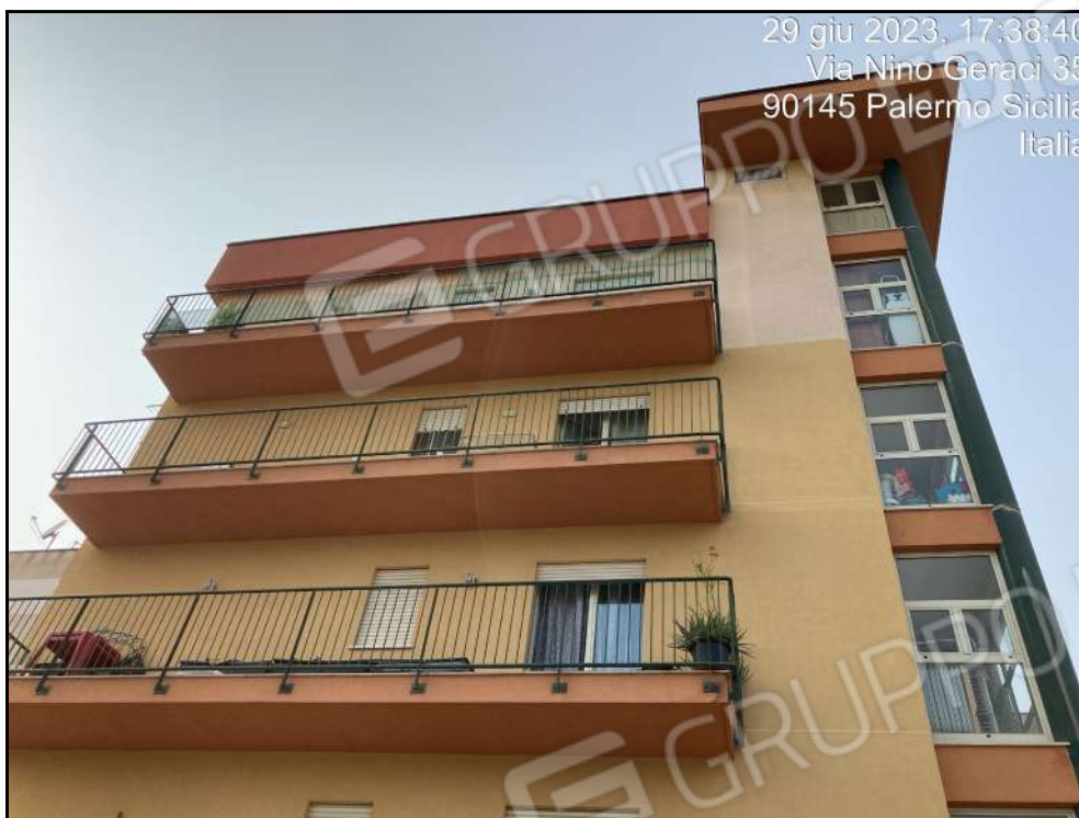
Foto n. 7 - Vista esterna Edificio Scala B