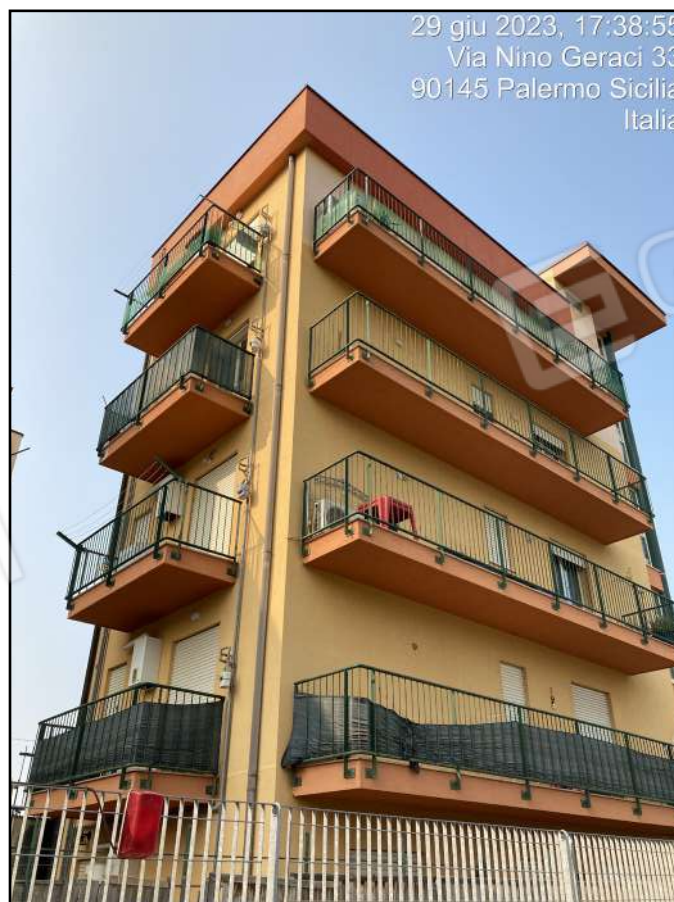
Foto n. 8 - Vista esterna Edificio Scala B