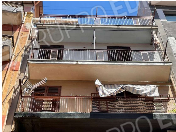
Foto 1, 2 - Prospetto dell'edificio con l'ingresso in Via Ustica n. 7. L'appartamento si trova al 4° piano