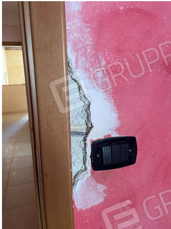
Foto 20 - Particolare della camera da letto. Si nota un distacco dell'intonaco in prossimità dell'interruttore