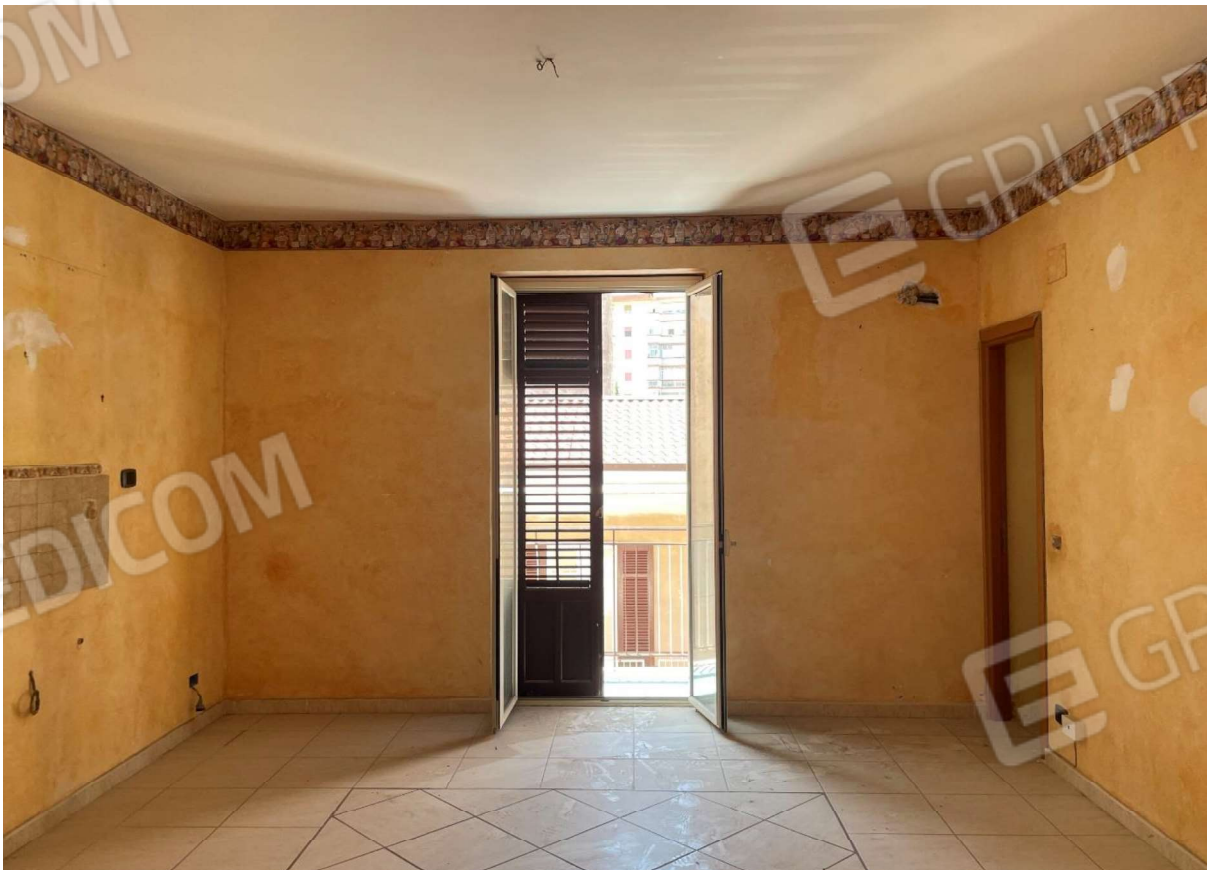
Foto 6 – La cucina soggiorno con la porta finestra da cui si accede al balcone sulla via Ustica