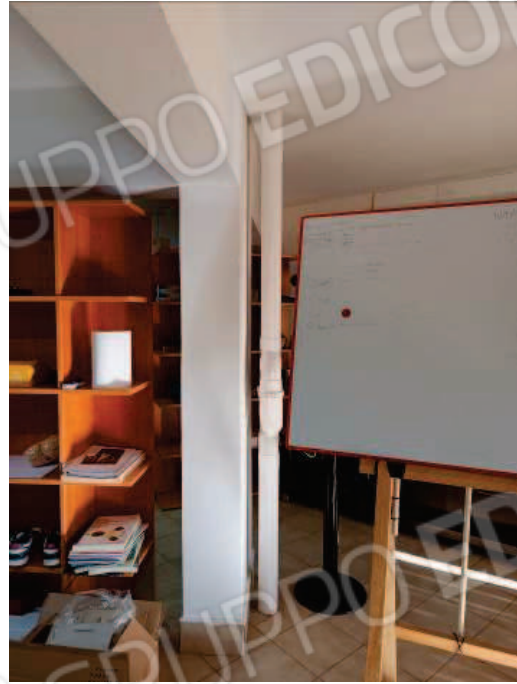
Fig. 12, 13 Scarichi condominiali.