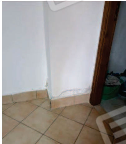
Fig. 14 Parete ingresso wc.