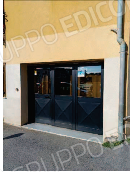
Fig. 5 Porta d'ingresso.