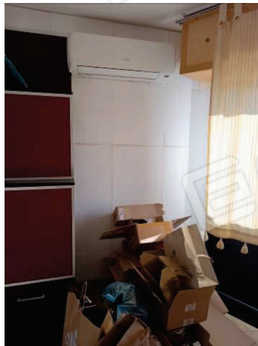
Fig. 11 Pompa di calore.