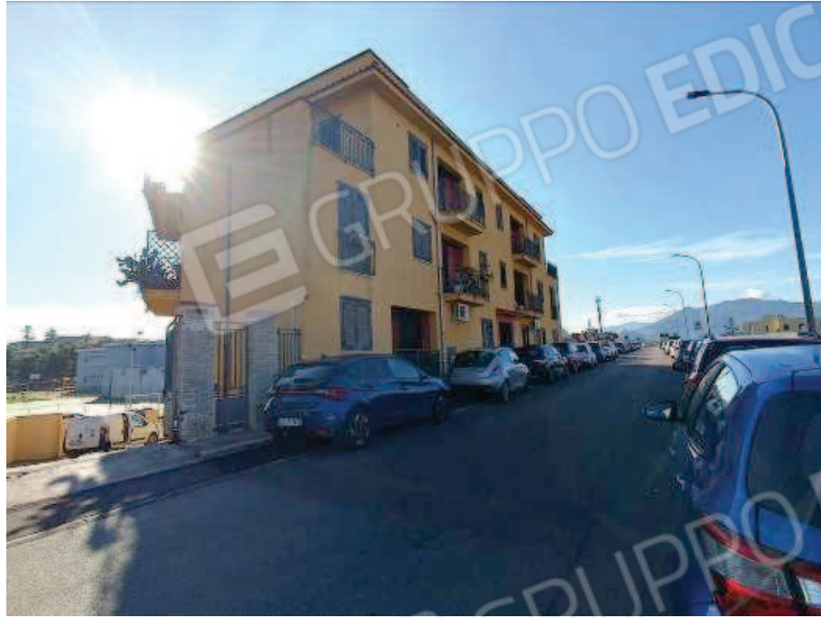
Fig. 1 Individuazione del fabbricato, Via Cotogni Bagheria (PA).