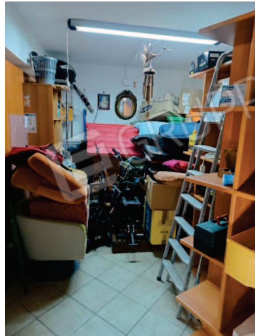
Figg. 7, 8, 9 Locale deposito.