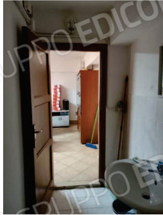
Fig. 10 Servizio igienico.