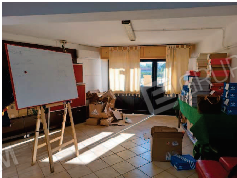
Fig. 6 Locale deposito.