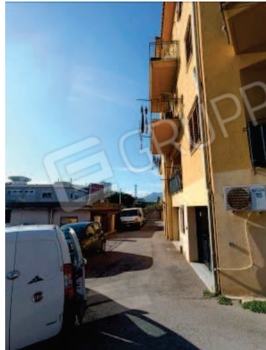
Fig. 2, 3 Rampa carrabile e area parcheggio.