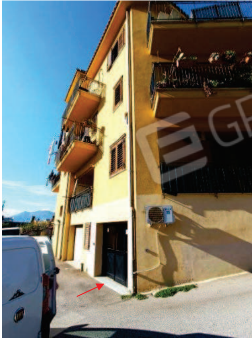
Fig. 4 Individuazione magazzino.