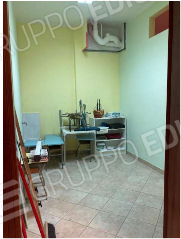
LOCALI ADIACENTI L'AMBIENTE UNICO PRINCIPALE