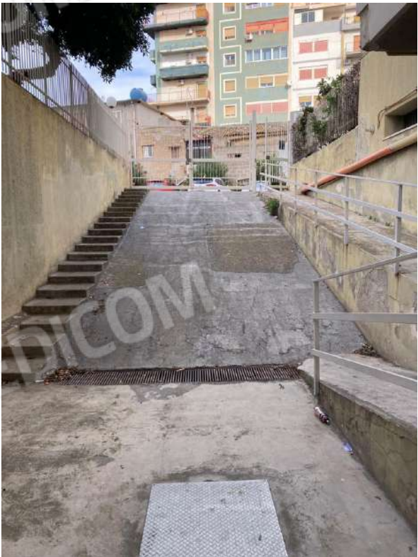
DISCENDERIA AD OVEST