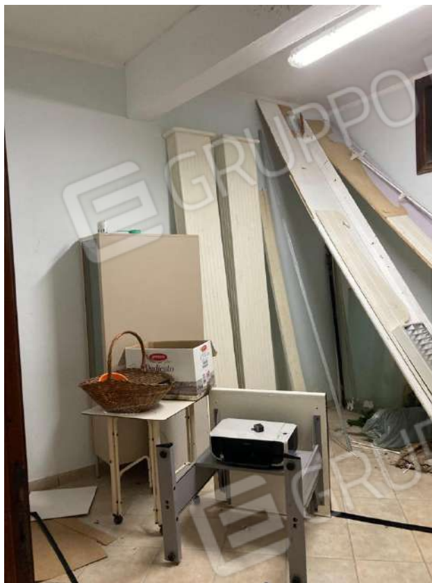
SECONDA STANZA ENTRANDO A DESTRA