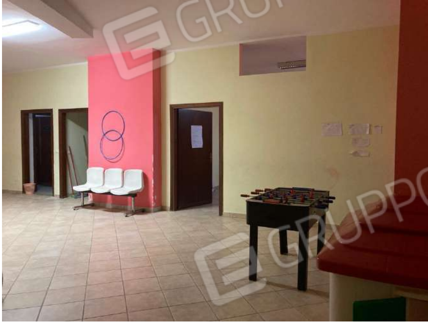
INGRESSO ALLA ZONA A4