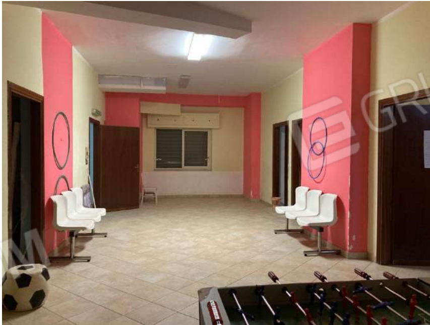
AMBIENTE UNICO CON APERTURA VERSO DISCENDERIA