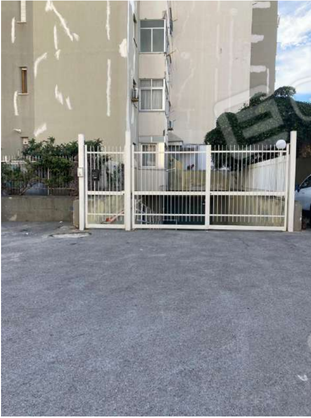
CANCELLO DI ACCESSO AD OVEST