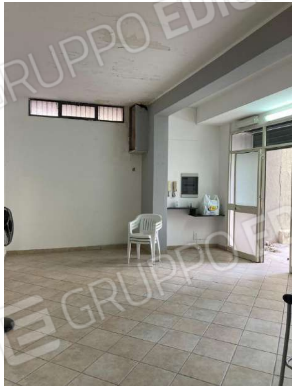
INGRESSO ALL'UNITA' IMMOBILIARE