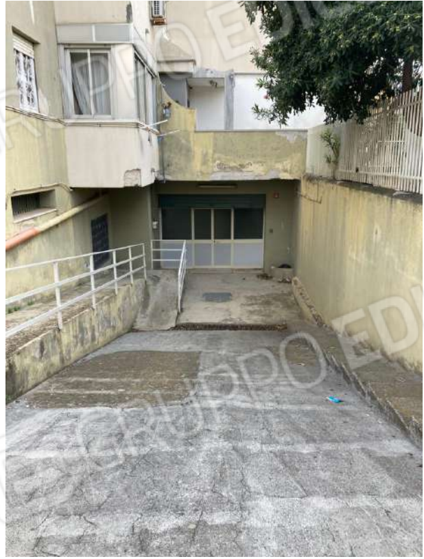
DISCENDERIA ED ACCESSO AD OVEST