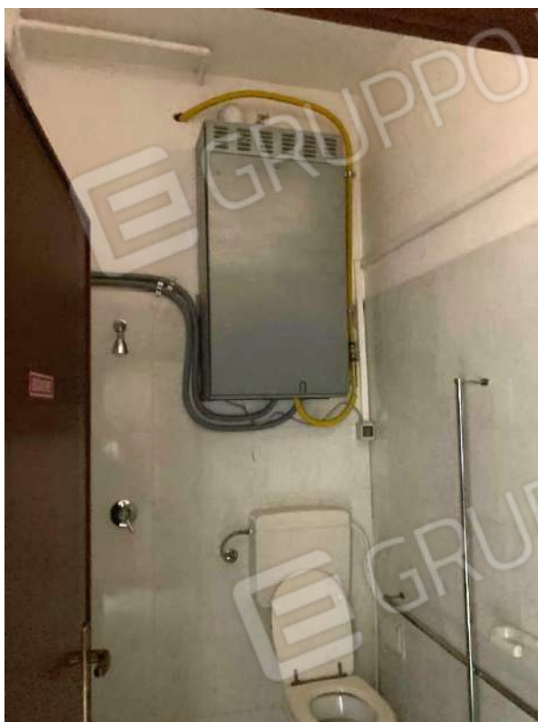
CALDAIA VERSO LA DISCENDERIA A EST