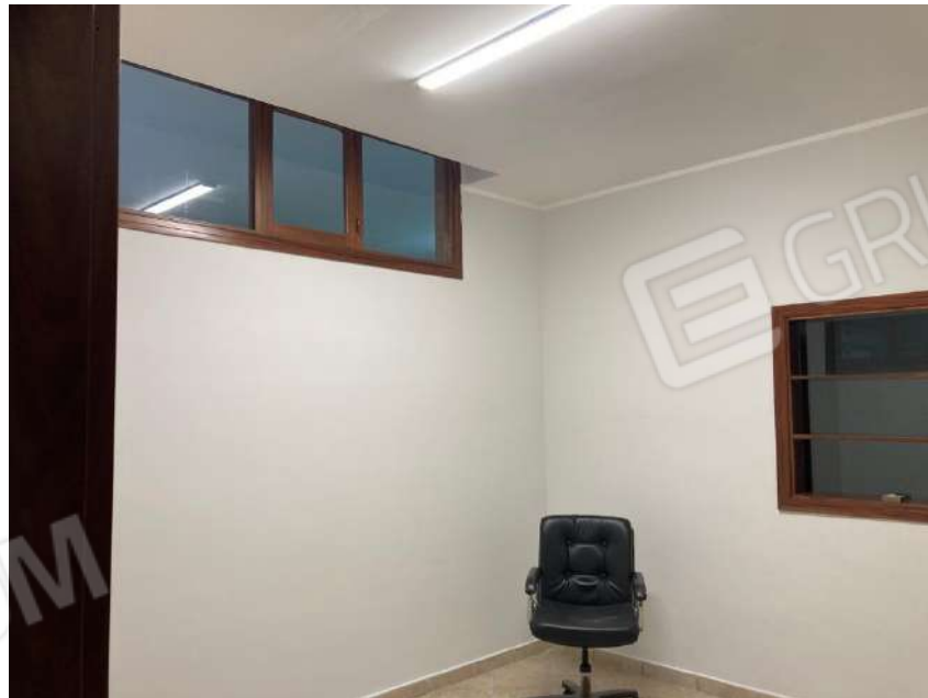
PRIMA STANZA ENTRANDO A DESTRA