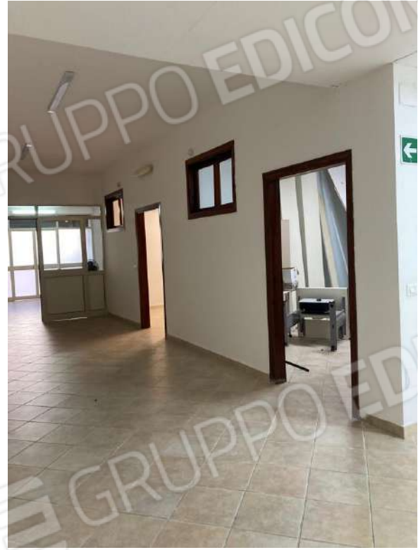
CORRIDOIO CHE IMMETTE NELLA ZONA B3 E INGRESSO STANZE