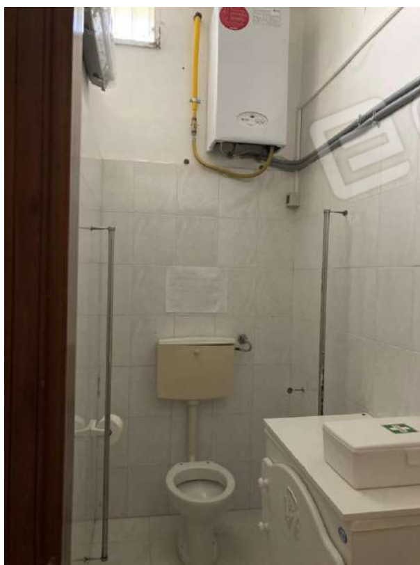
CALDAIA VERSO LA DISCENDERIA A OVEST