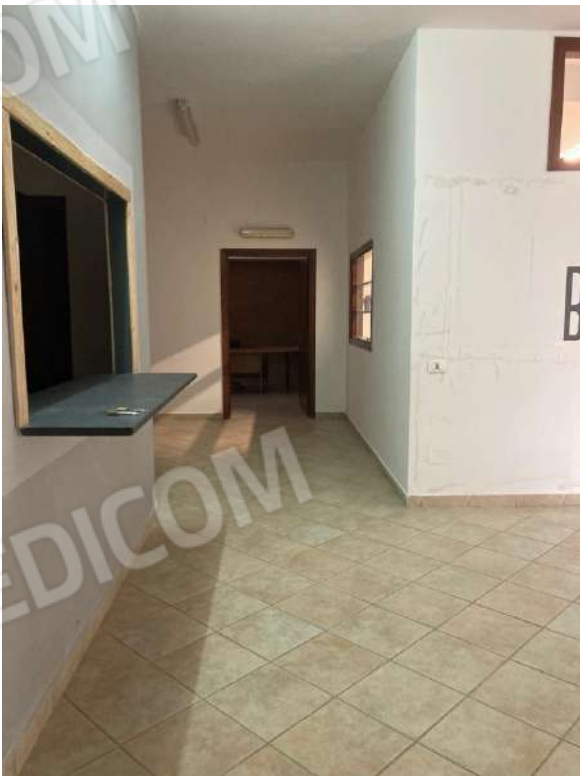
ACCESSO LOCALE UFFICIO