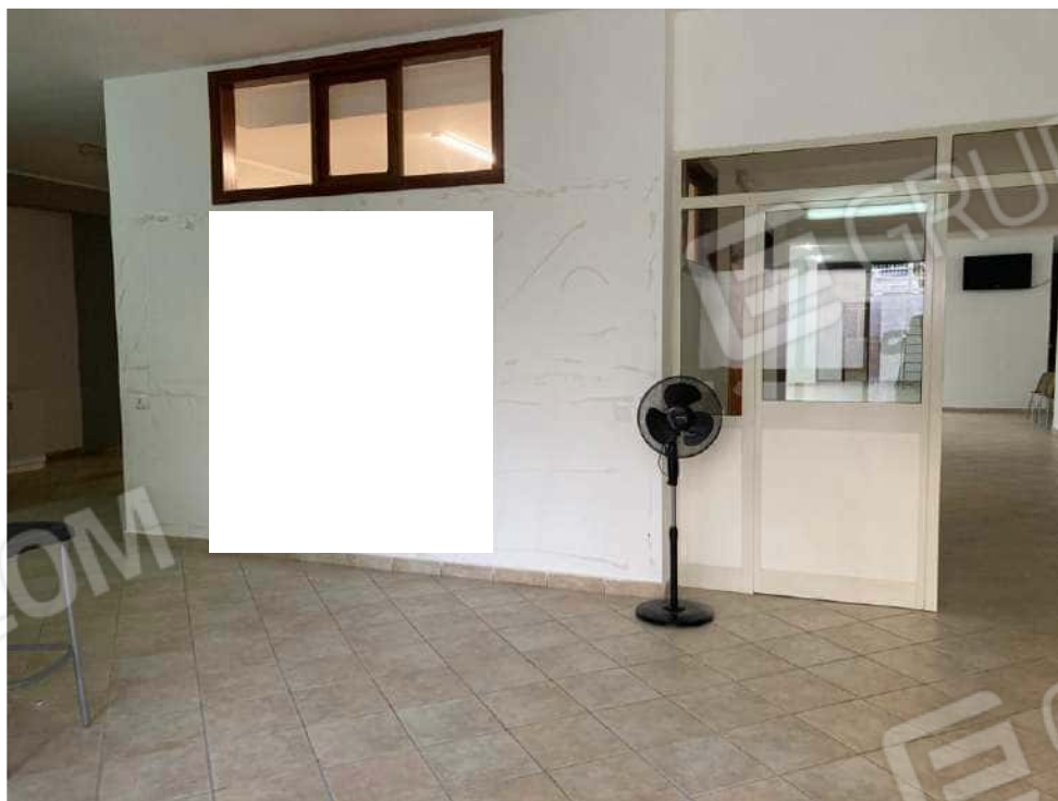
ACCESSO VERSO LA ZONA B4