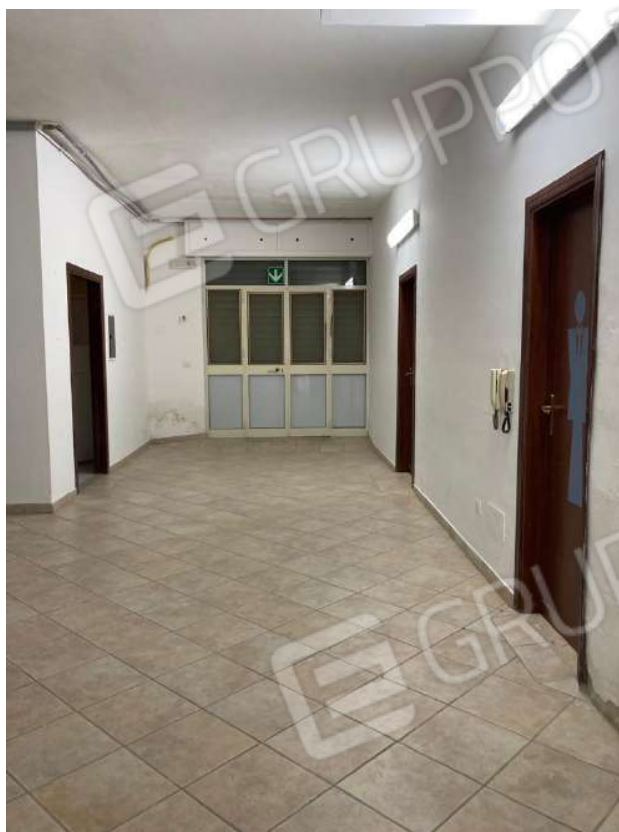
ACCESSO ZONA A3