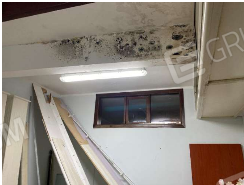
AREE INTERESSATE DA AMMALORAMENTO DELL'INTONACO PER PRESENZA CAVEDI