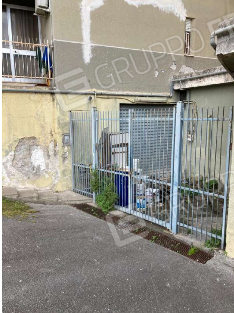
DISCENDERIA E CANCELLO DI ACCESSO A EST