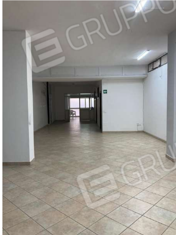
ACCESSO ZONA B3