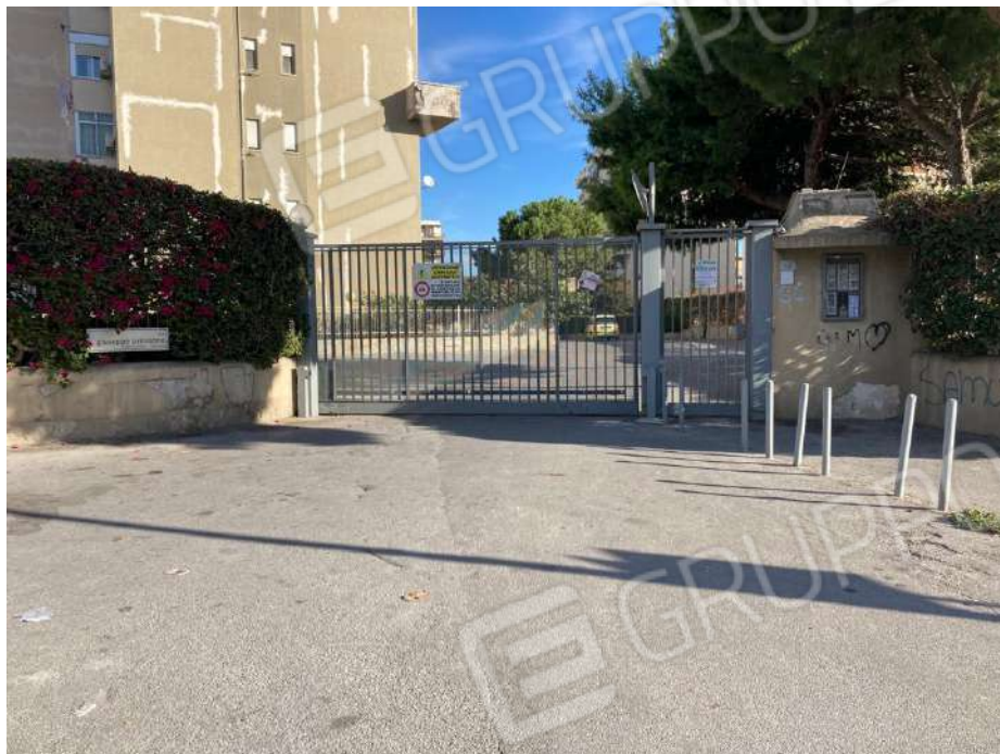
CANCELLO DI ACCESSO AL COMPLESSO CONDOMINIALE VIA G. CIRRINCIONE N.64