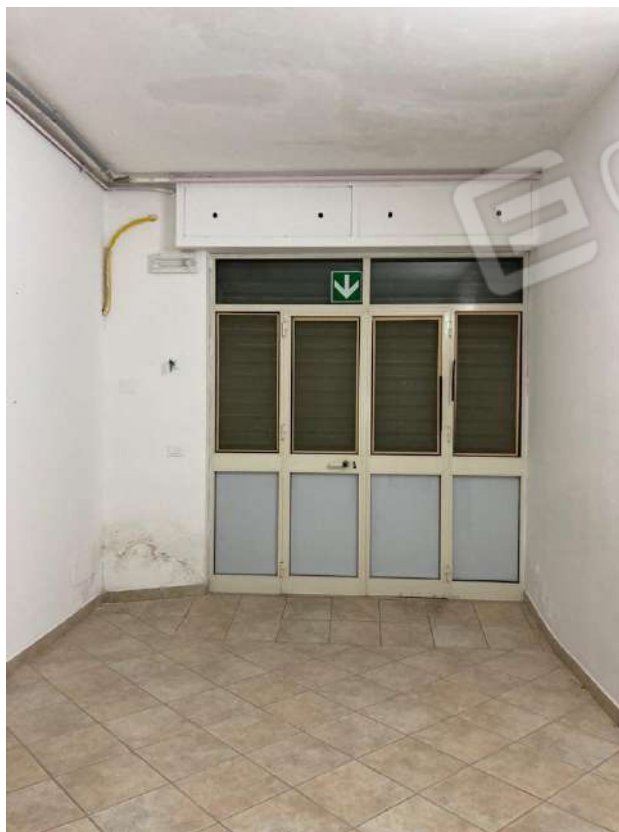
PORTA DI INGRESSO DA DISCENDERIA AD EST