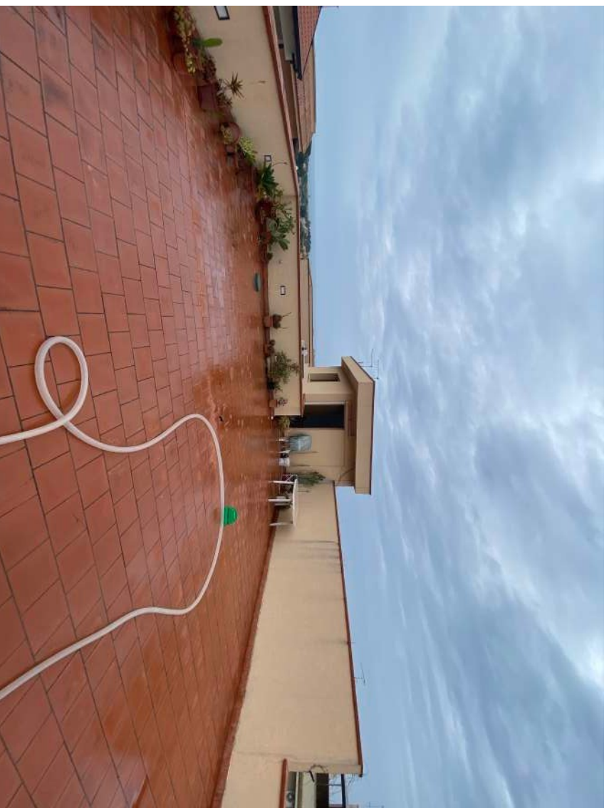
Figura 2s – Lastrico solare