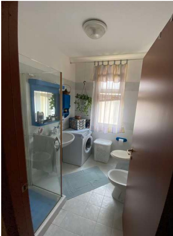
Figura 2.m – W.C. 1