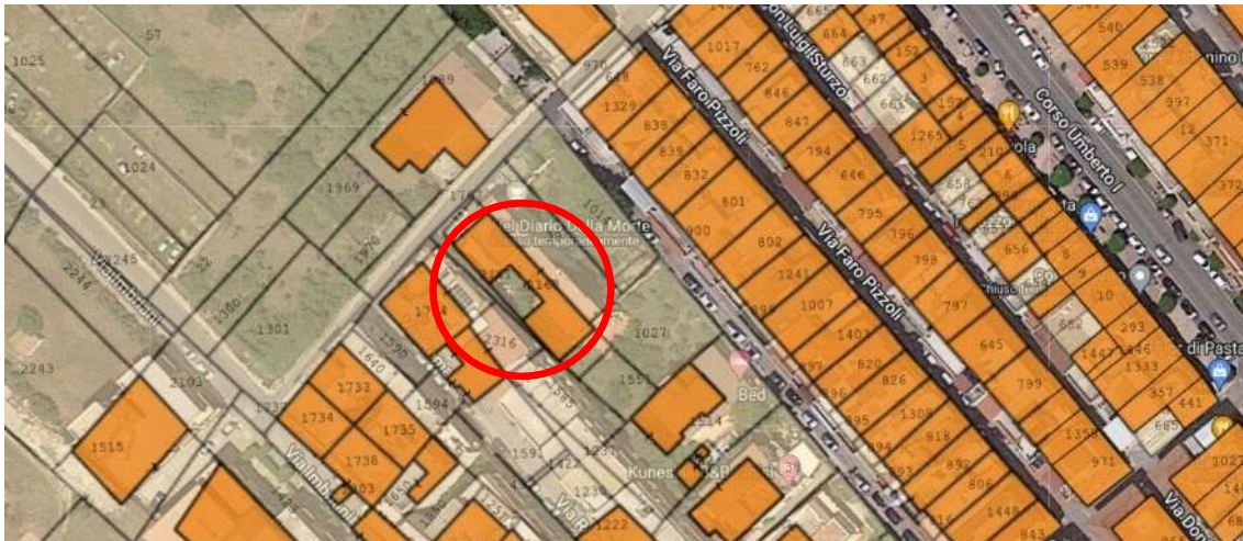
Figura 1.a - Ortofoto della zona che identifica il LOTTO A.