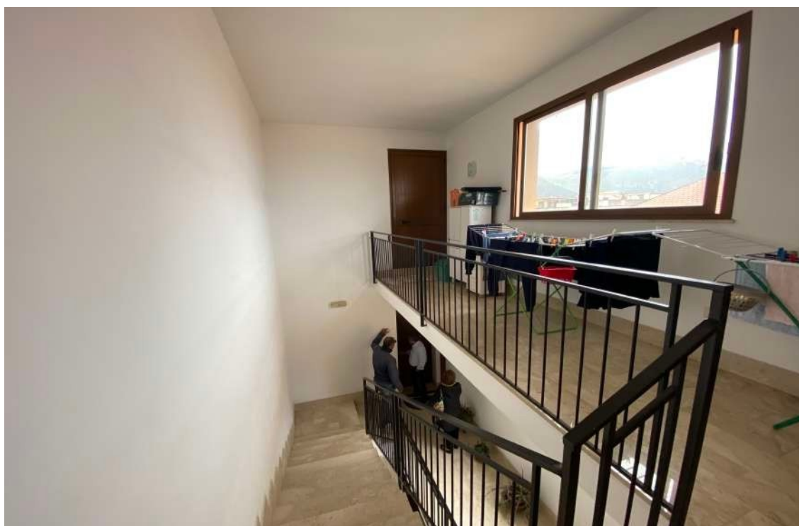
Figura 2.q – Accesso al lastrico solare

Durante le verifiche che sono state effettuate, si è riscontrata la mancanza della planimetria catastale .