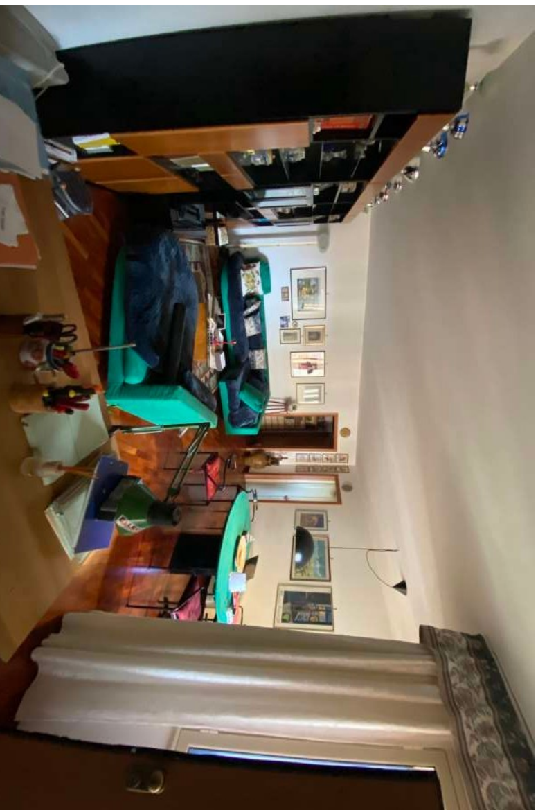
Figura 2.e-Zona living.