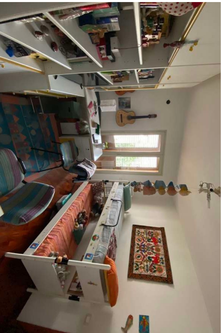
Figura 2.1 – Seconda camera da letto