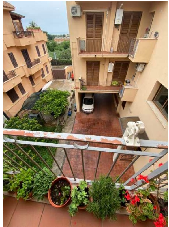
Figura 2.p – Vista balcone su atrio interno