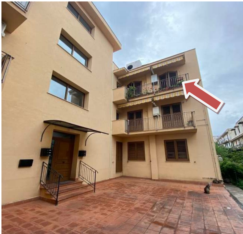
Figura 2.c–Corte con portone di ingresso