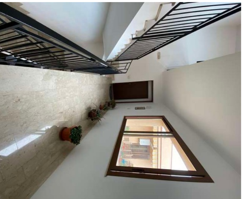
Figura 2.d-Accesso all'immobile P2