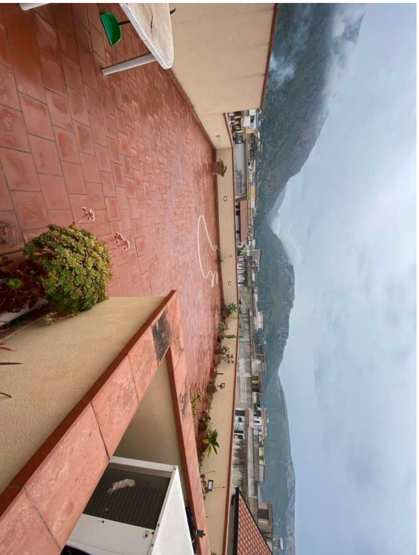
Figura 2.r – Lastrico solare