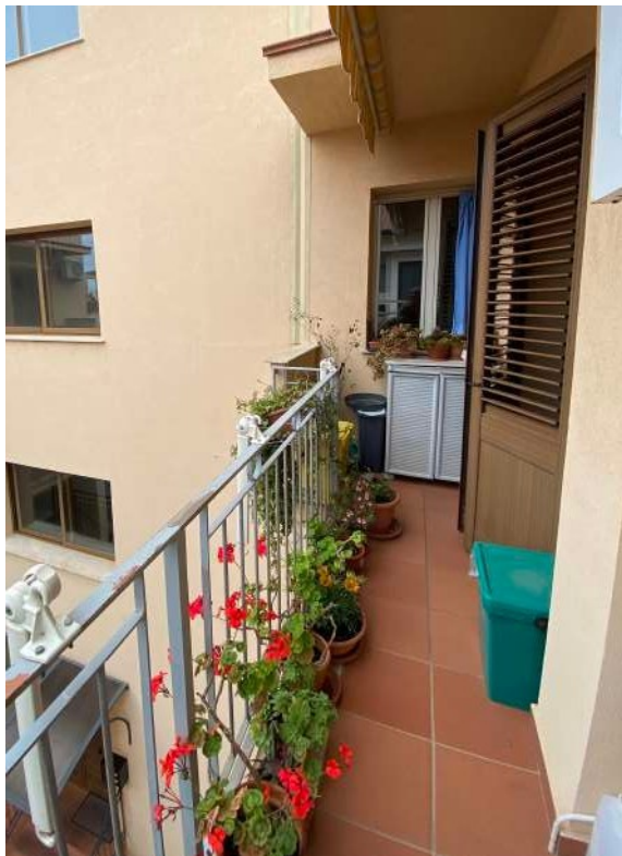
Figura 2.o – Vista balcone su finestra living