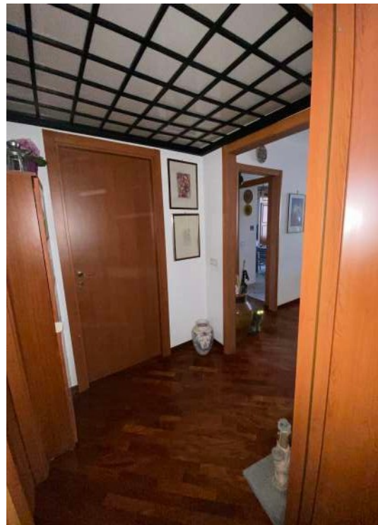
Figura 2.h – Disimpegno salotto-camere-w.c..