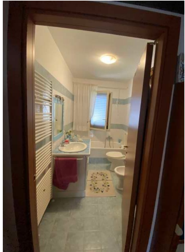
Figura 2.n – W.C. 2