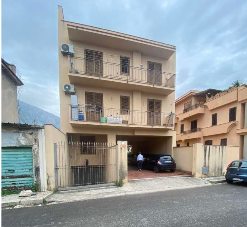
Figura 2.b–Vista dell'ingresso al condominio sito in via Guerrino Miglioranzi SNC