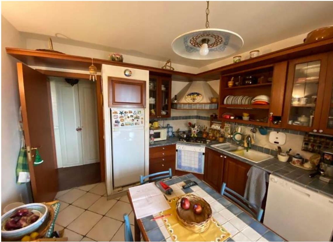
Figura 2.f – Cucina.