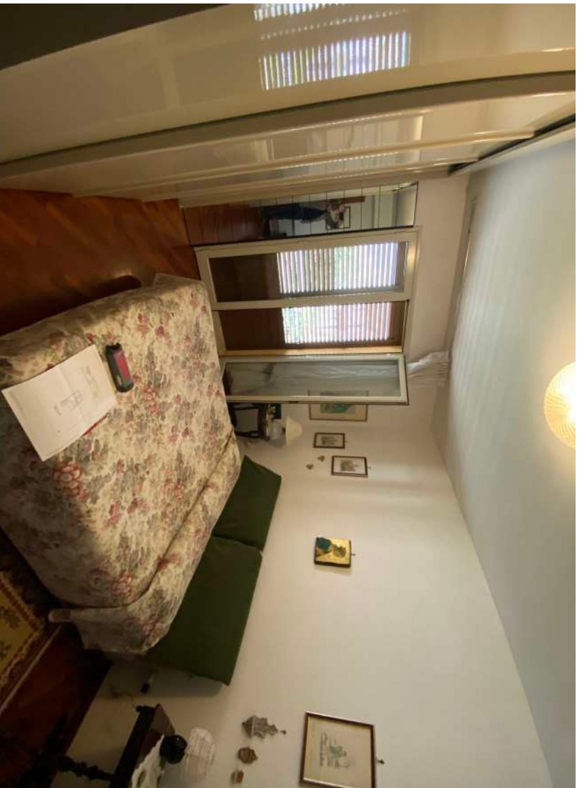
Figura 2. i – Camera da letto padronale