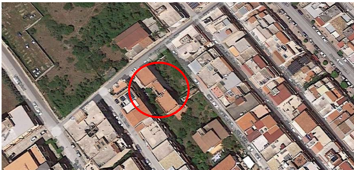
Figura 1.a - Ortofoto della zona che identifica il LOTTO A.

Al fine dell'esatta individuazione dell'unità immobiliare, si riportano le foto satellitari dell'area e la sovrapposizione dell'Ortofoto con la mappa catastale, con evidenziato l'immobile oggetto di Procedura Esecutiva.