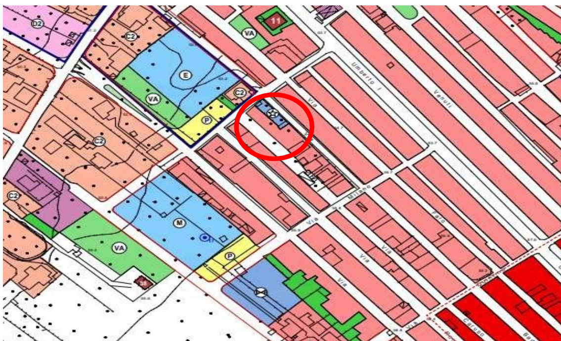
Figura 2.a–Stralcio del Piano Regolatore Generale di Cinisi

Secondo il P.R.G. di Cinisi - Delibera approvata nel Febbraio 2008 ai sensi delle modifiche introdotte dal D.dir 1466/2006 - Tavola 7d, l’immobile è individuato nella Zona B1 - Aree residenziali sature dei tessuti urbani consolidati.