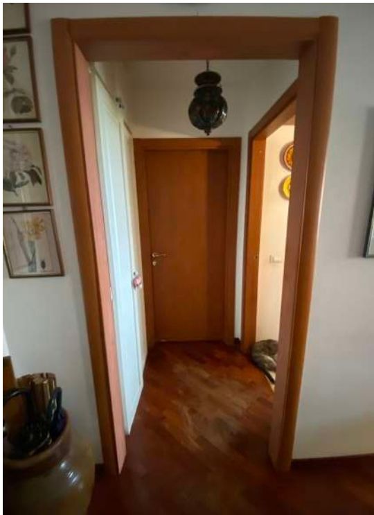
Figura 2.g – Disimpegno salotto-cucina- w.c..