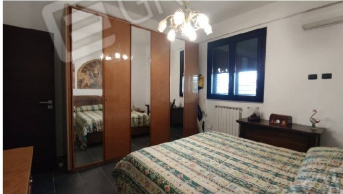
Fig. 14 camera matrimoniale