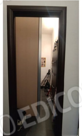
Fig. 15 ripostiglio