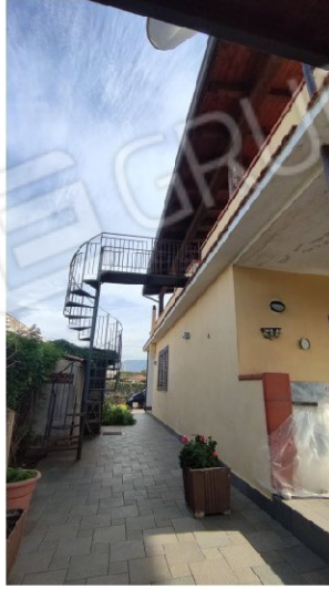
Fig.18 scala di accesso alla terrazza