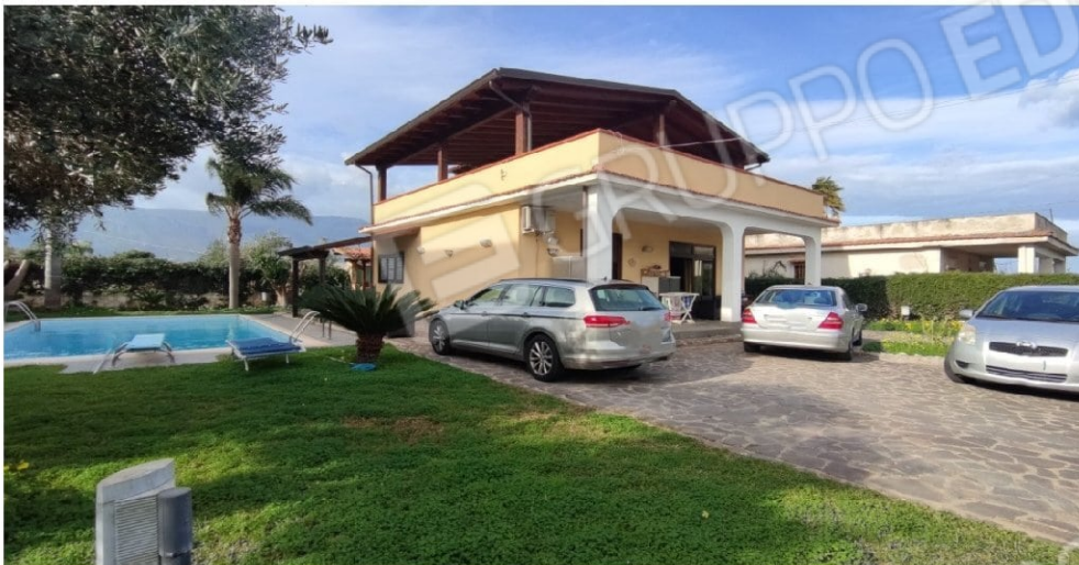
Fig. 8 prospetto principale