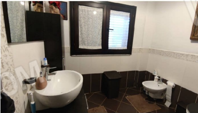
Fig. 16 bagno con doccia