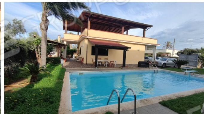
Fig. 10 prospetto lato sinistro