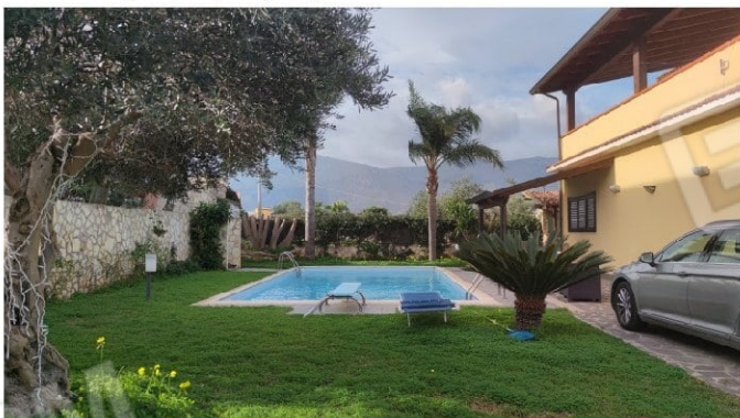
Fig. 9 vista sulla piscina