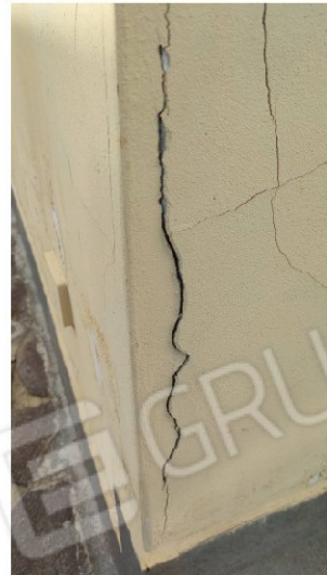
Fig.20-21-22 distacchi dell'intonaco e fessurazioni nei pilastri del porticato