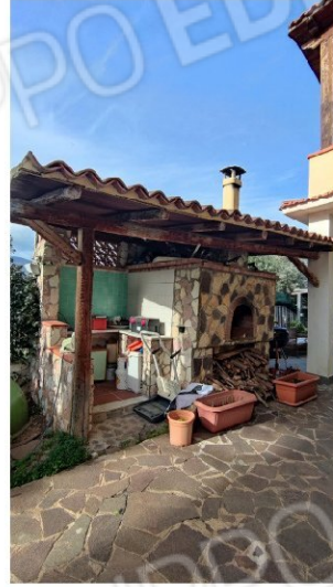
Fig.19 tettoia posta sul retro con forno a legna in muratura