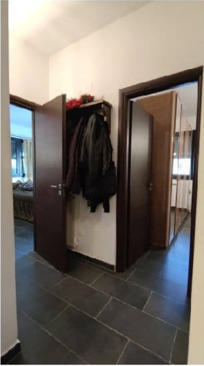
Fig. 13 disimpegno