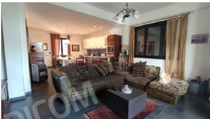
Fig. 11-12 vista dall'ingresso su salone-cucina