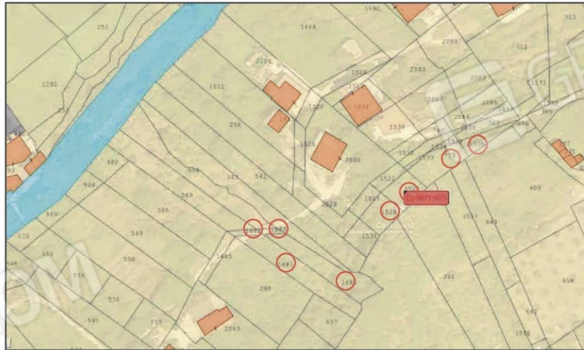
Sovrapposizione tra immagine satellitare ed estratto del foglio di mappa - All. 1