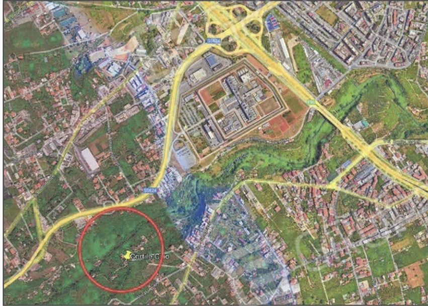
Immagine satellitare dei luoghi