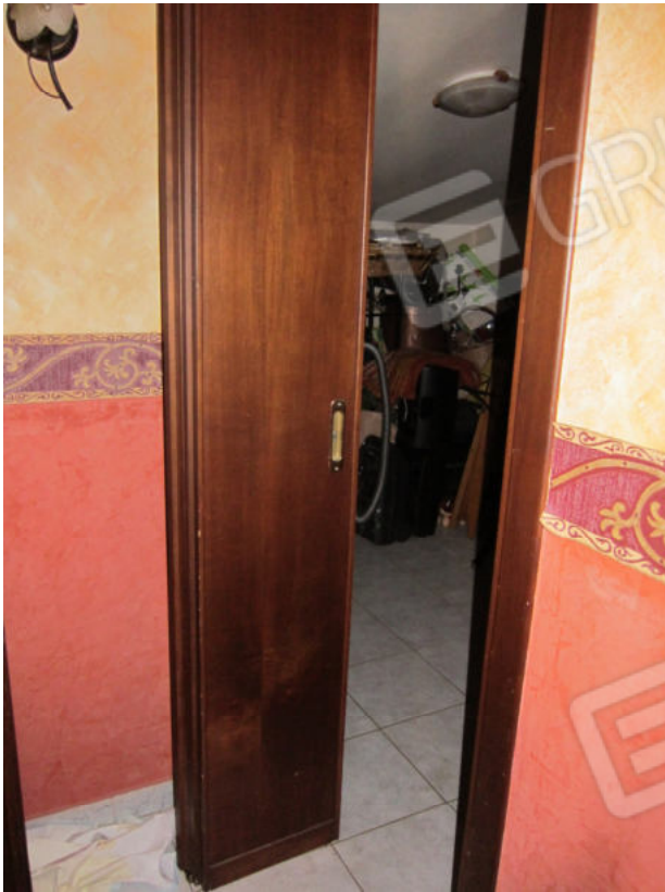
17. Locale sottotetto dx