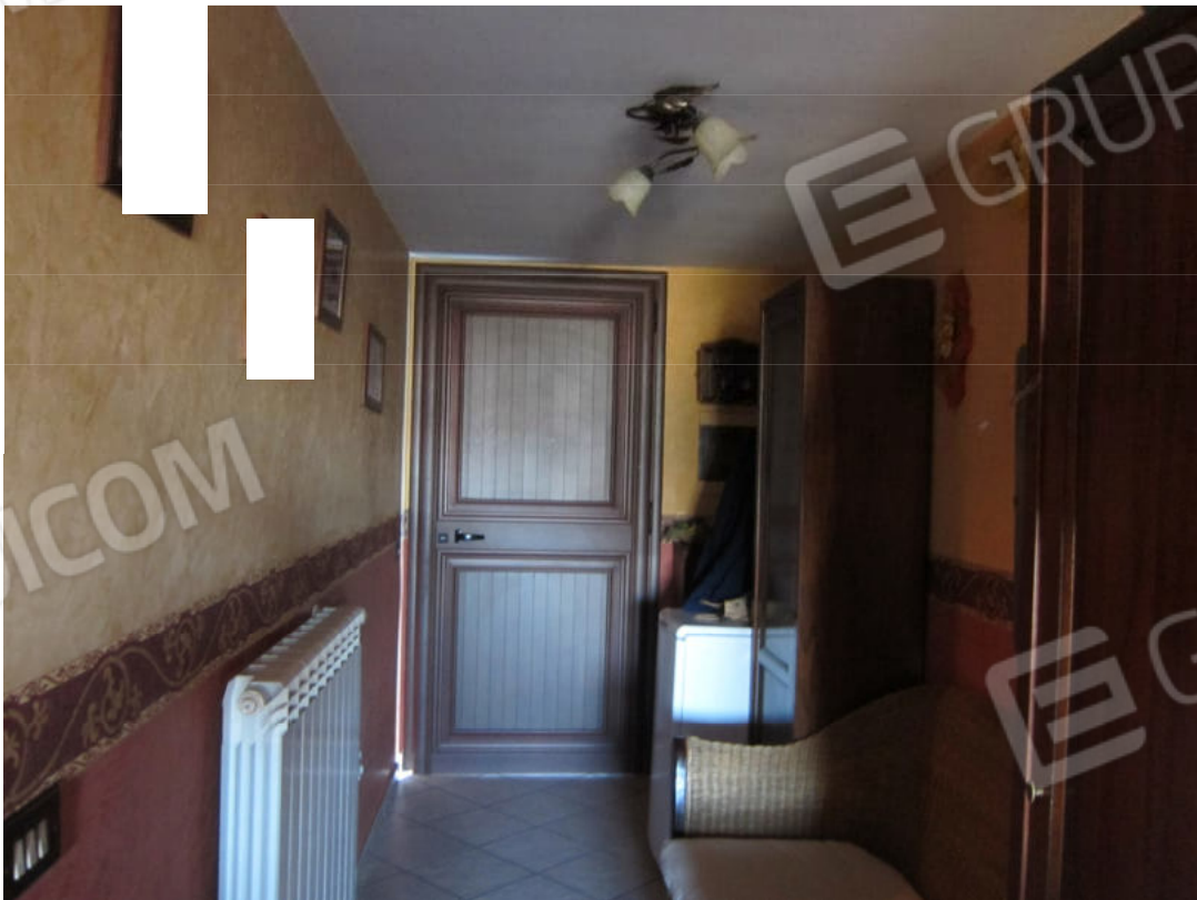
6. Vano di ingresso