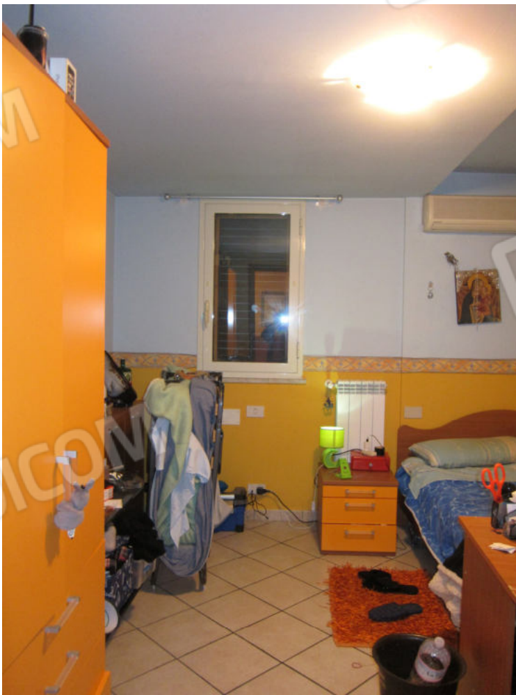
12. Vano 1