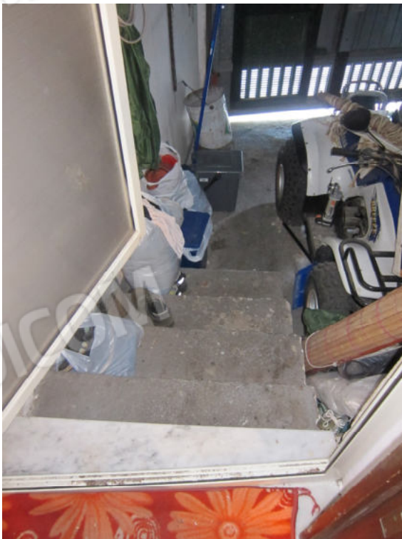
24. Scala e locale di piano terra