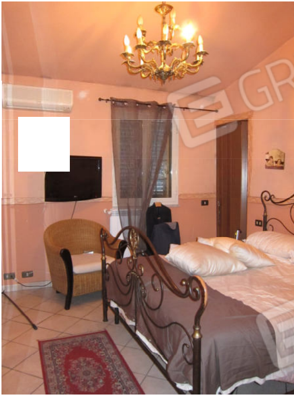
13. Vano 2