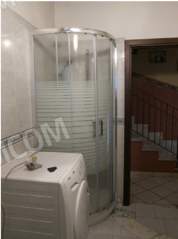
38. Bagno 1