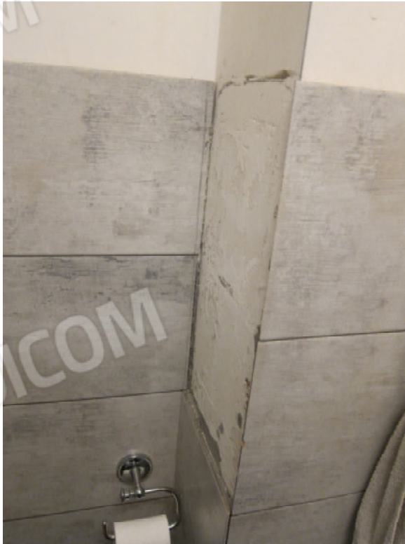
42. Bagno 2