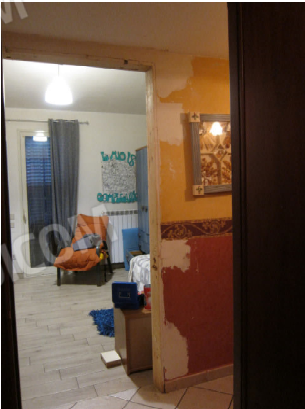
14. Vano 3