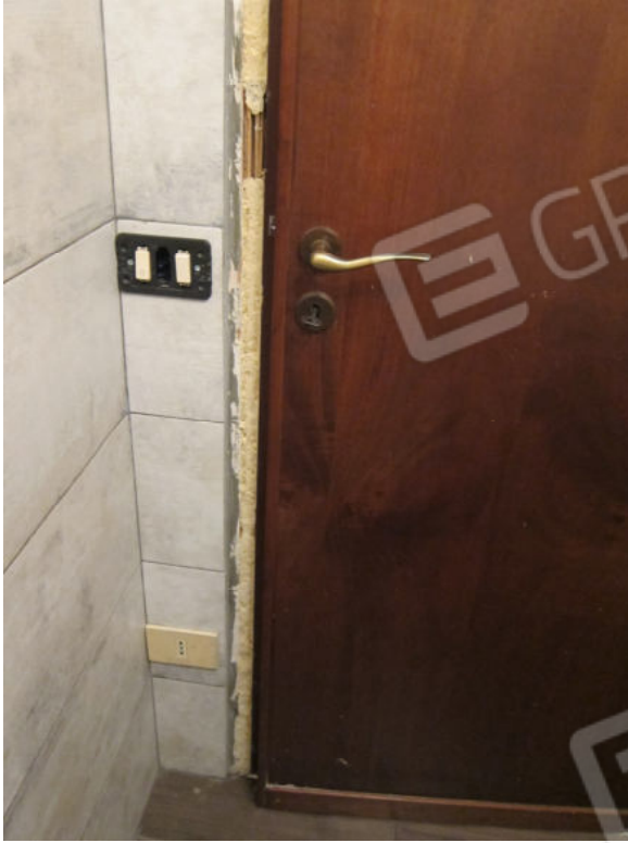
41. Bagno 2