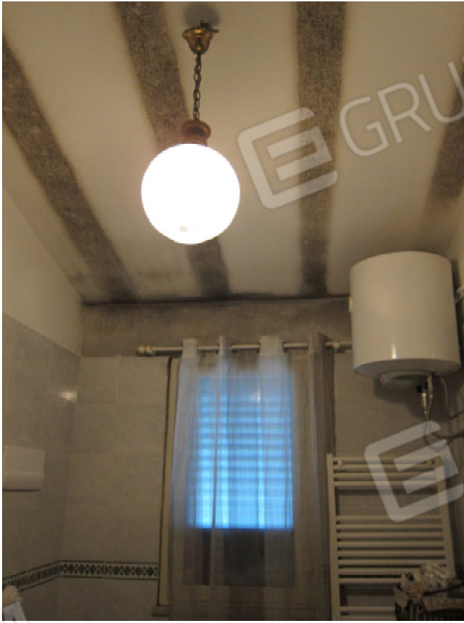
39. Bagno 1