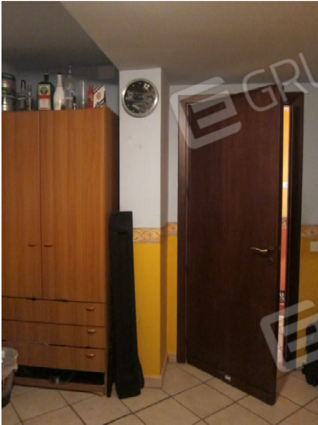
35. Infissi interni