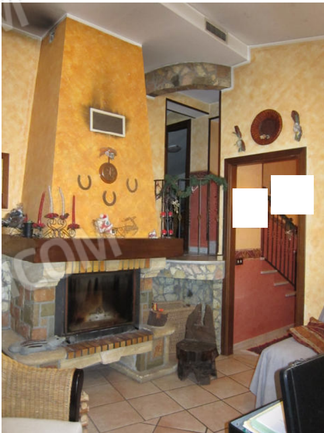
22. Soggiorno – pranzo – cucina