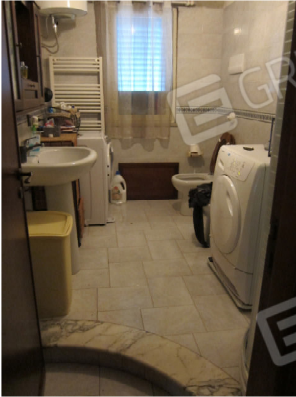
37. Bagno 1