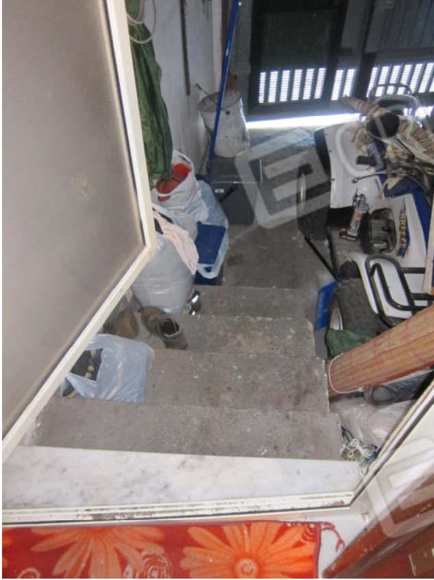
43. Scala di collegamento al locale di piano terra con accesso da Corso Piano Renda