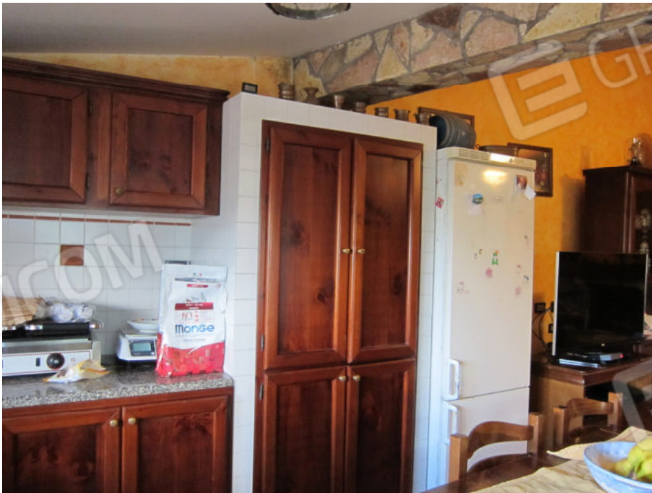
34. Zona cucina