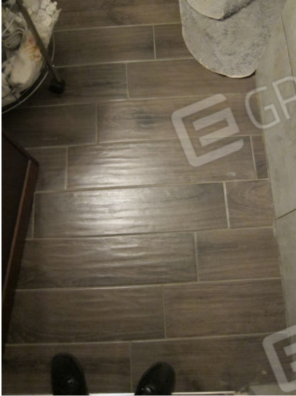
31. Bagno 2