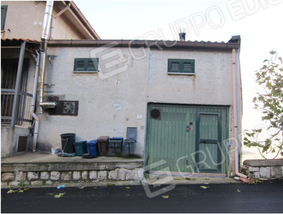
5. Accesso al locale box/deposito con scala di collegamento al piano primo