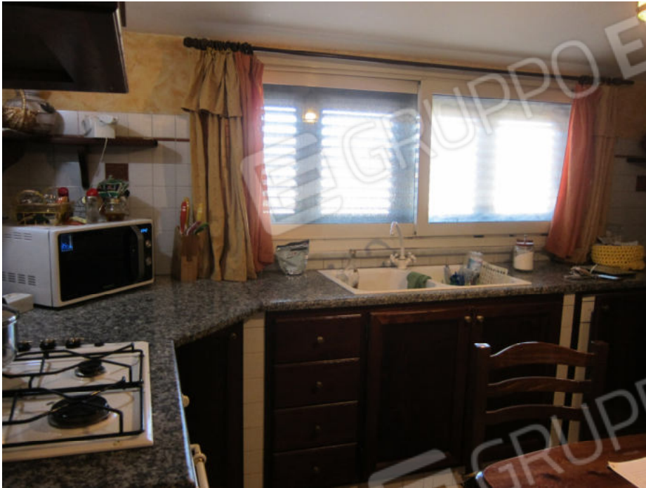
25. Zona cucina