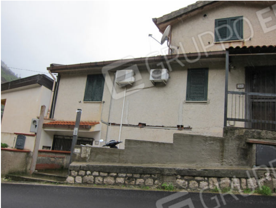
3. Corso Piano Renda 96 A