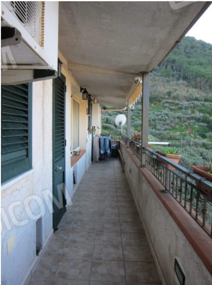
8. Balcone sul retrospetto