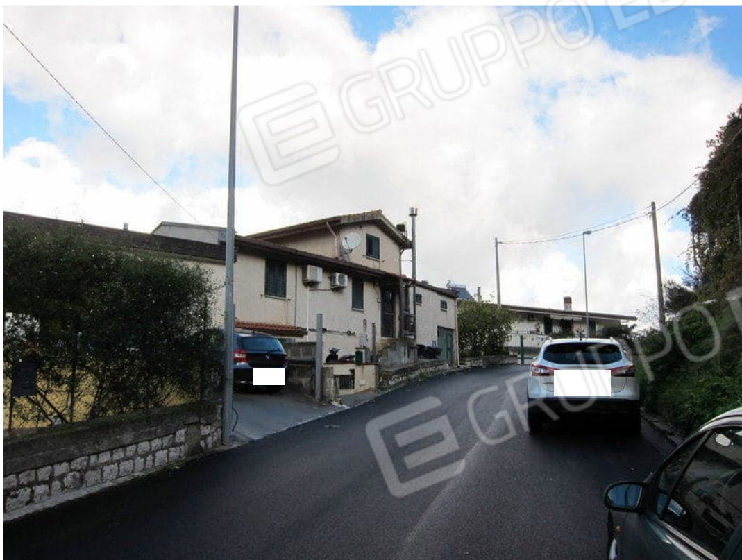
1. Prospetto su strada