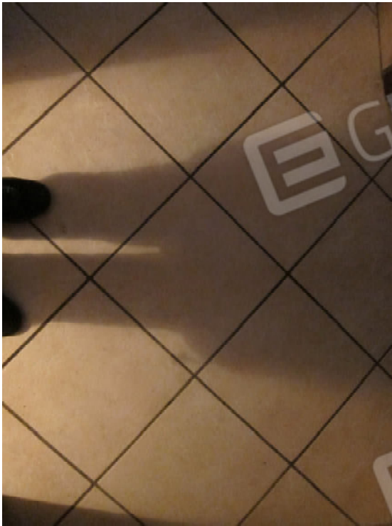
27. Pavimento piastrelle ceramica