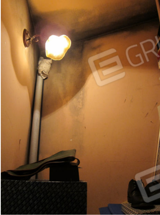
15. Ripostiglio annesso al vano 2