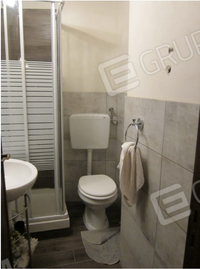
33. Bagno 2