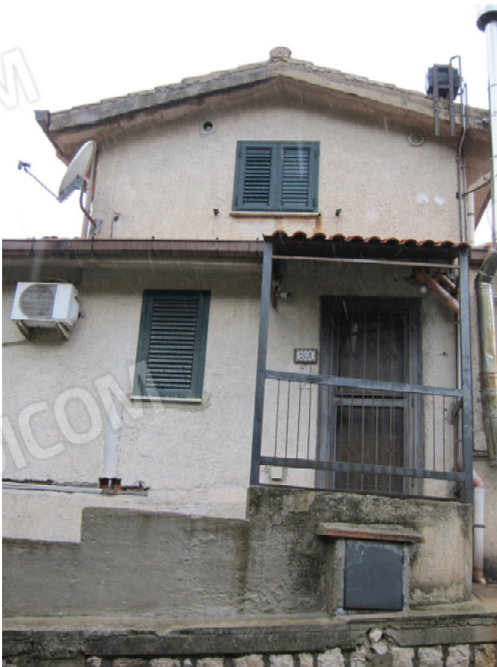
4. Corso Piano Renda 96A Ingresso al primo piano