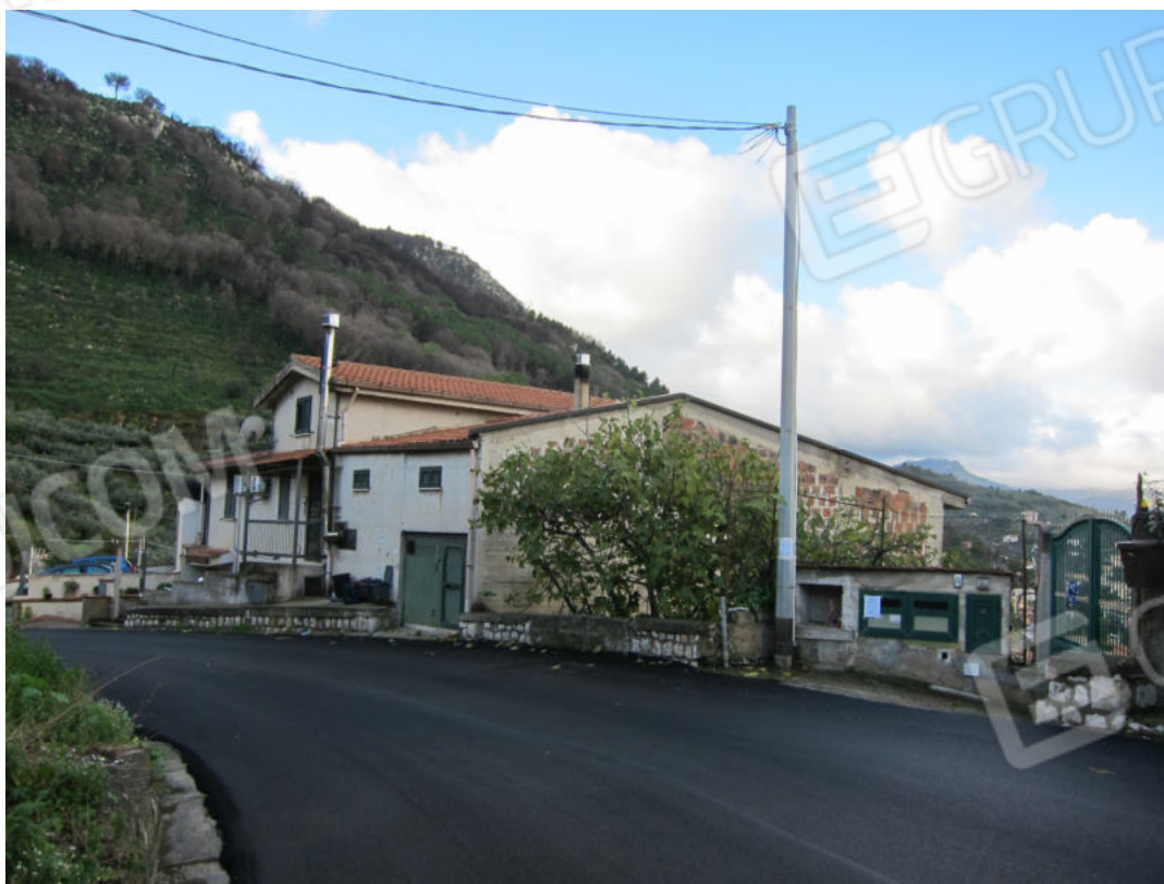
2. Prospetto su strada