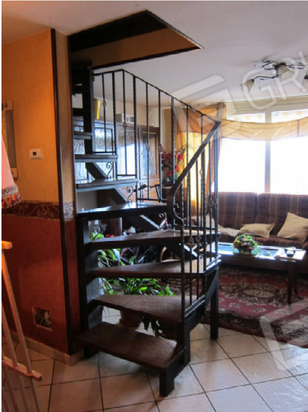
9. Scaletta di accesso alla mansarda