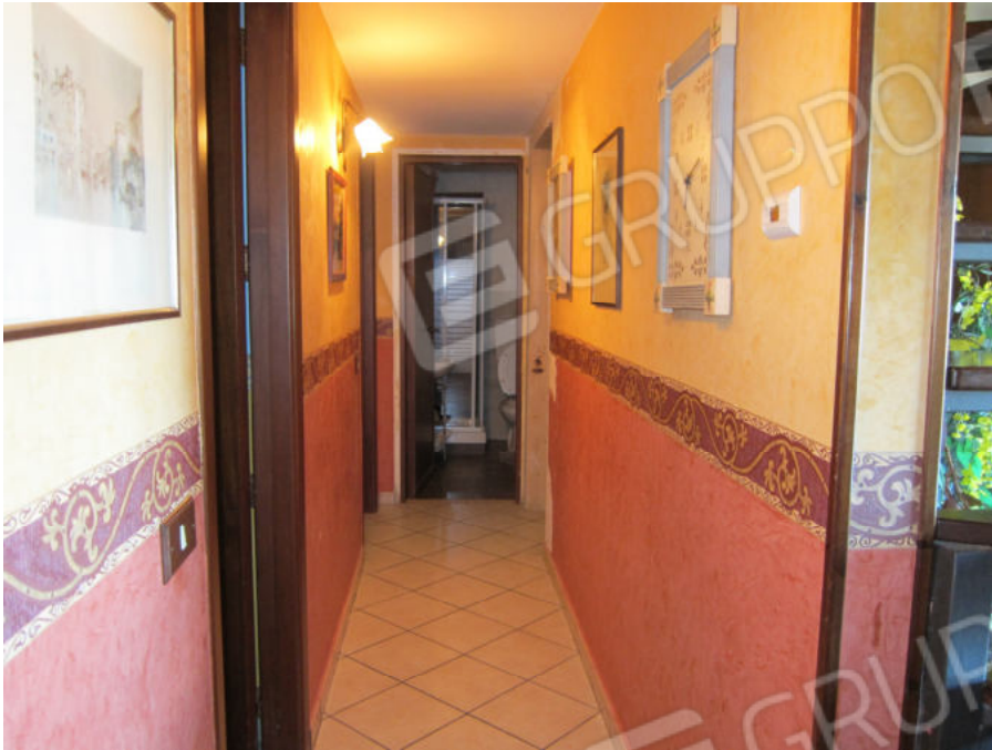
11. Disimpegno zona notte