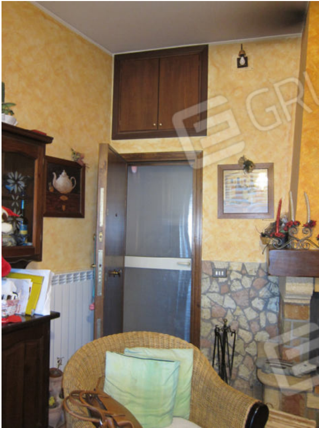
23. Porta di accesso alla scala di collegamento col locale di piano terra