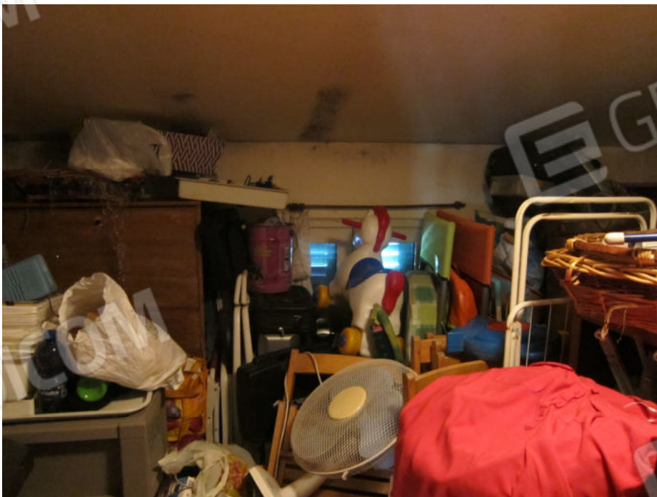
18. Locale sottotetto dx