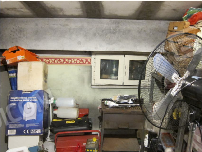
20. Locale sottotetto sx