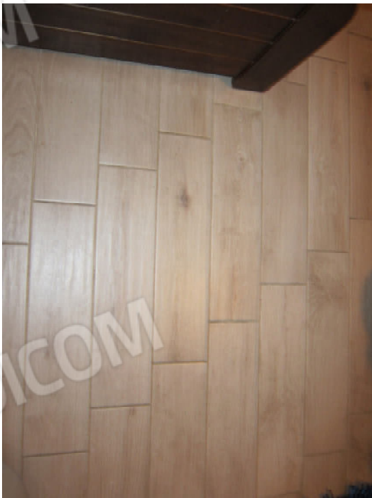
28. Pavimento vano 3