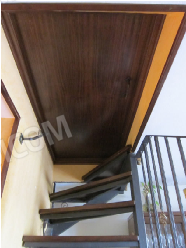
10. Botola di accesso alla mansarda