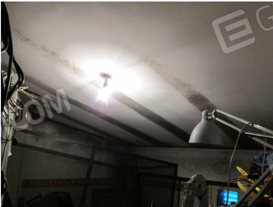
40. Locale sottotetto