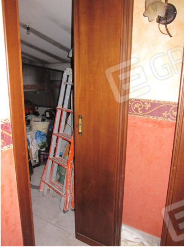
19. Locale sottotetto sx