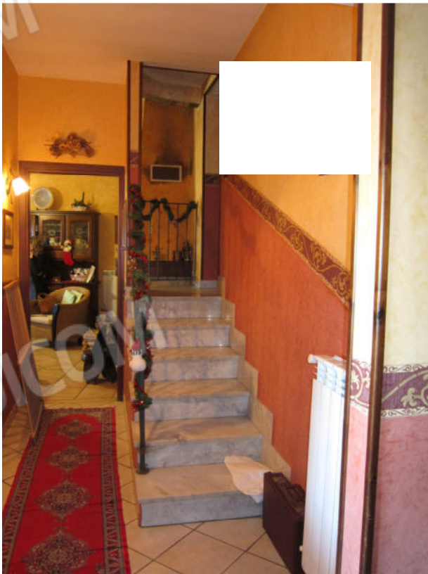
16. Scaletta di collegamento con i locali sottot