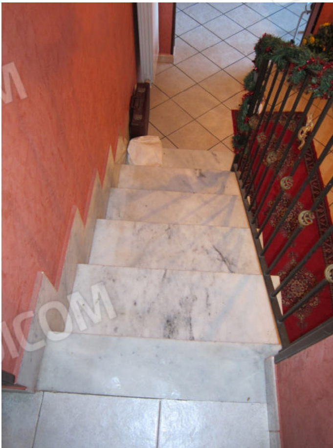
30. Scaletta di accesso al sottotetto