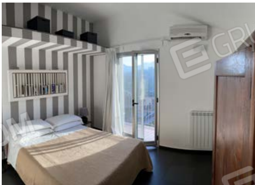
Foto n. 14-Interno- Vano letto 4