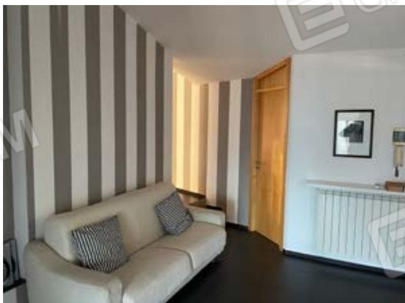
Foto n. 8- Interno- Vano ingresso