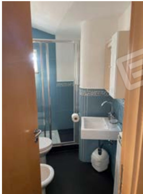
Foto n. 16-Interno- wc a