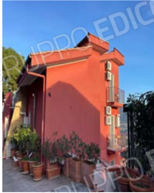
FOTO N.ri.4/5- Corpo di fabbrica afferente l'unità immobiliare