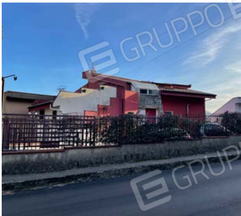
FOTO N. 1 -Vista del fabbricato dalla via P. Novelli