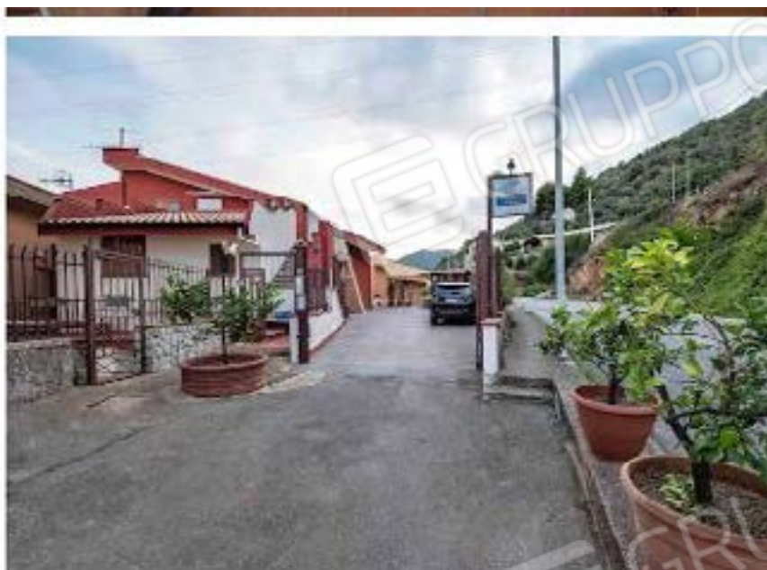
FOTO N. 3- Ingresso al lotto di terreno dalla via Pietro Novelli civ 297