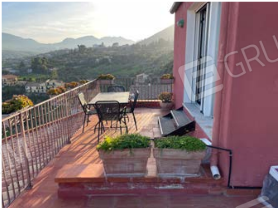
Foto n. 12-Esterno- Terrazza annessa al vano cucina