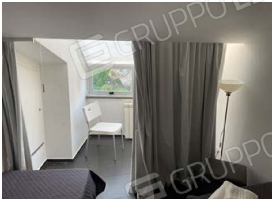
Foto n. 13 Interno- Vano letto 4