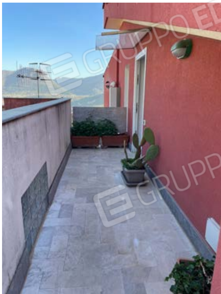
Foto n. 7- Ingresso all'appartamento