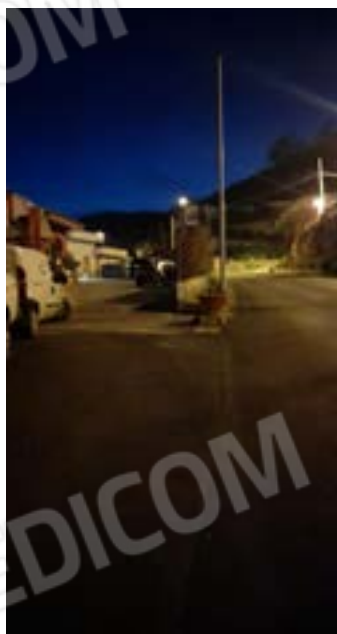
FOTO N.2-Ingresso al lotto di terreno dalla via Pietro Novelli