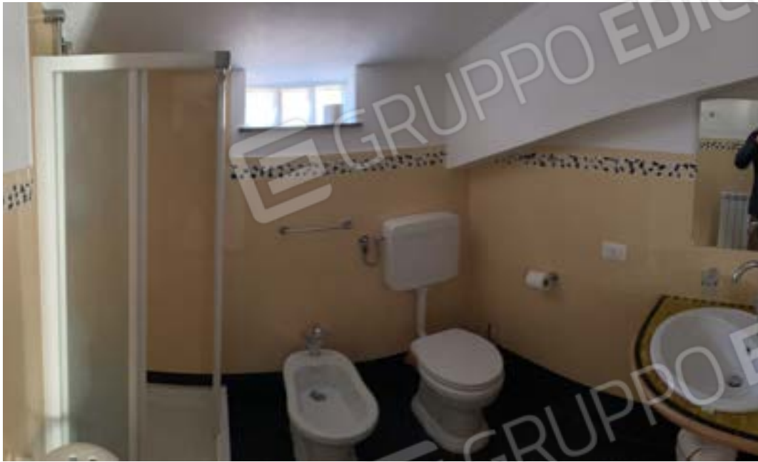
Foto n. 15-Interno- wc b