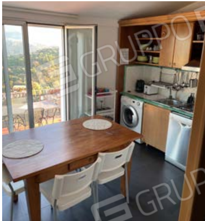
Foto n. 11 Interno- Vano cucina