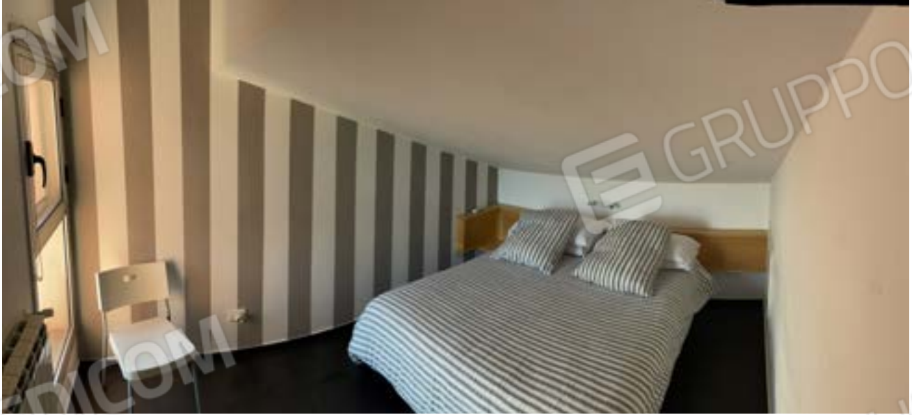
Foto n. 10 -Interno- Vano 2