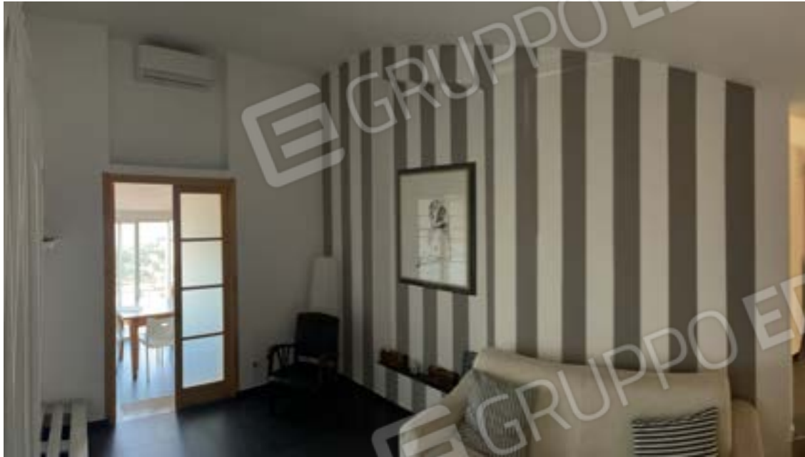
Foto n. 9 Interno- Vano ingresso