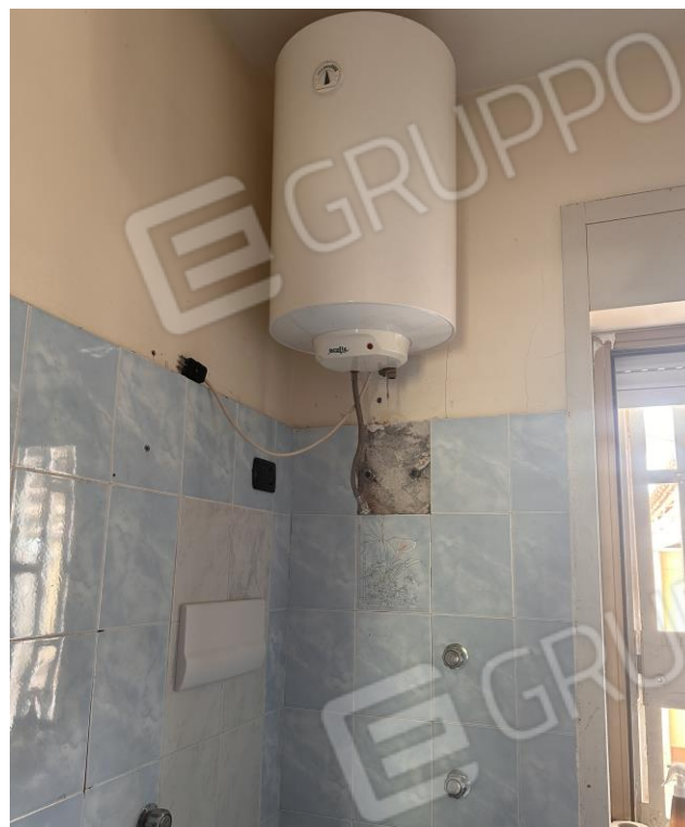
Foto n. 9 - Servizio igienico di piano terra, boiler elettrico per la produzione dell'ACS in pessime condizioni di manutenzione.

Comune di Carini (PA) Via Pianta del Principe n. 59