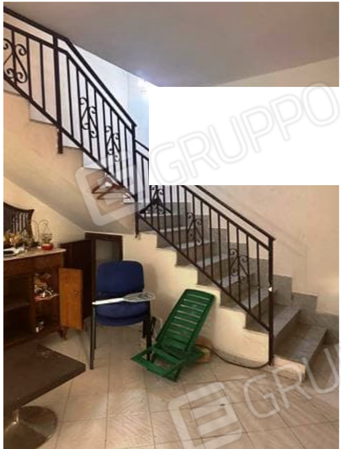
Foto n. 7 - Zona living che disimpegna il piano terra e primo, a quest'ultimo si accede dalla scala interna rifinita in marmo.

Comune di Carini (PA) Via Piante del Principe n. 59