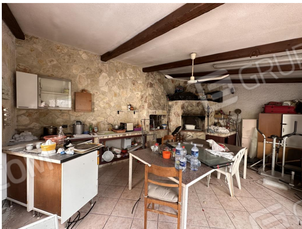
Foto n. 13 - Cucina esterna.

Comune di Carini (PA) Via Piante del Principe n. 59