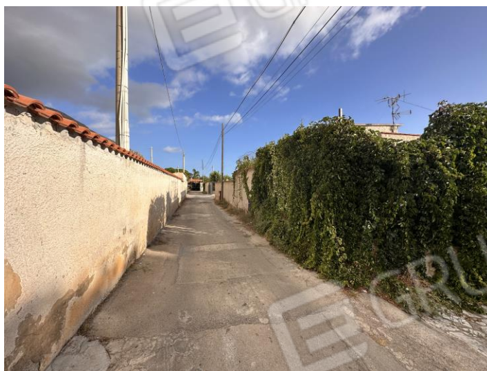
Foto n. 1 Via Piante del Principe n. 59 Carini (PA) - 38°09'44.7"N 13°09'18.0"E – Coordinate Google maps.

Comune di Carini (PA) Via Piante del Principe n. 59