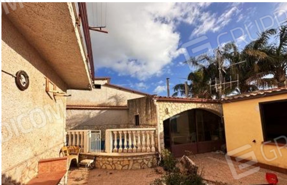
Foto n. 4 - Retrospetto e secondo corpo accessorio.

Comune di Carini (PA) Via Piante del Principe n. 59