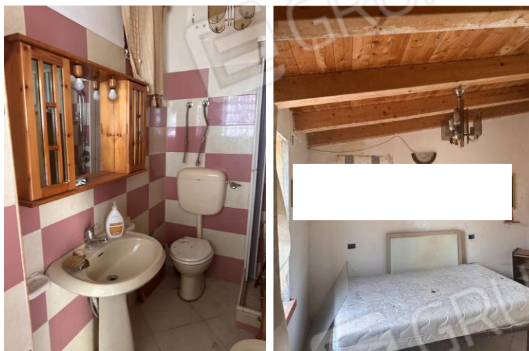
Foto n. 12 - Interno dei vani oggetto di messa in pristino.

Comune di Carini (PA) Via Pianta del Principe n. 59