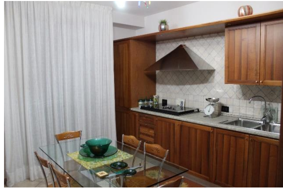
Vista della cucina