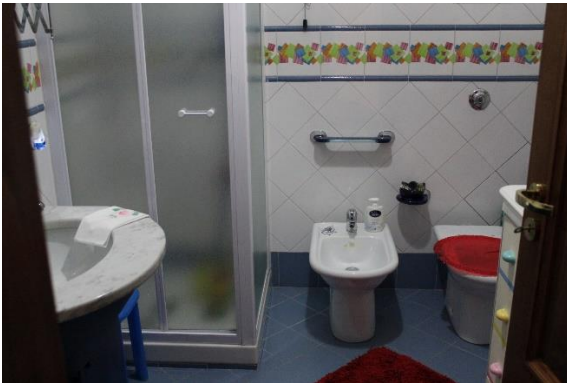
Vista del wc-doccia