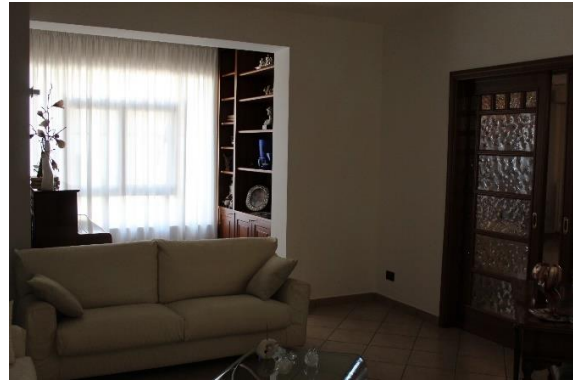
Vista della zona giorno