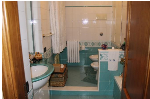
Vista del wc-bagno