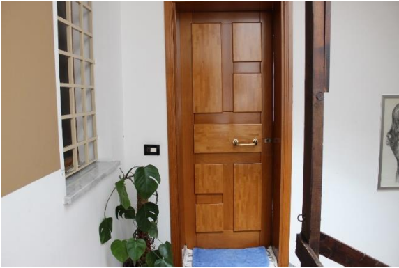
Vista della porta di ingresso all'appartamento a dx salendo la scala