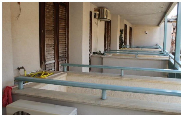
Vista dei balconi