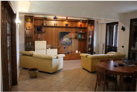
Vista del salone pari a due vani