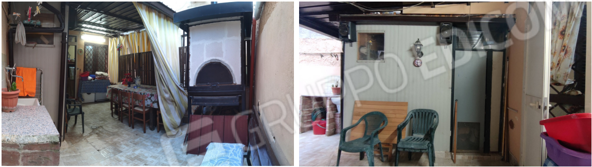
Fig. 12 area esterna recintata e coperta- su questa insiste anche un ripostiglio realizzato con una struttura tipo pannello coibentato