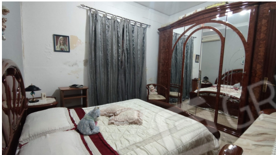
Fig. 8 camera 1