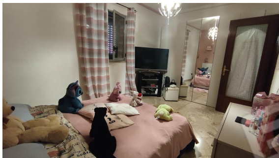
Fig. 9 camera 2