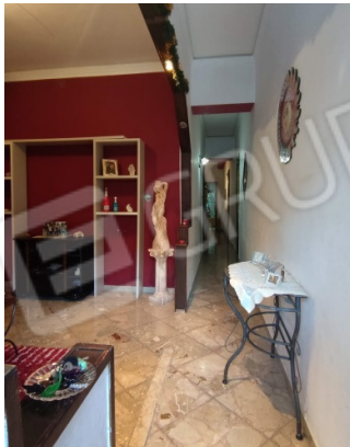
Fig. 3 corridoio