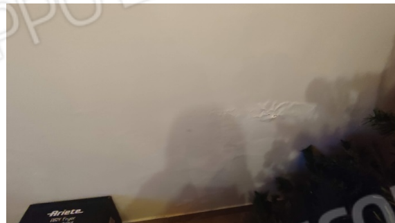
Fig. 4 presenza di umidità da risalita soprattutto nella parete a sud poiché prossima e prospiciente ad altro edificio