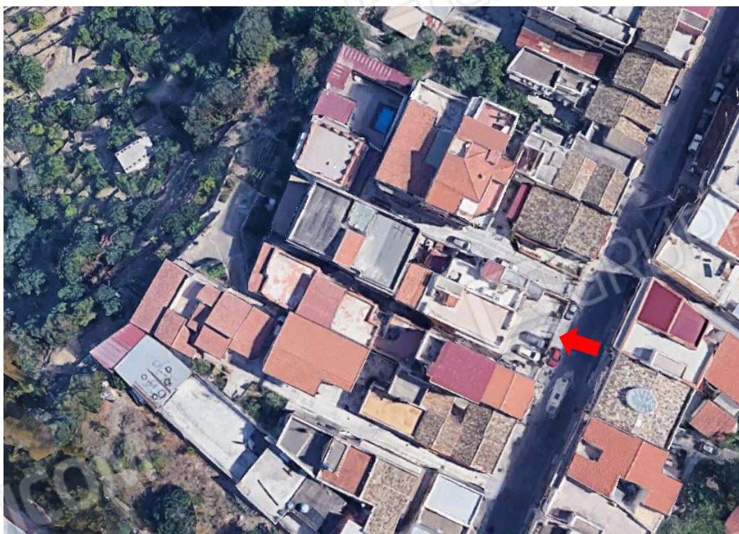
Fig. 1. Ubicazione dell'immobile da Google Earth

Immobile per civile abitazione sito in Palermo, Via Villagrazia n. 341 individuato al NCEU di Palermo al fgl. 69 part. 1665 sub 4