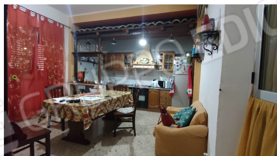
fig. 10 cucina/soggiorno