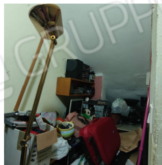
Fig. 6 vano ripostiglio