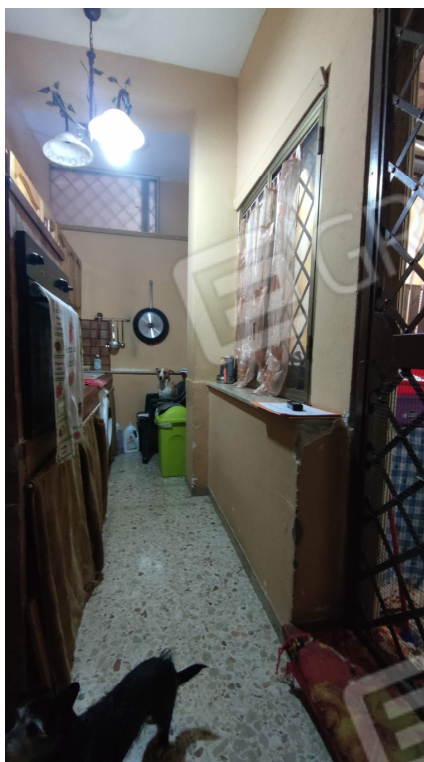
Fig. 11 la veranda è attualmente uno spazio totalmente chiuso con muratura