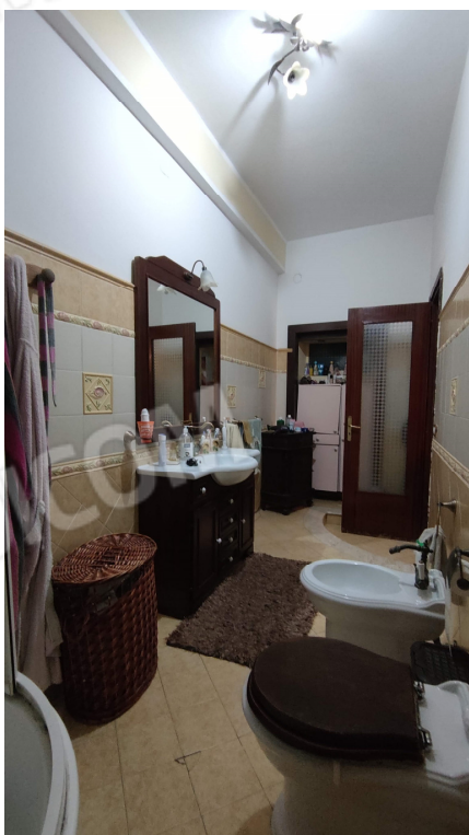
Fig. 7 w.c. con doccia