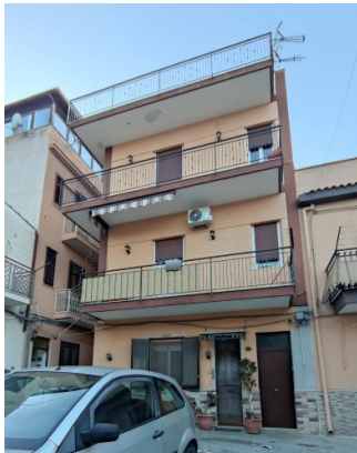
Fig. 2 accesso all'immobile