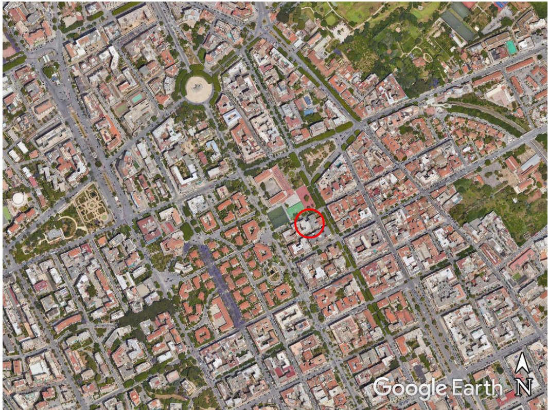
Fotogramma "Google Earth" con ubicazione dell'edificio condominiale in cui si trova l'unità immobiliare 1