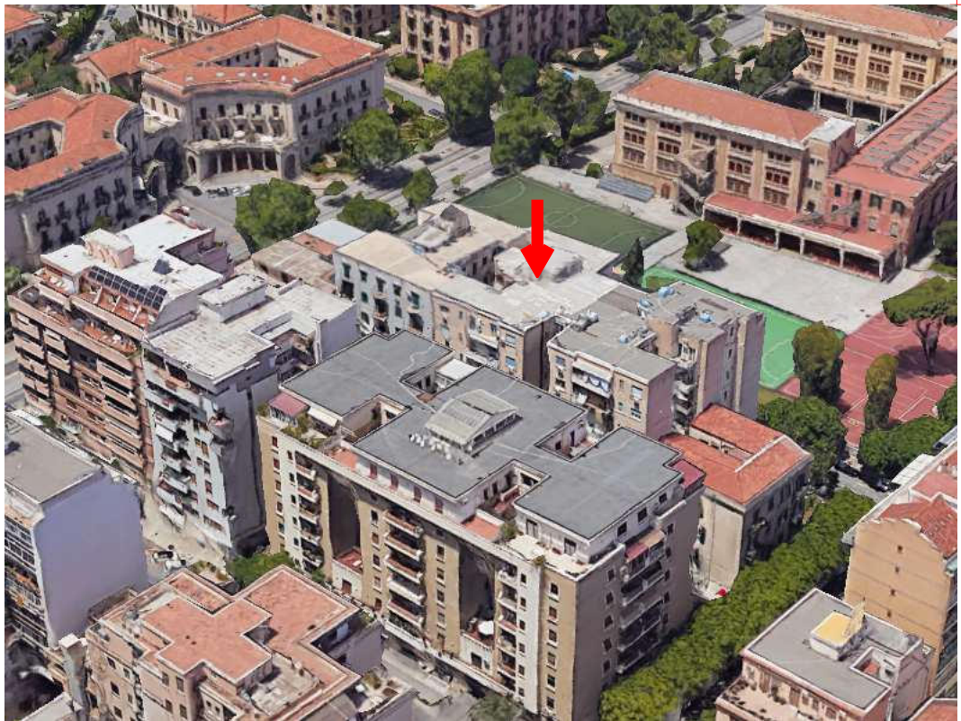
Fotogramma "Google Earth" con ubicazione dell'edificio condominiale in cui si trova l'unità immobiliare 4