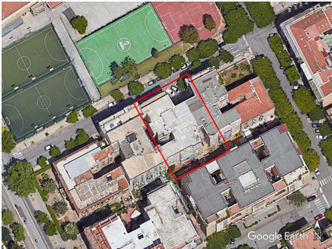
Fotogramma "Google Earth" con ubicazione dell'edificio condominiale in cui si trova l'unità immobiliare 2