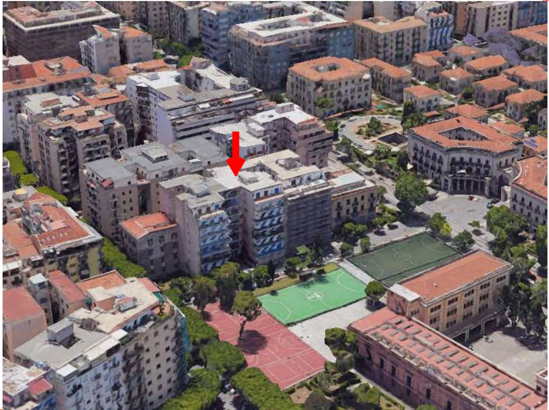
Fotogramma "Google Earth" con ubicazione dell'edificio condominiale in cui si trova l'unità immobiliare 3