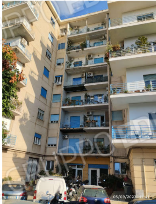
2 Vista dell'edificio condominiale da via Saverio Scrofani