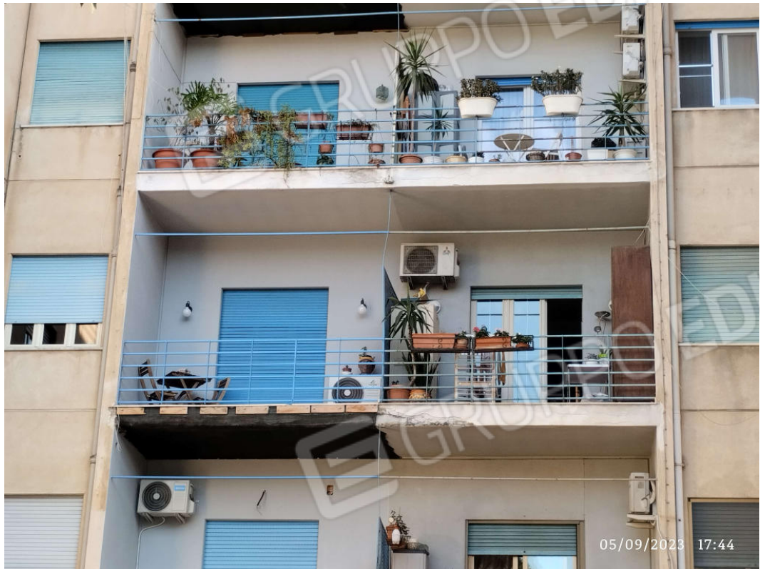
5 Vista del balcone dell'u.i. verso la via Saverio Scrofani