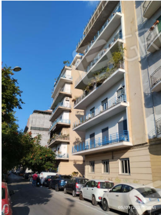
1 Vista dell'edificio condominiale da via Saverio Scrofani