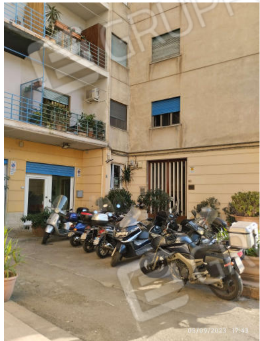
4 Ingresso dell'edificio condominiale in cui si trova l'unità immobiliare