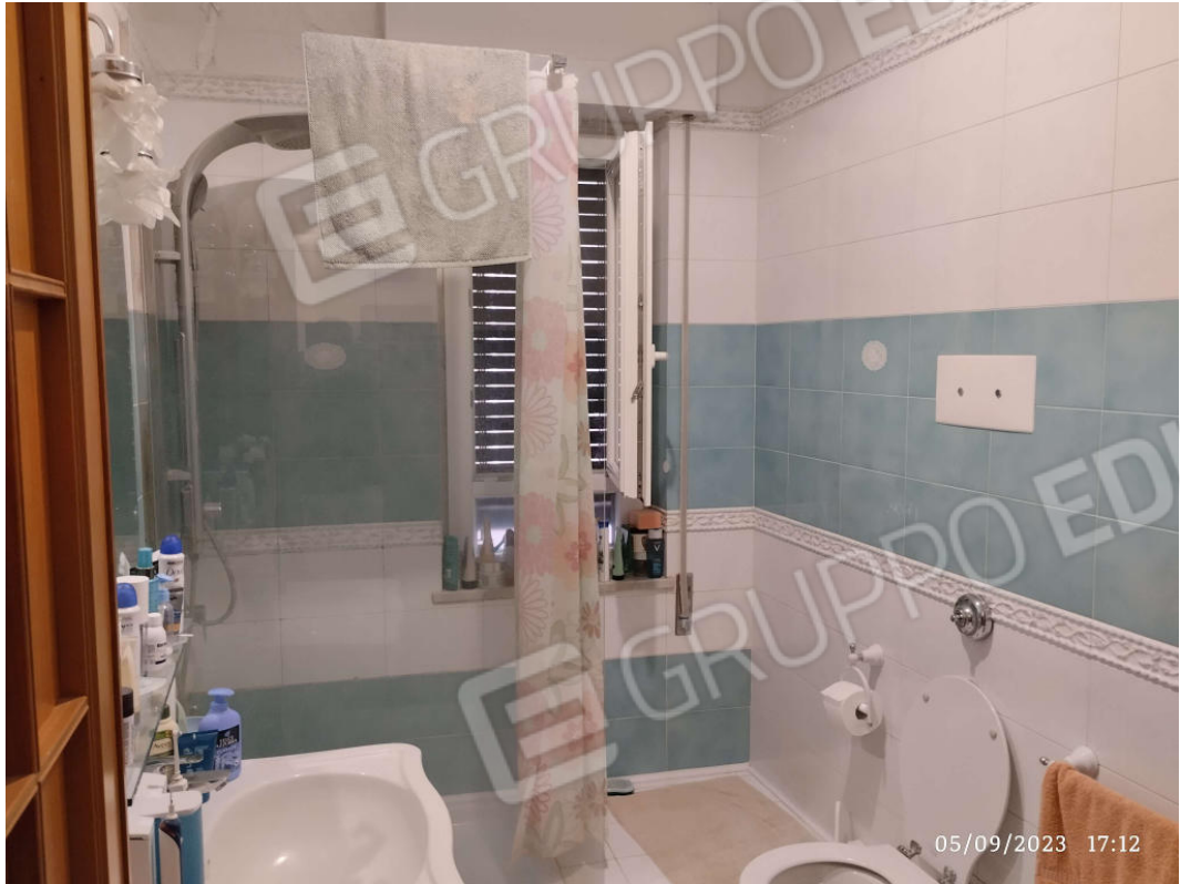
13 Servizio igienico