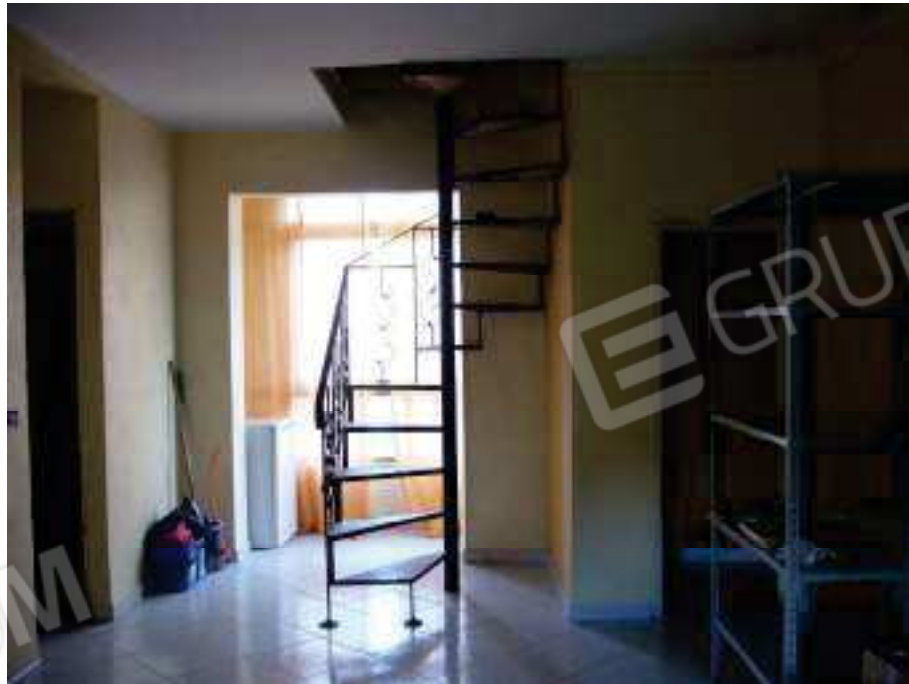
Figg. 11, 12 Soggiorno.