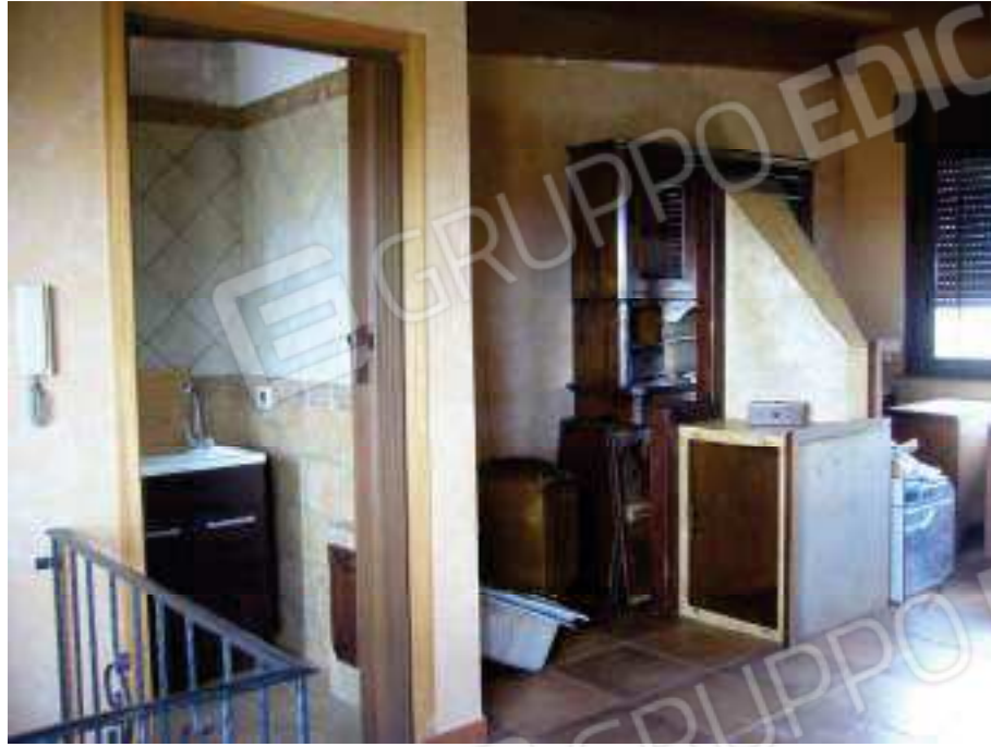
Fig. 31 Zona pranzo e w.c.