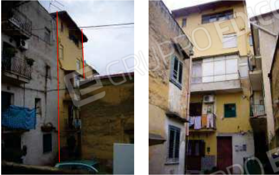
Figg. 1, 2 Prospetto principale su Baglio Lucchicelli direzione nord-est.