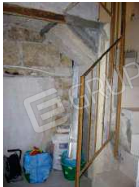
Fig. 6 Vano scala.