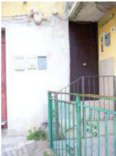
Fig. 5 Portone d'ingresso civ. n. 14