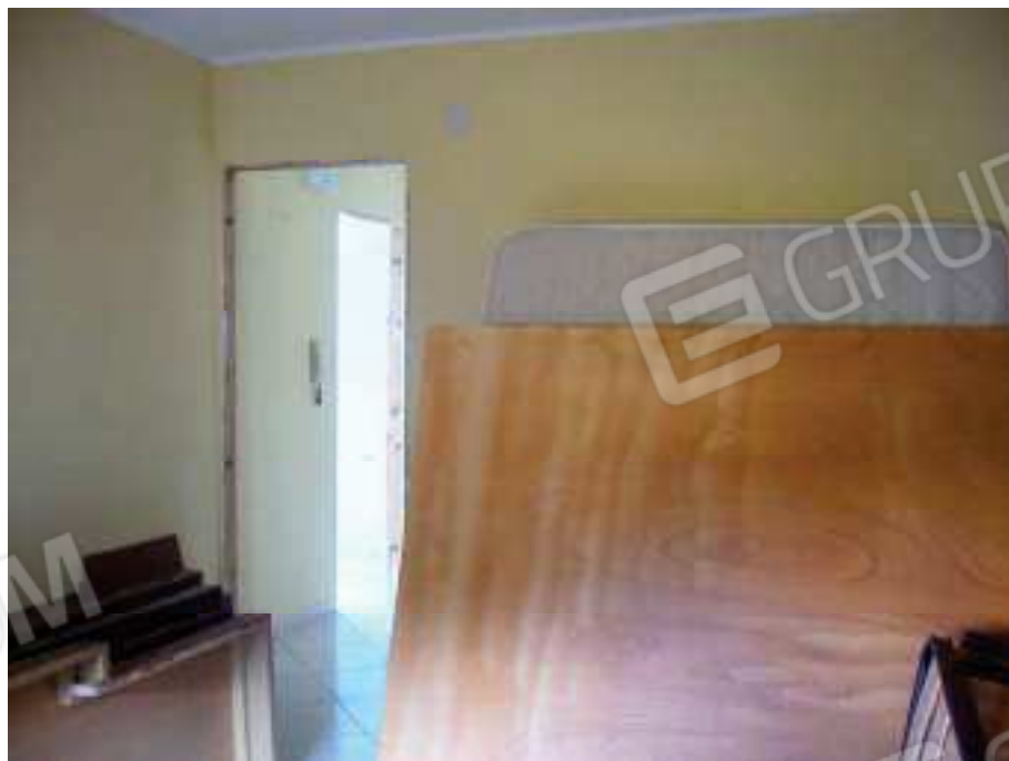
Figg. 20, 21 Camera 1.