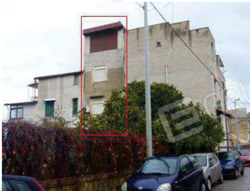
Fig. 3 Prospetto secondario in direzione sud-ovest.