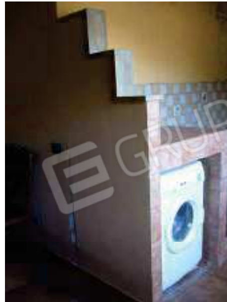
Figg. 32, 33 Cucina.