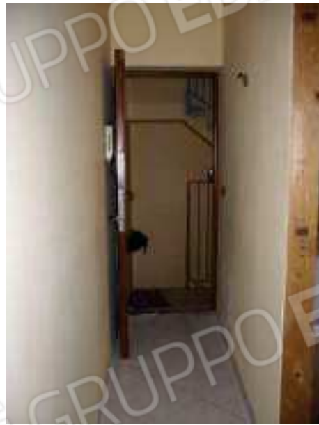
Figg. 7, 8 Ingresso all'unità immobiliare.