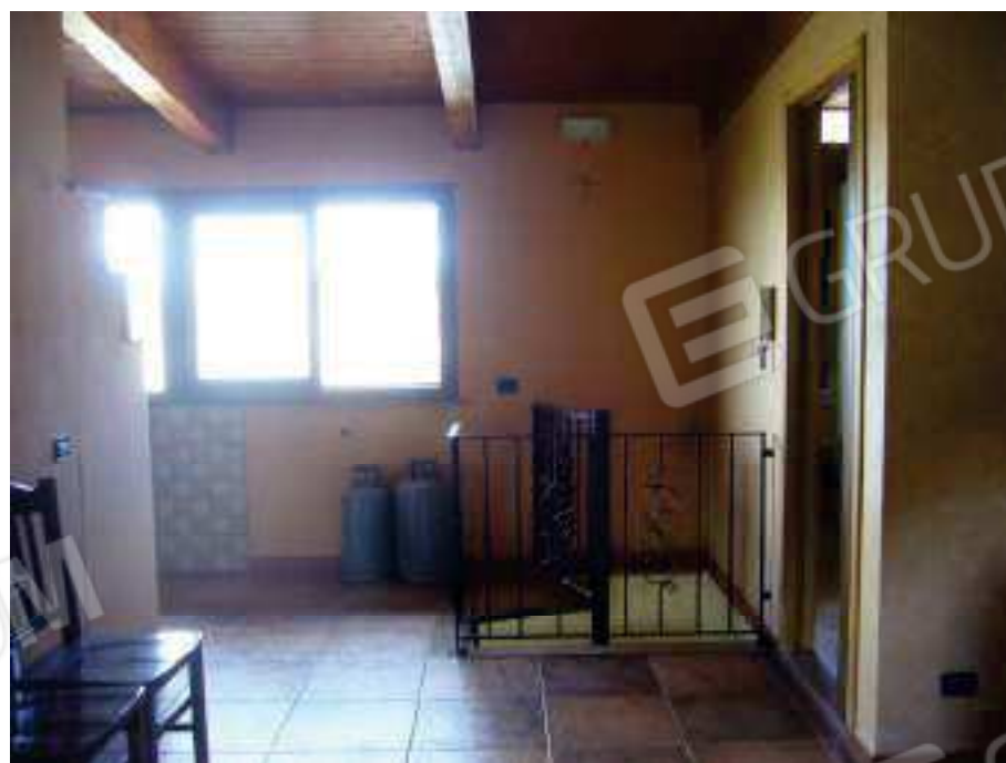
Figg. 29, 30 Zona pranzo.