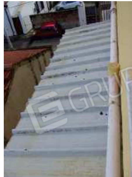
Figg. 15, 16 Particolari veranda: infissi e copertura.