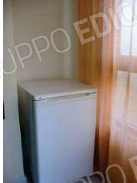
Figg. 13, 14 Veranda balcone.