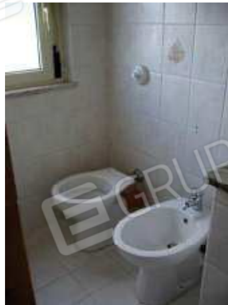
Figg. 27, 28 W.c. 2.