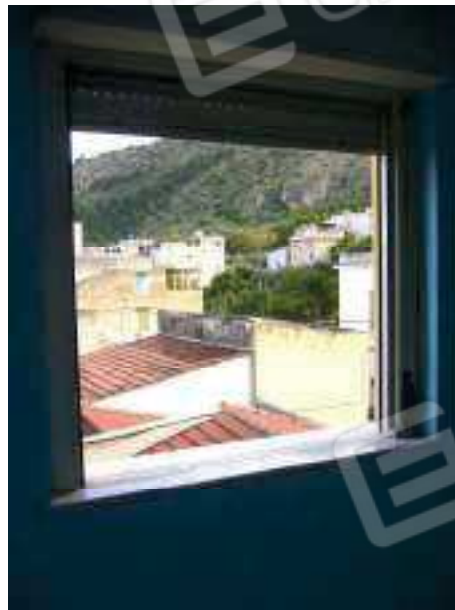
Figg. 22, 23, 24 Camera 2.