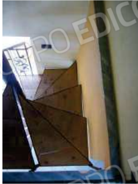
Figg. 25, 26 Scala a chiocciola.