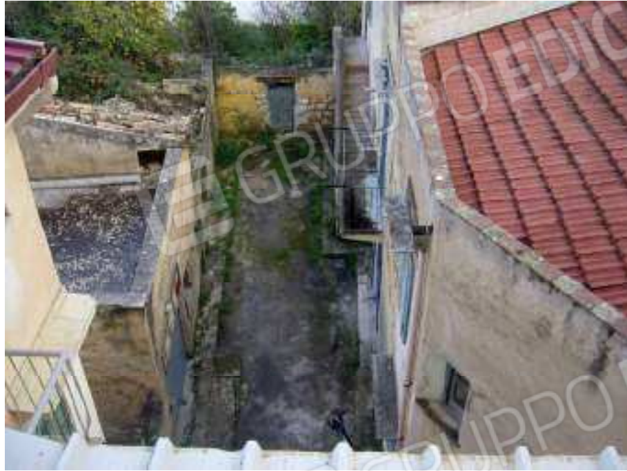
Fig. 4 Vista dall'alto Baglio Lucchicelli.