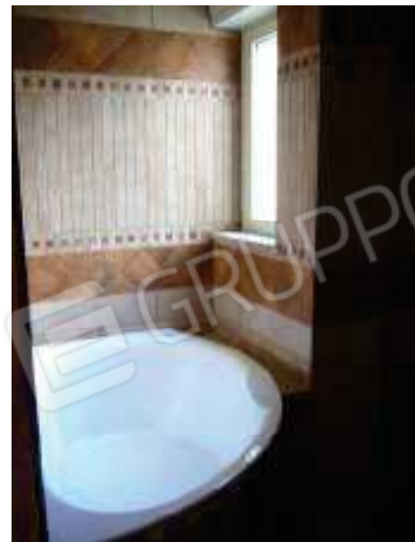
Figg. 17, 18, 19 W.c. 1.