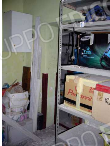
Figg. 7, 8 Vano 1.