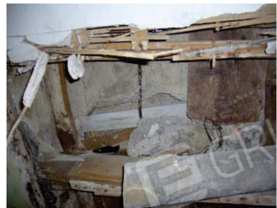
Figg. 13, 14, 15, 16 Particolari soffitto vano 1.