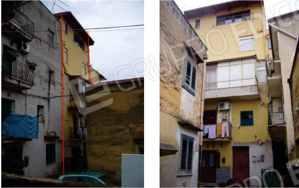
Figg. 1, 2 Prospetto principale su Baglio Lucchicelli direzione nord-est.