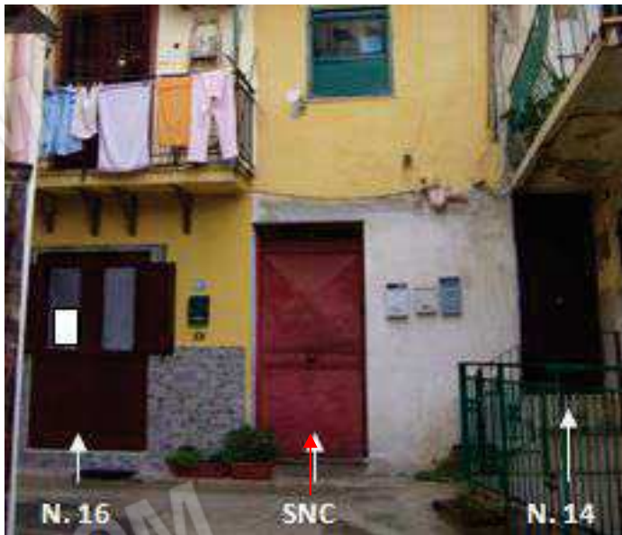
Fig. 5 Portoncino d'ingresso.