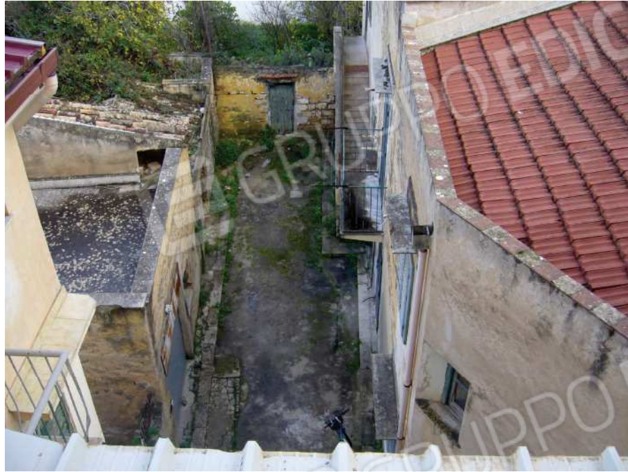
Fig. 4 Vista dall'alto Baglio Lucchicelli.