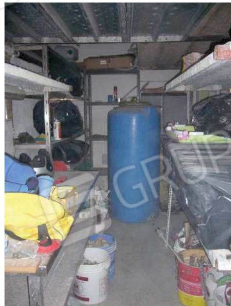
Figg. 9, 10 Vano 2.