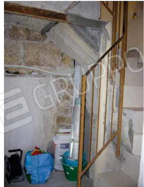
Fig. 6 Vano scala condominiale.