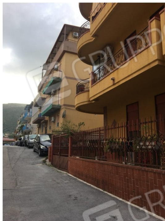
Foto 1/4: esterni – accesso al locale posto al piano cantinato dalla Via Scherma; veduta dell'intera palazzina; accesso agli altri immobili dello stabile dal civ.n. 8; veduta contesto Via Scherma;