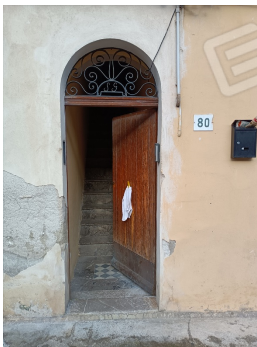
Foto n. 2 – Vista del portoncino di ingresso e del relativo numero civico