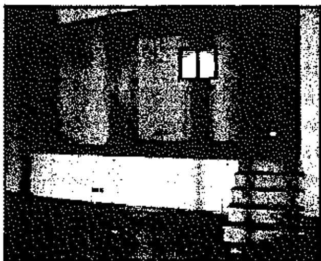
Porzione locale con altezza ridotta (sub. 6)