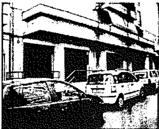
Locale commerciale in via Zancla civv. 4, 4a, 4b e 4c (sub. 5 e 6)