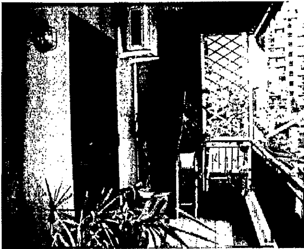
Balcone su via Zancla