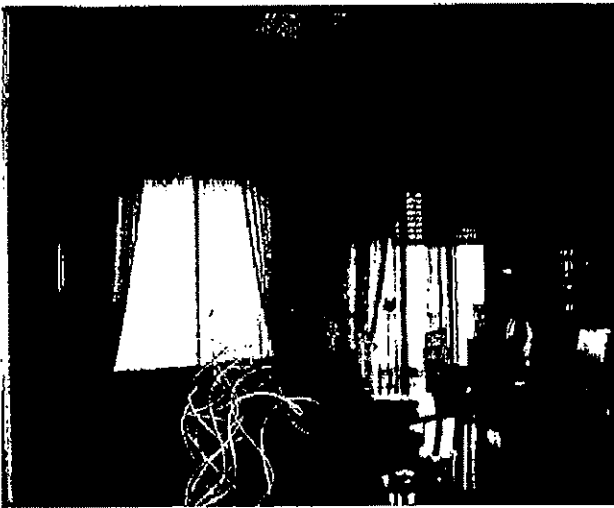
Appartamento in via Tricomi civ. 2i, scala B, piano 2° - Salone