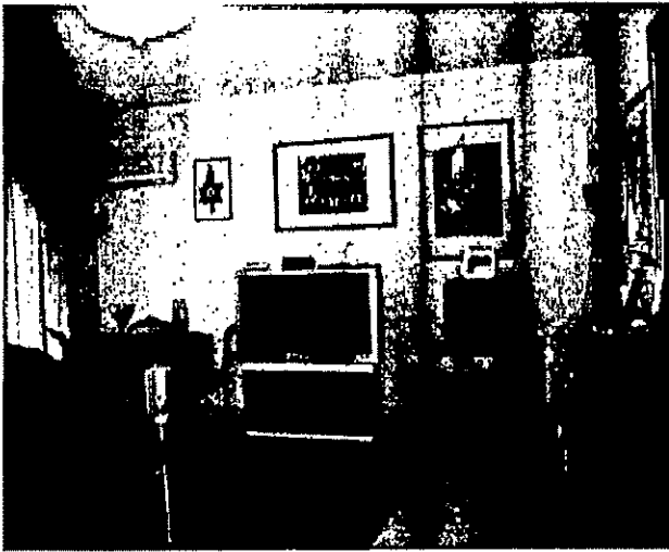
Appartamento in via Tricomi civ. 21, scala B, piano 6^ - Salone