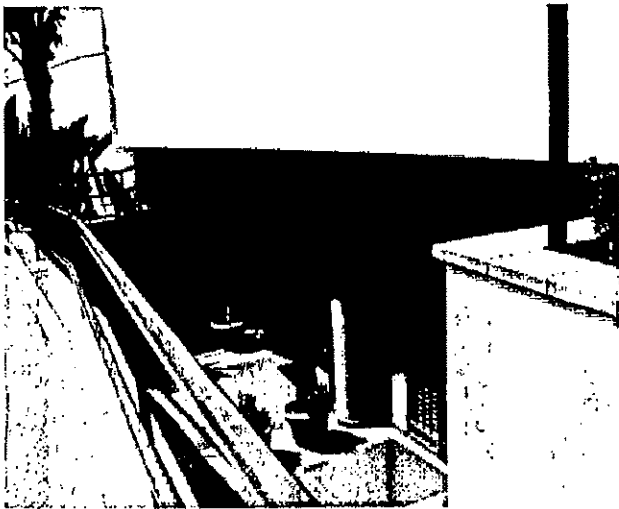
Ufficio in via Tricomi civ. 2i, scala B, piano S1 - Vista ingresso