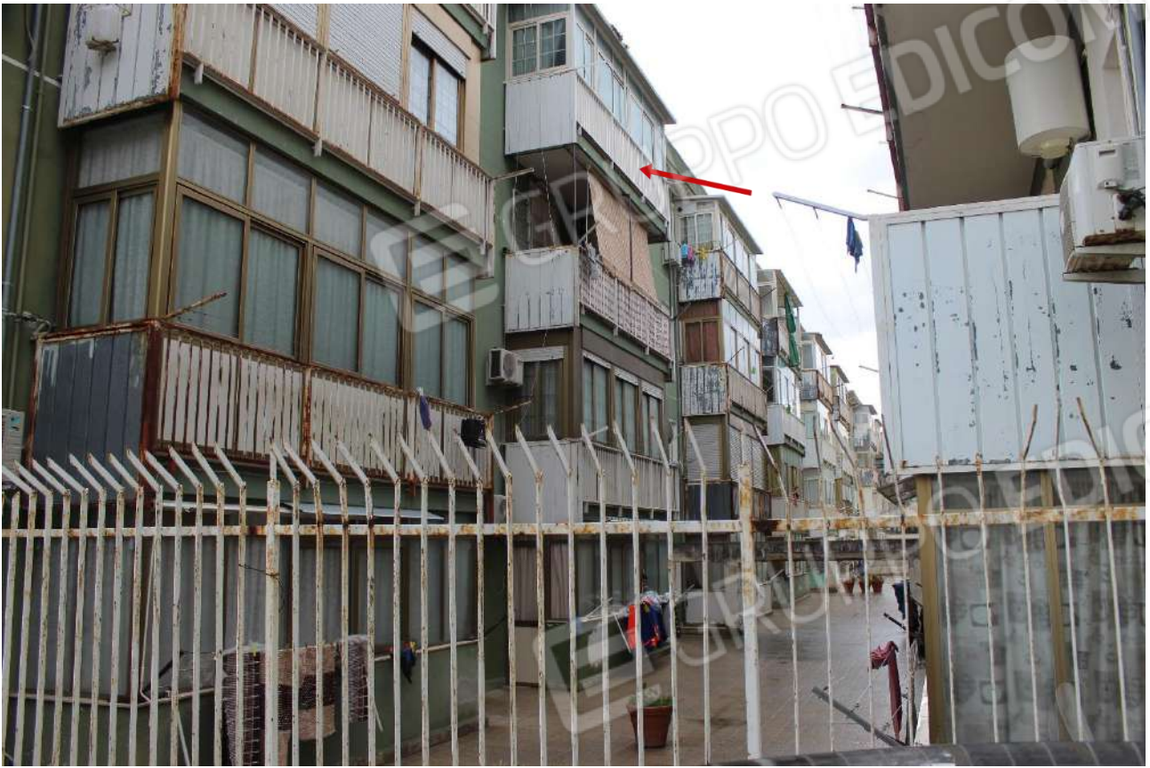
Retroprospetto dell'edificio scala A, a confine con spazi condominiali