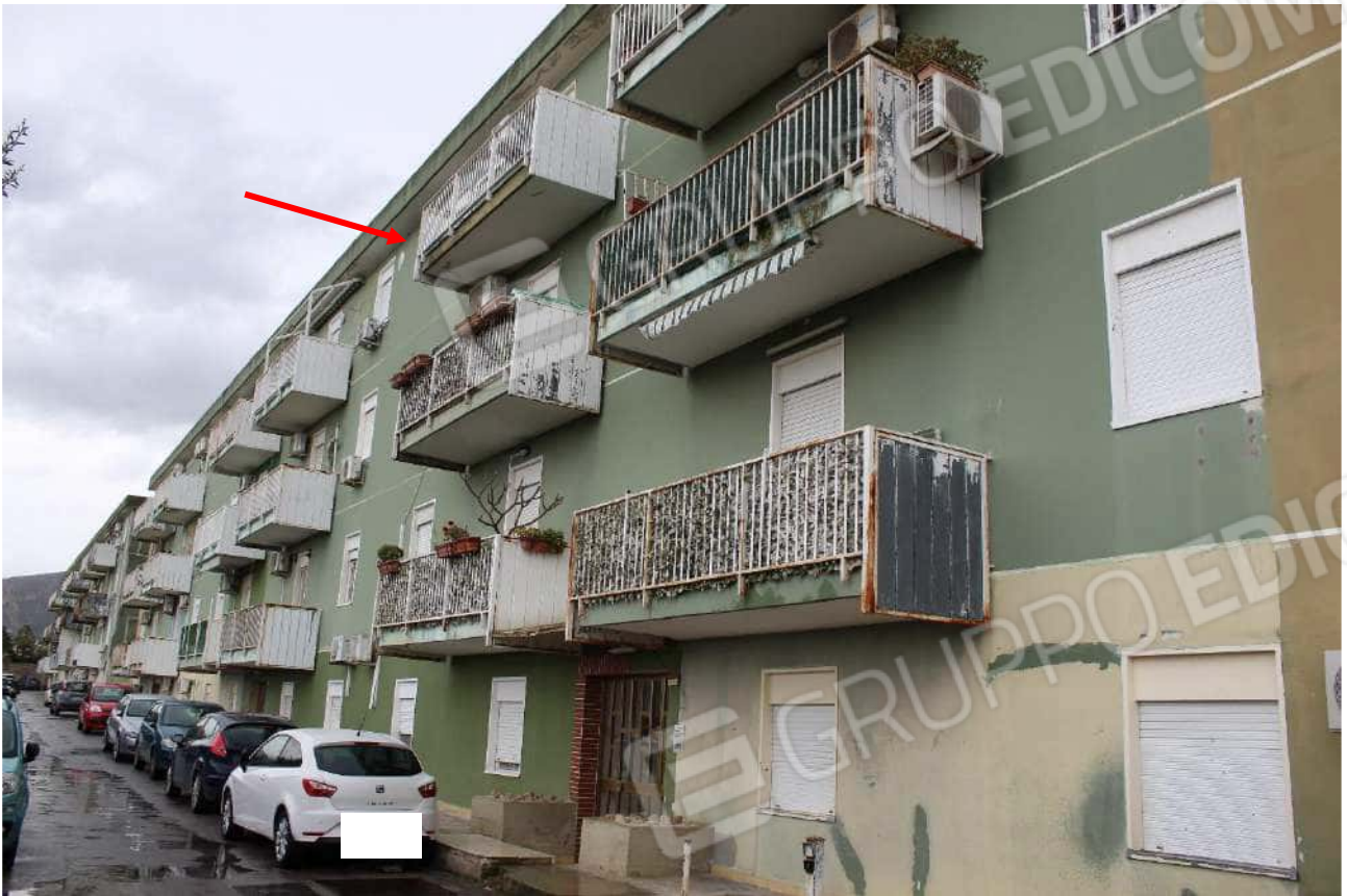
Fronte principale della scala A, lato zona parcheggio condominiale