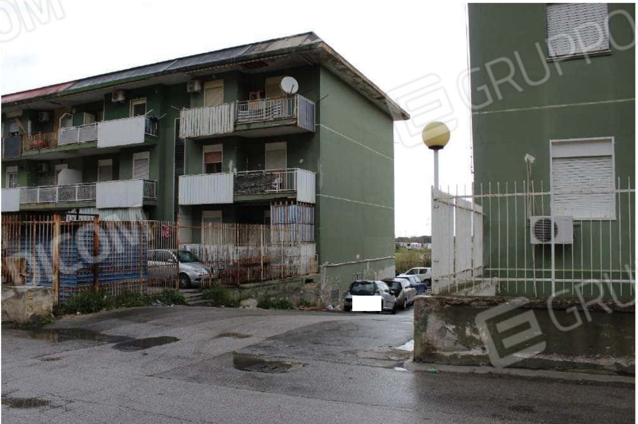
Strada di accesso dalla via Ciaculli