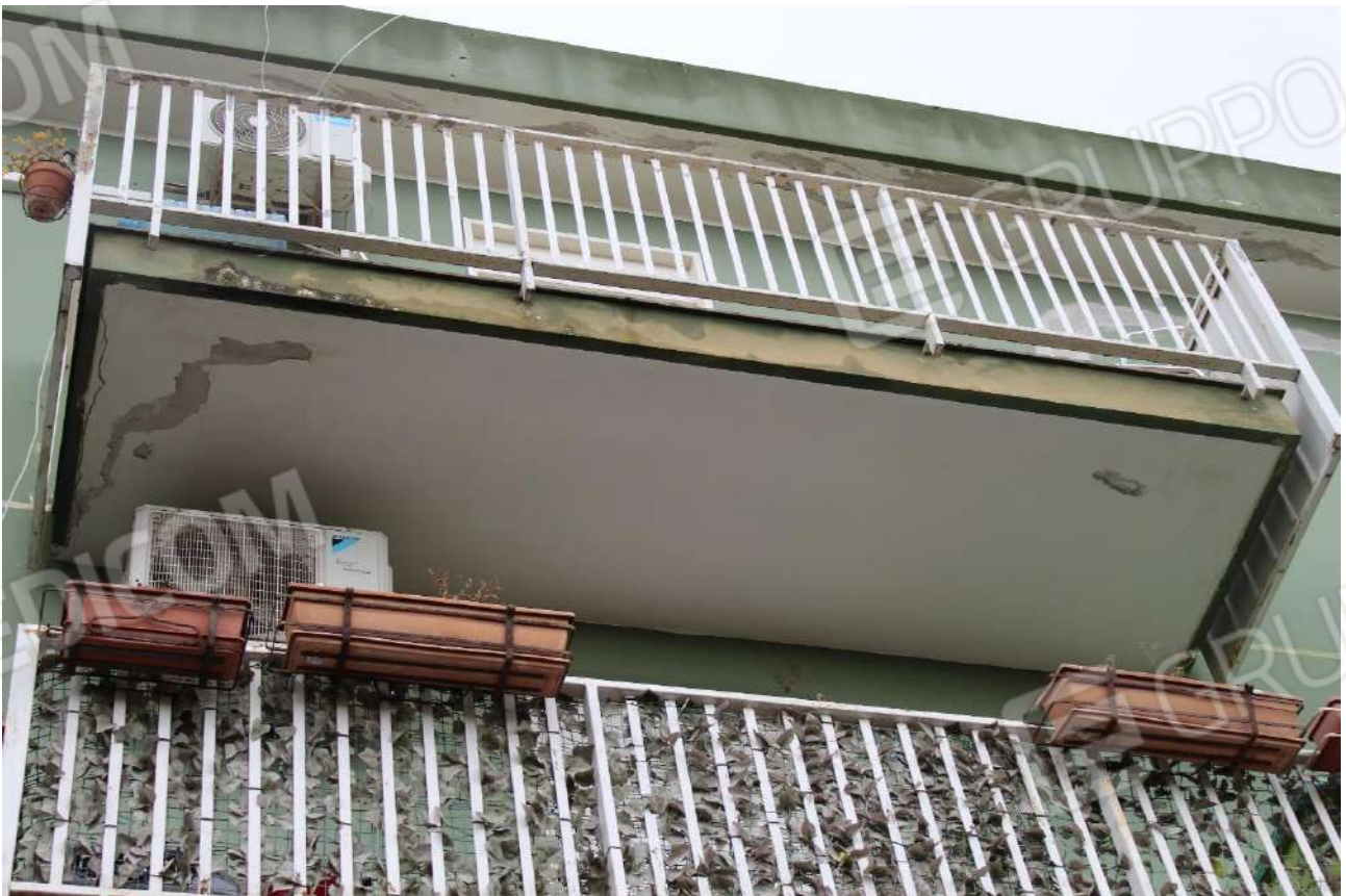
Balcone su prospetto principale con frontalino e intradosso danneggiati