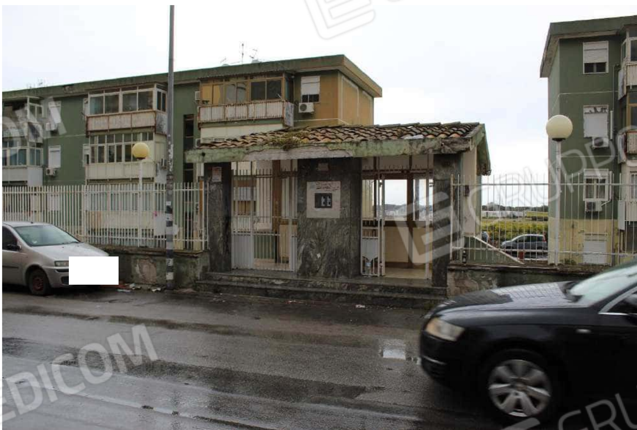
Ingresso al complesso condominiale dal civ. 30 della via Ciaculli