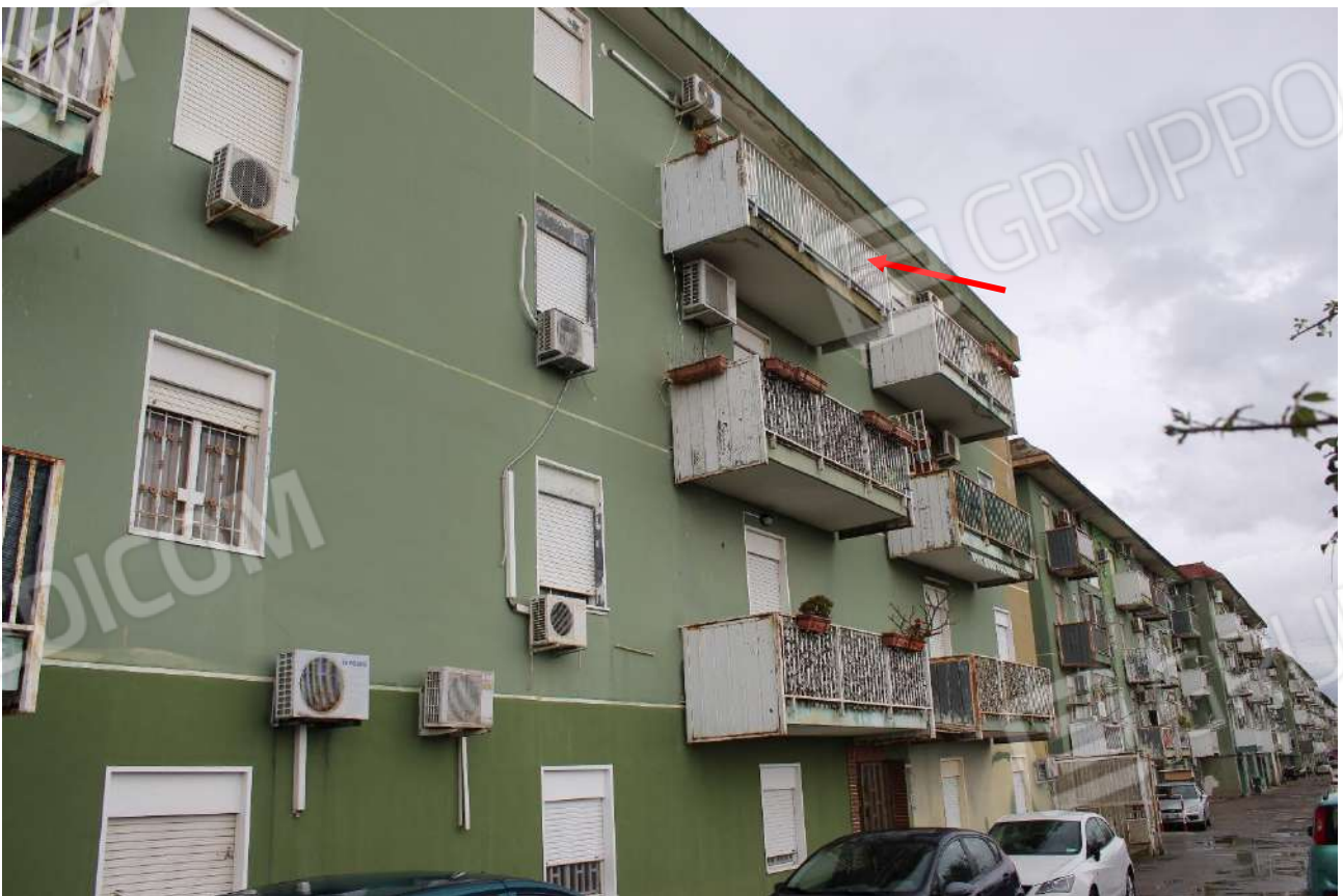
Fronte principale della scala A, a confine con area a parcheggio condominiale – Vista verso il cancello scorrevole di accesso