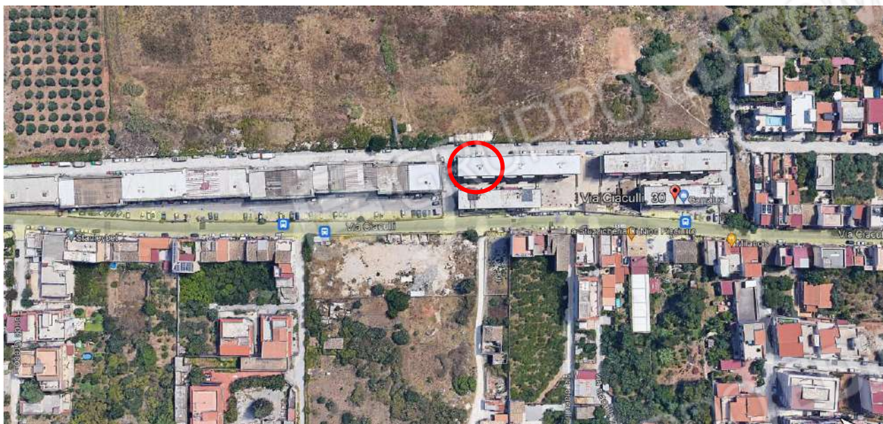
Fotografia aerea