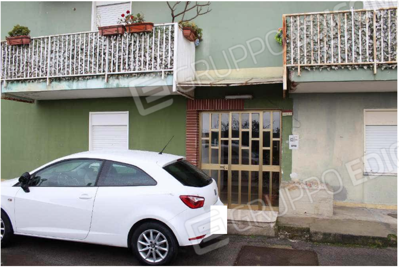
Ingresso scala A