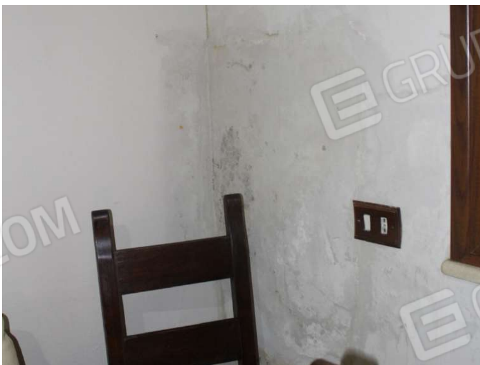
FOTO 50: UNITA' "B": Muratura perimetrale esposta su Ingresso cucina