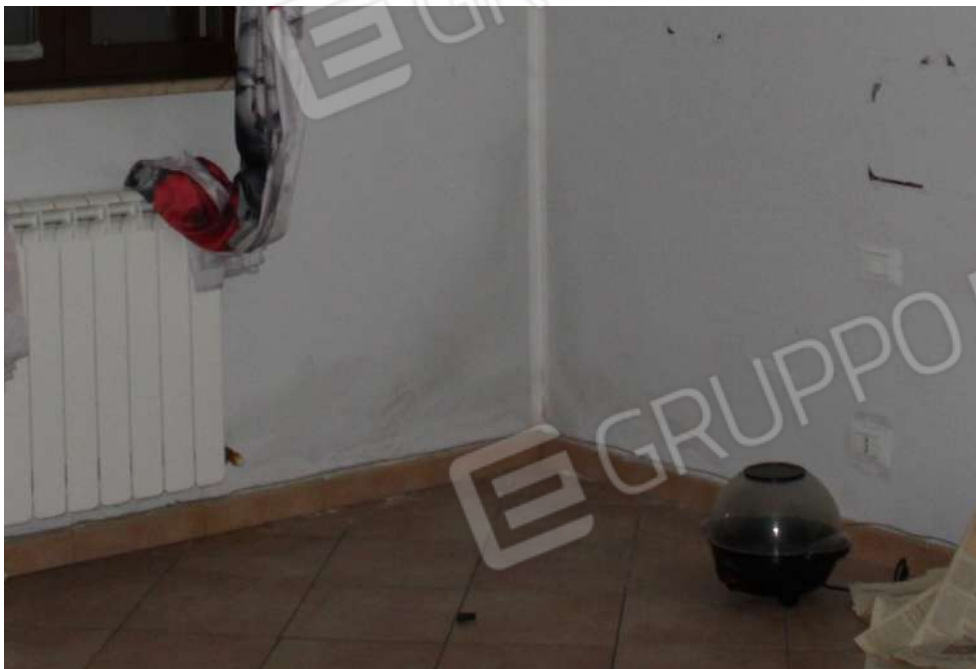
FOTO 43: UNITA' "A": Muratura che separa vano 6 dallo spazio esterno di pertinenza