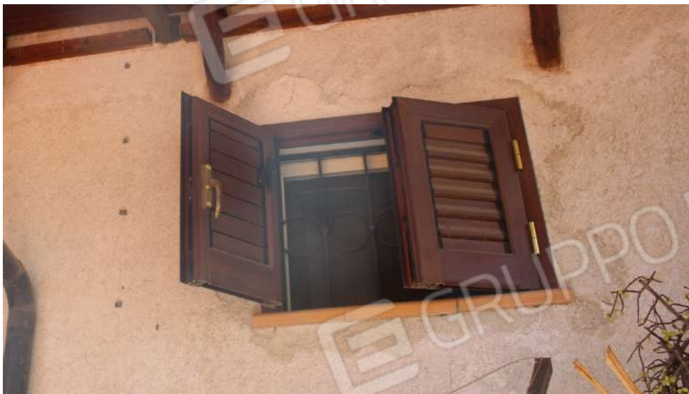
FOTO 47: UNITA' "B": Muratura perimetrale esposta su terrazzo di pertinenza dell'Unità "A"