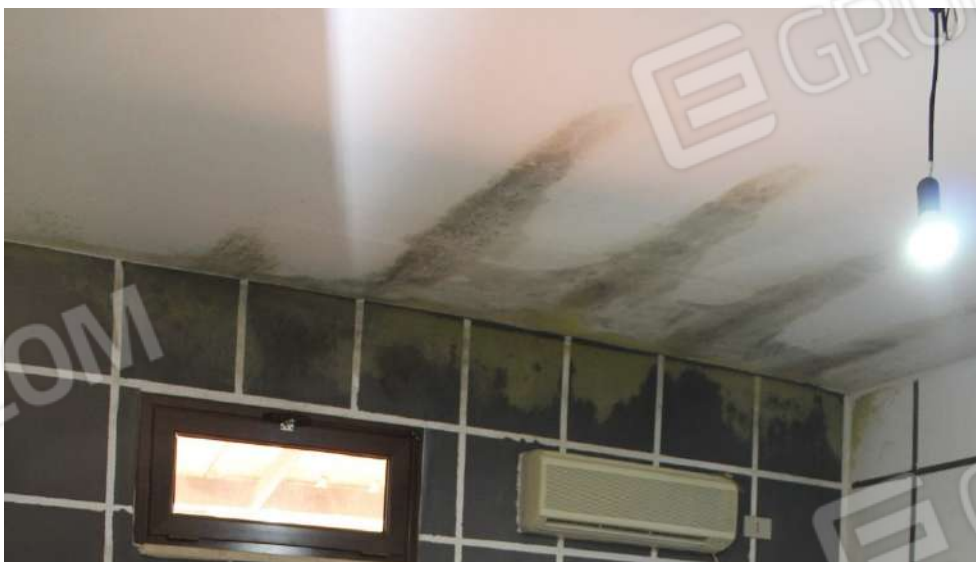
FOTO 48: UNITA' "B": Muratura perimetrale esposta su terrazzo di pertinenza dell'Unità "A"