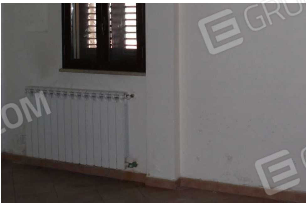
FOTO 44: UNITA' "A": Muratura che separa vano 7 dal terrazzo di pertinenza