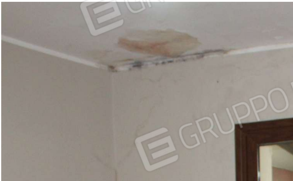
FOTO 49: UNITA' "B": Muratura perimetrale esposta su Ingresso cucina