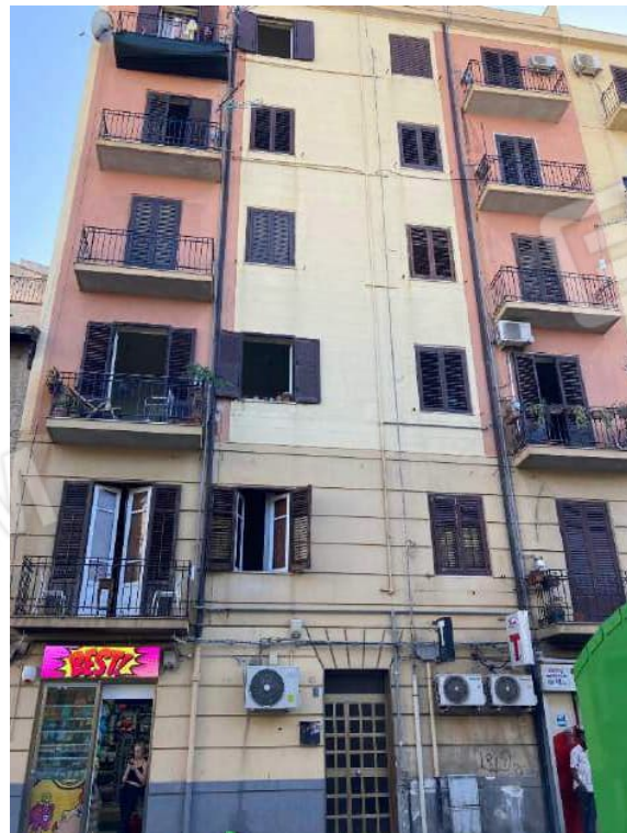
VIA ORETO N.85