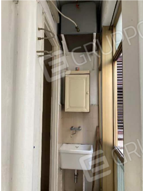
BALCONE CHIUSO A VERANDA SU CORTE INTERNA