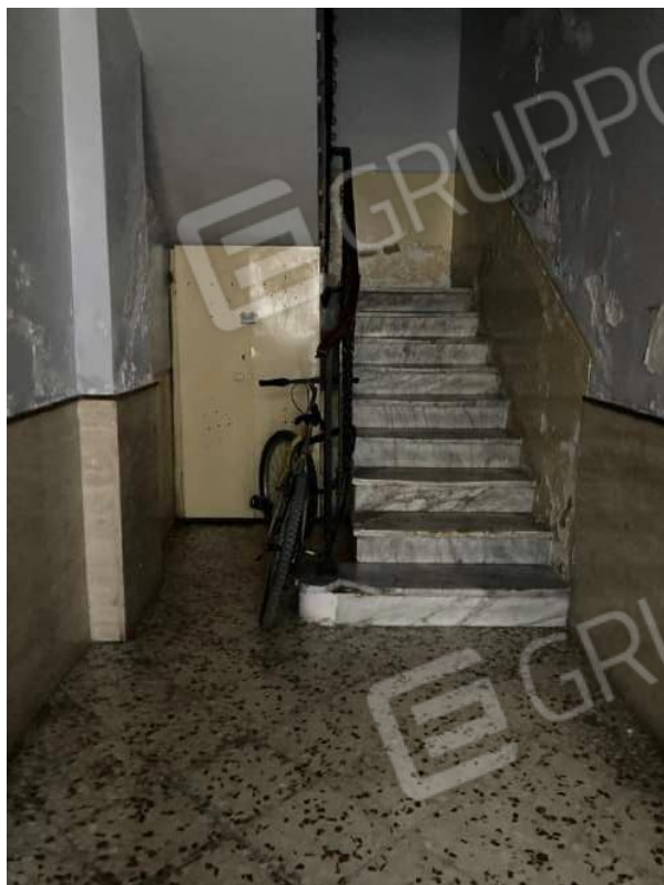
ANDRONE SCALA CONDOMINIALE