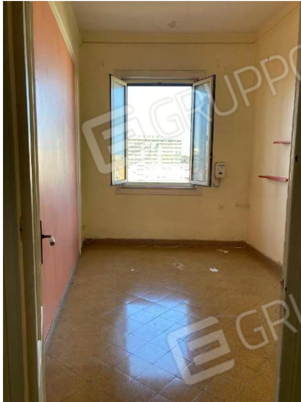
CAMERA 1 ( CONTATORE LUCE)