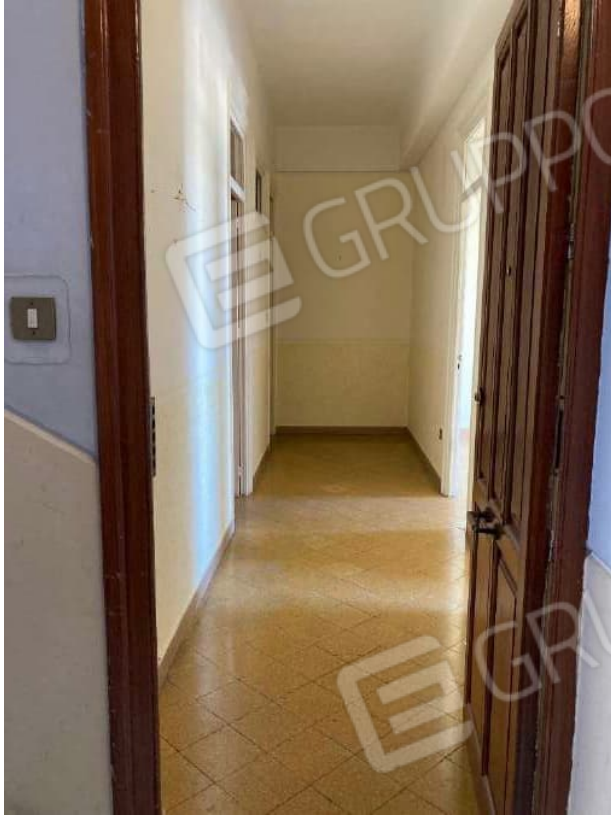
INGRESSO E DISIMPEGNO