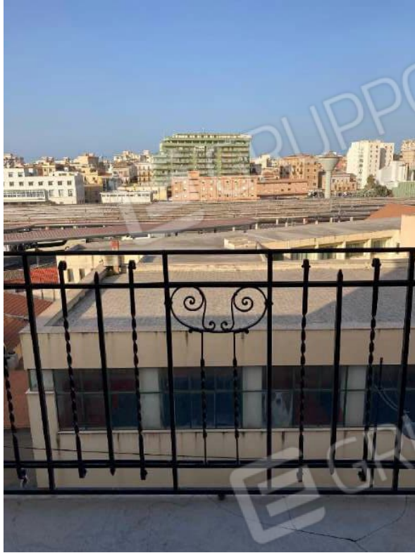
BALCONE CAMERA 2 SU VIA ORETO