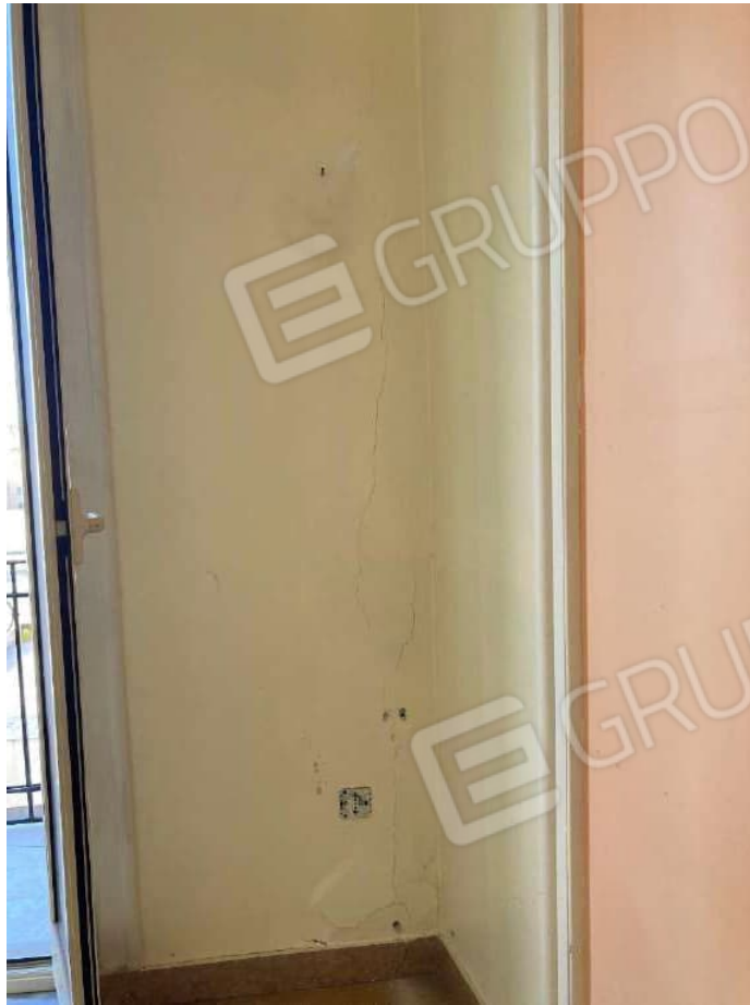
LESIONE INTONACO CAMERA 2