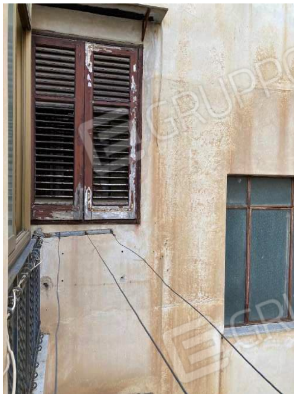
FINESTRA CAMERA 3 ALLINEATA AL BALCONE