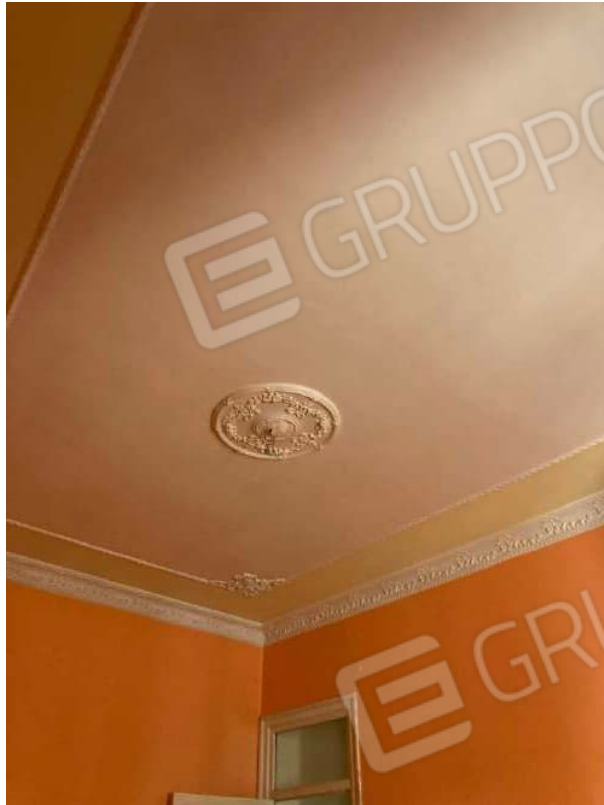
SOFFITTO CAMERA 4