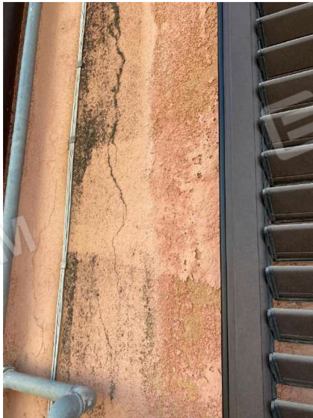
LESIONE SU PROSPETTO VIA ORETO