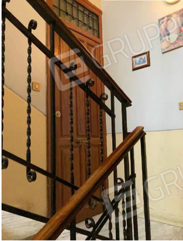
INTERNO 7 INGRESSO IMMOBILE