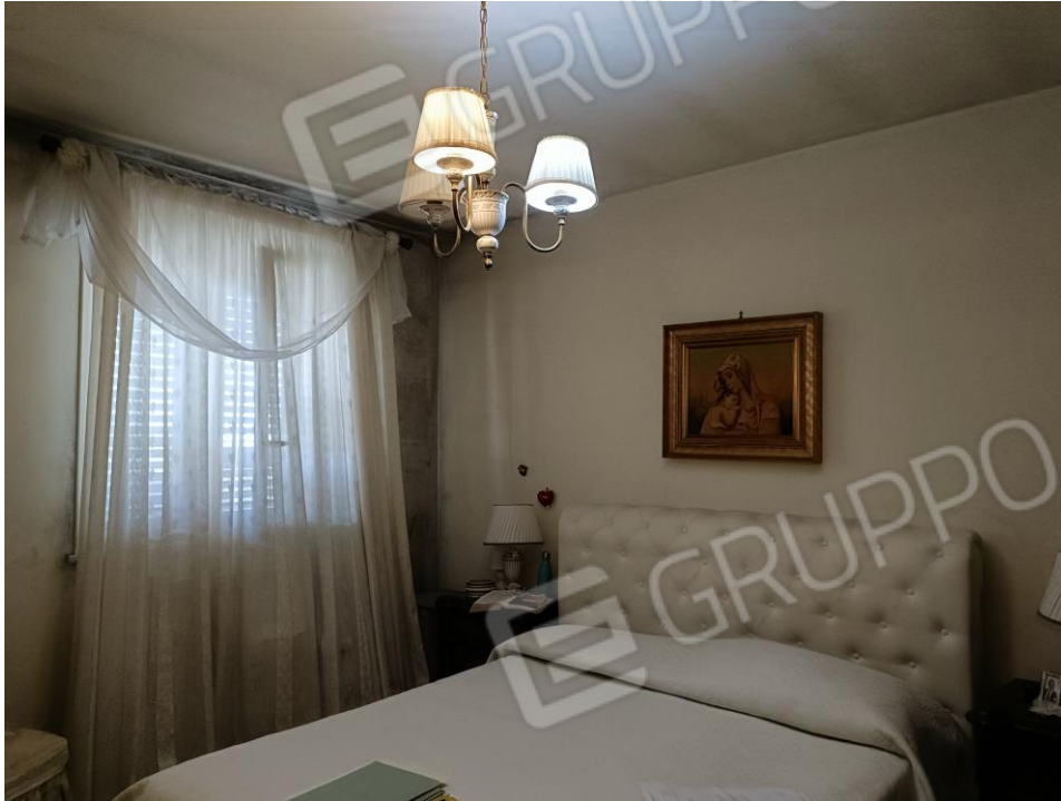
Foto 12-13 Camere da letto