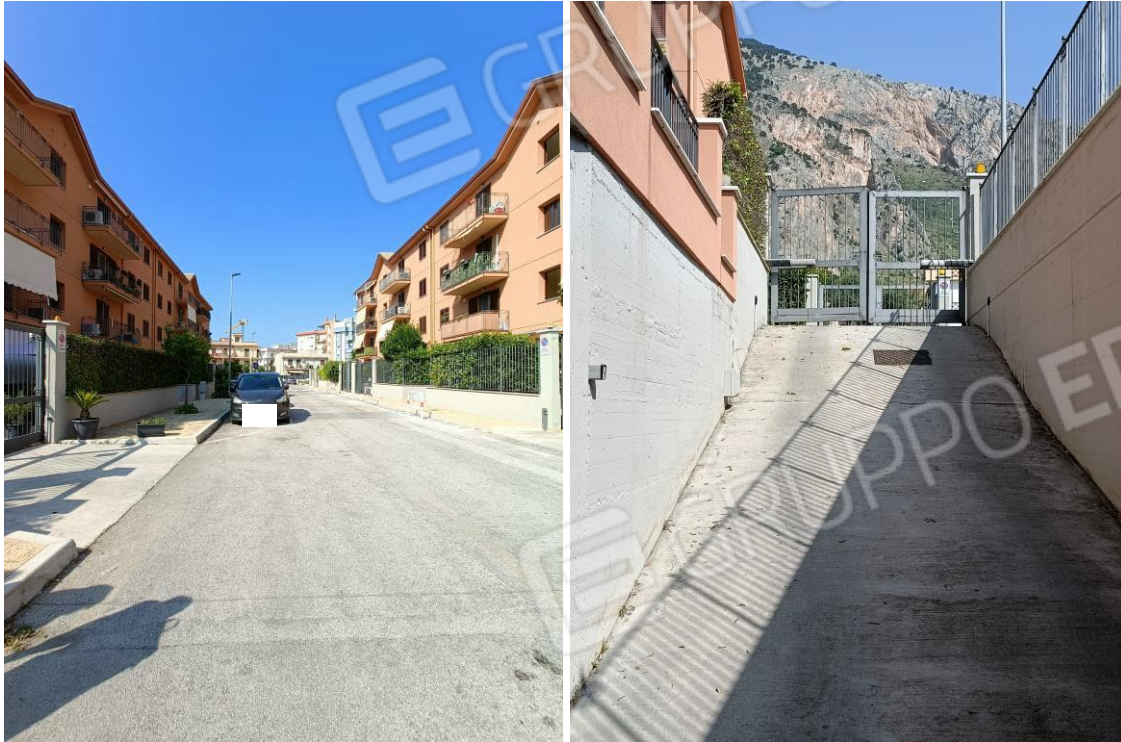
Foto n. 1-2. Vista della via Giuseppina Cammarata e delle palazzine che compongono il complesso immobiliare in cui si trova l'edificio con l'appartamento pignorato e vista della rampa di accesso al cantinato in cui si trova il posto auto pertinenziale