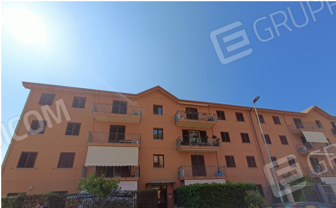
Foto n. 3. Vista della palazzina in cui si trova l'appartamento