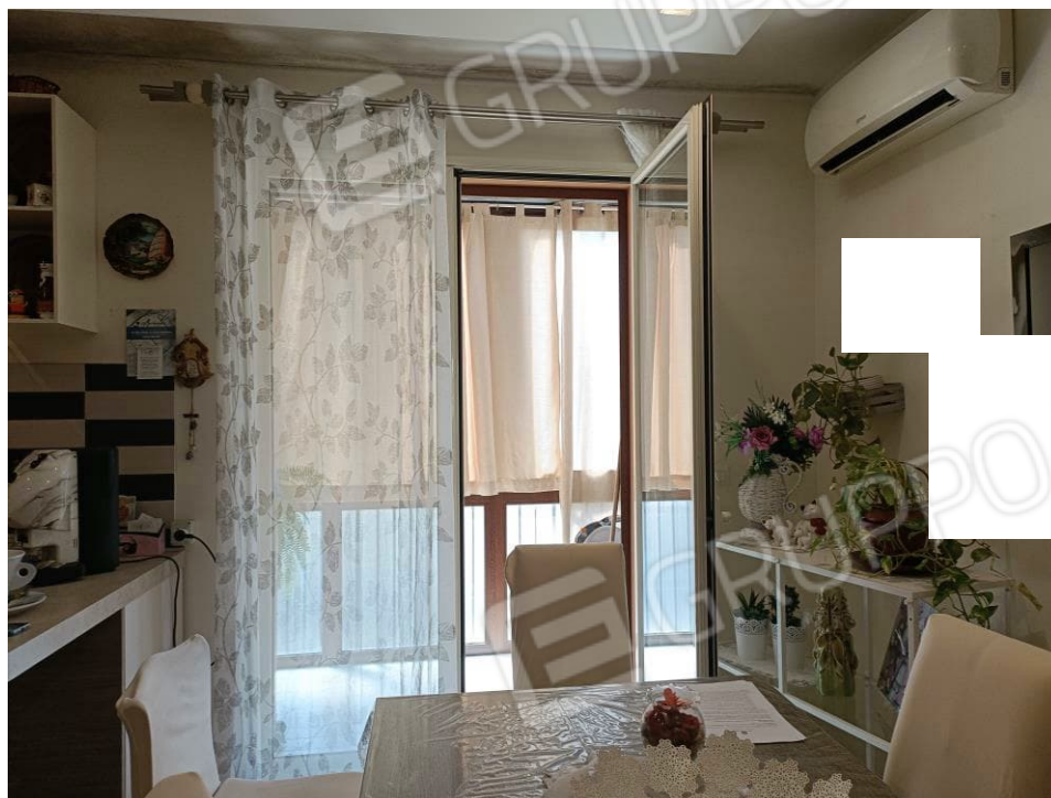
Foto 7-8 Cucina con balcone verandato