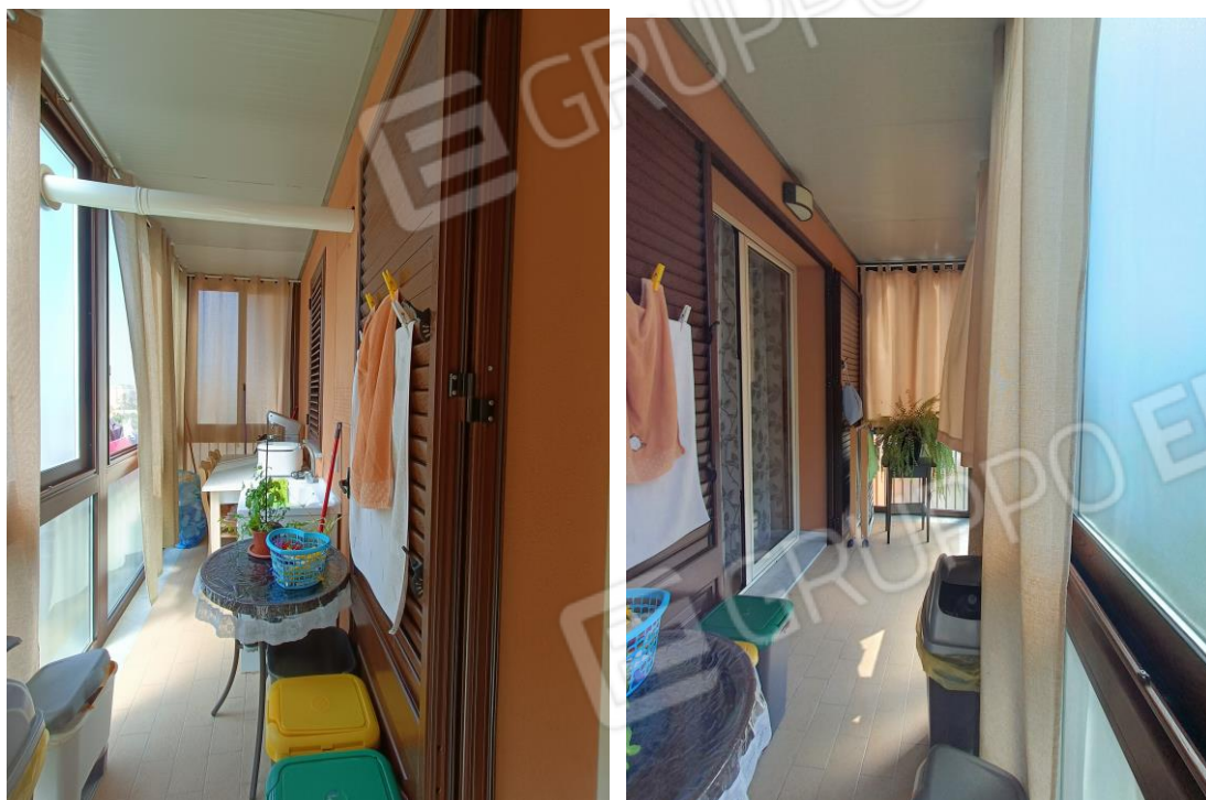
Foto 9-10-11 Veranda e vista dalla veranda verso il mare