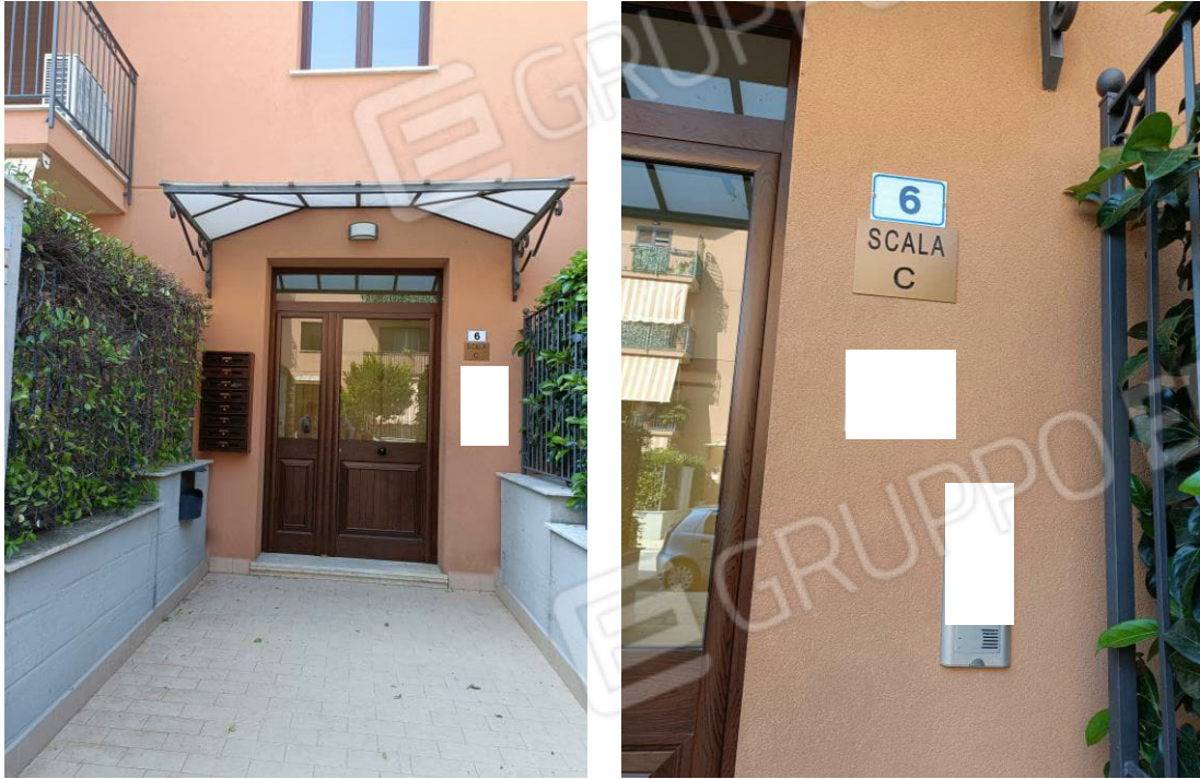
Foto n. 4-5-6 Portone di ingresso alla scala C e salone dell'appartamento al terzo piano