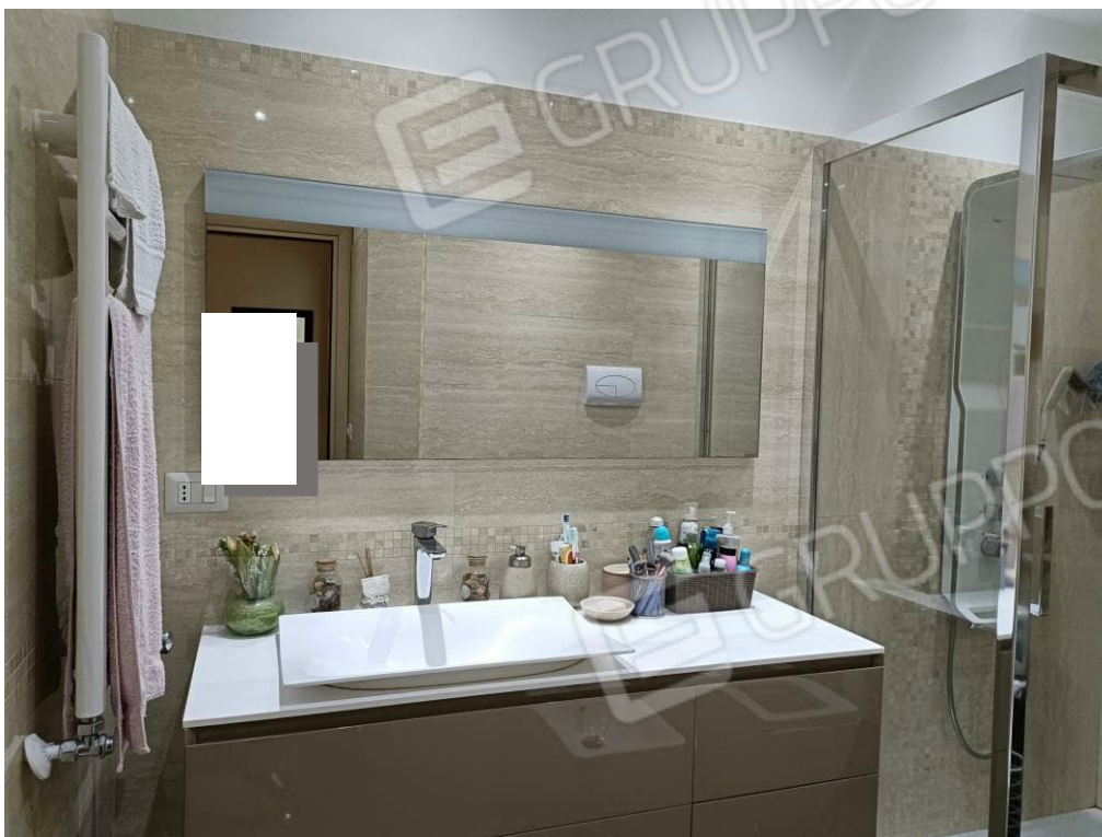
Foto 14-15 Bagni