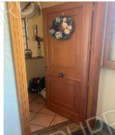
P2°: ingresso appartamento