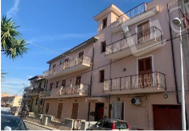
Edificio in oggetto