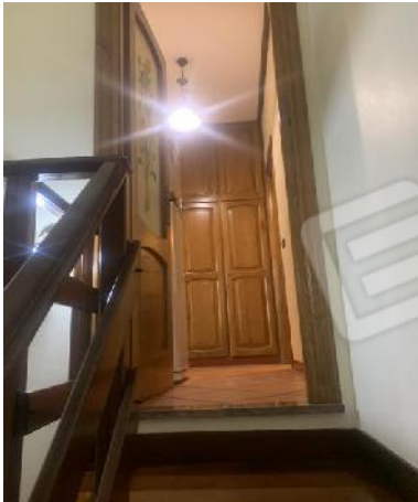
P1°: scala collegamento interno