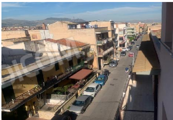
Contesto di zona via Aloï