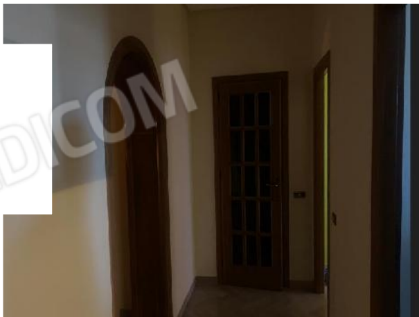
PI°: corridoio di disimpegno