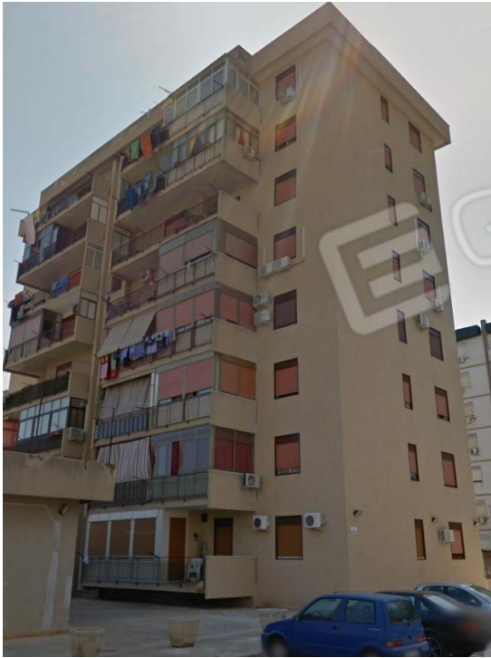
Foto 20 - prospetto su via Bartolomeo Sirillo