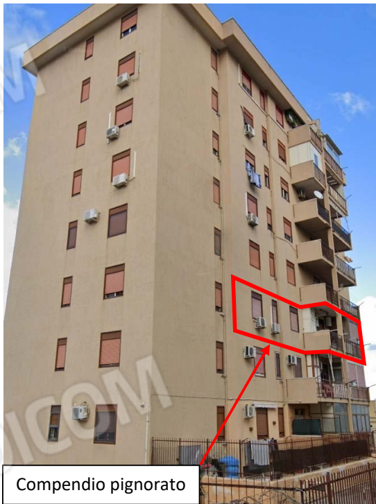
Foto 18 - prospetto su via Nicolò Alongi