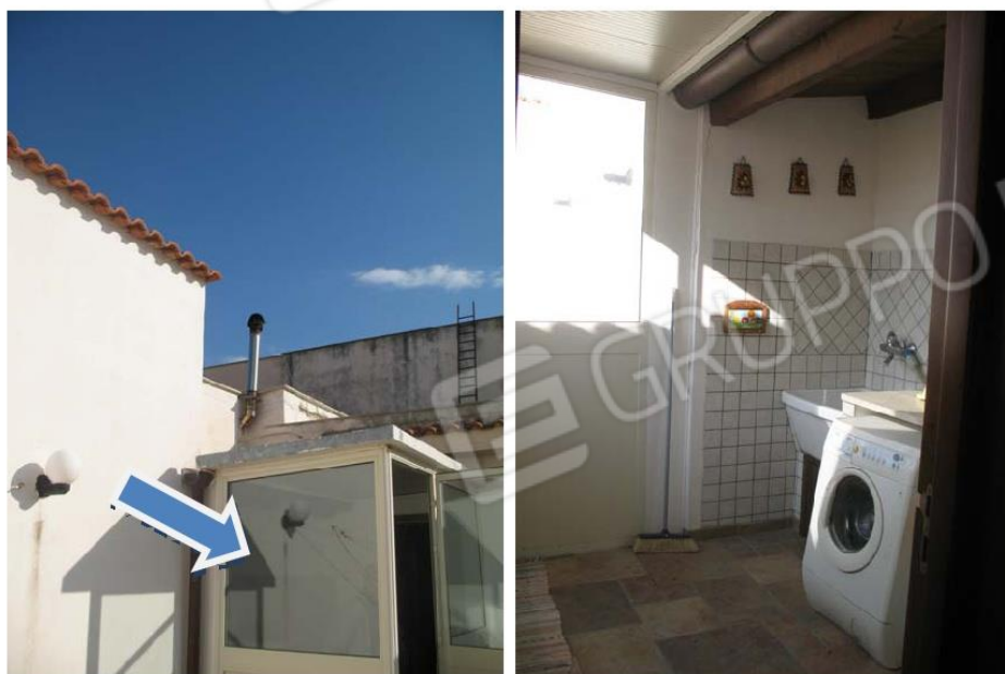
Foto n. 12 – Struttura precaria realizzata nel terrazzo, adibita a lavanderia.

Tribunale Civile di Palermo Consulenza Tecnica d'Ufficio ESECUZIONE N.R.ES. 150/2009