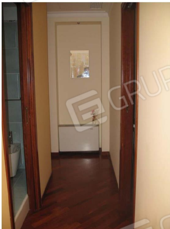
Foto n. 5 – Corridoio dove hanno accesso le camere da letto e un w.c., pavimentato con parquet.

Tribunale Civile di Palermo Consulenza Tecnica d'Ufficio ESECUZIONE N.R.ES. 150/2009