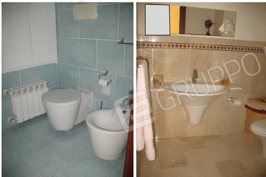
Foto n. 10 – Servizi igienico, pavimentati con piastrelle di ceramica.

Tribunale Civile di Palermo Consulenza Tecnica d'Ufficio ESECUZIONE N.R.ES. 150/2009