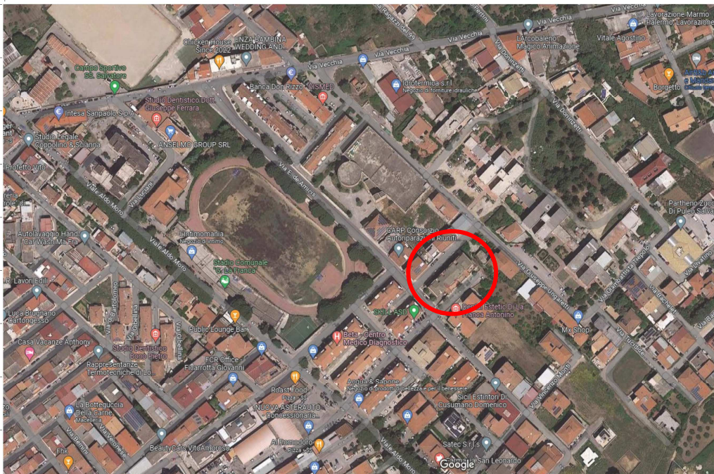
Ortofoto Google Maps

E' stata riscontrata, inoltre, l'esatta corrispondenza del fabbricato di cui fa parte l'appartamento oggetto di pignoramento, tra l'ortofoto reperita dal sito Google Maps e l'estratto di mappa catastale (v. allegato n. 6 ).