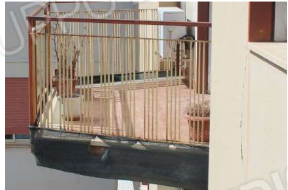
CM6: Frontalino e intradosso balcone (B).