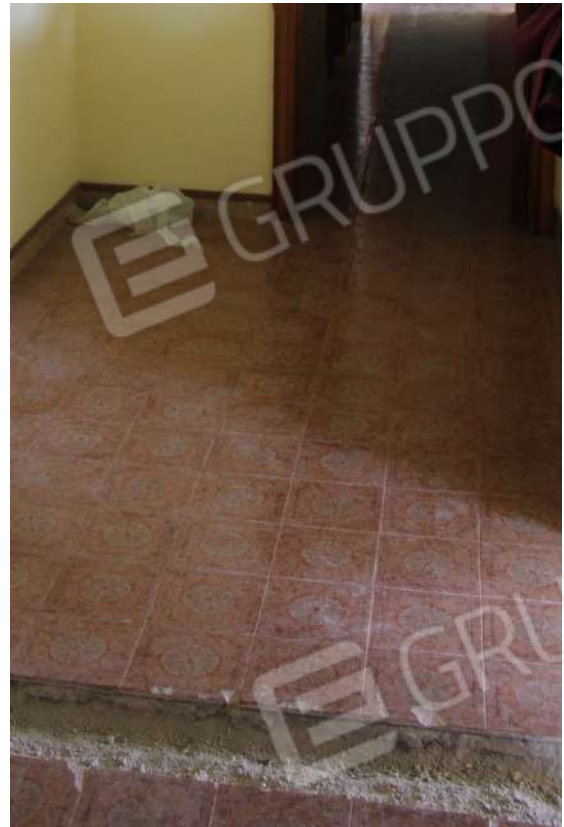
CM 4: Apertura traccia su pavimentazione Vano 1.