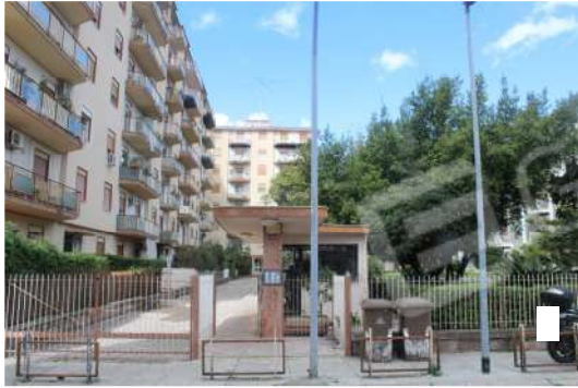
Foto nn. 1, 2: Accesso al complesso residenziale e area di pertinenza condominiale.

Unità immobiliare sita nel Comune di Palermo, Via Nuova n°21, piano settimo int. 15, edificio B scala D, identificata al N.C.E.U. nel foglio 21, part. 333, sub. 57.