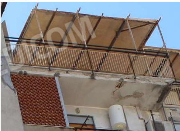
CM9: Frontalino e intradosso terrazzo (D).