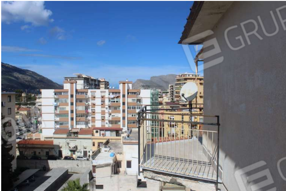
Foto n°47: Balcone di pertinenza vano 12, esposto a sud-ovest (Balcone D)