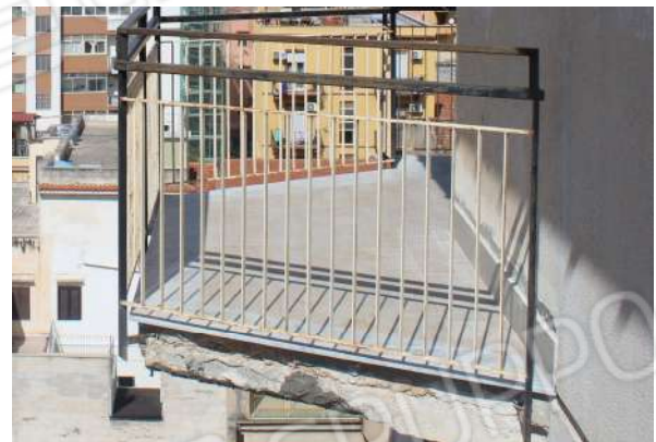
CM8: Frontalino e intradosso balcone (D).