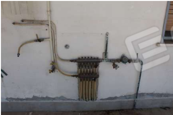
CM5: Impianti idrici ubicati nel terrazzo di retrospetto.