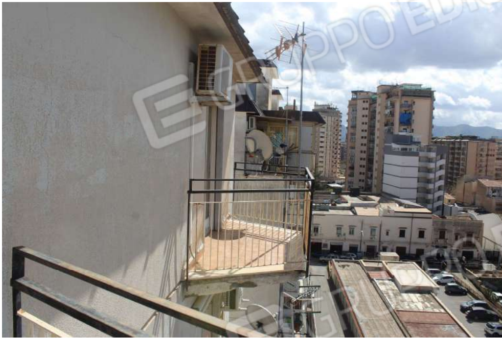
Foto n°46: Balcone di pertinenza vano 13, esposto a sud-ovest (Balcone C).

Unità immobiliare sita nel Comune di Palermo, Via Nuova n°21, piano settimo int. 15, edificio B scala D, identificata al N.C.E.U. nel foglio 21, part. 333, sub. 57.