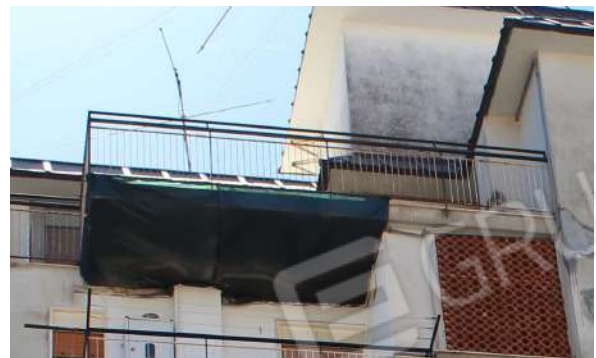
CM10: Frontalino e intradosso terrazzo (E).