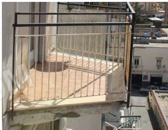
CM7: Frontalino e intradosso balcone (C).