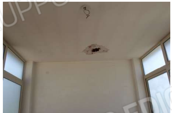
CM2: Intradosso solaio Vano 16.