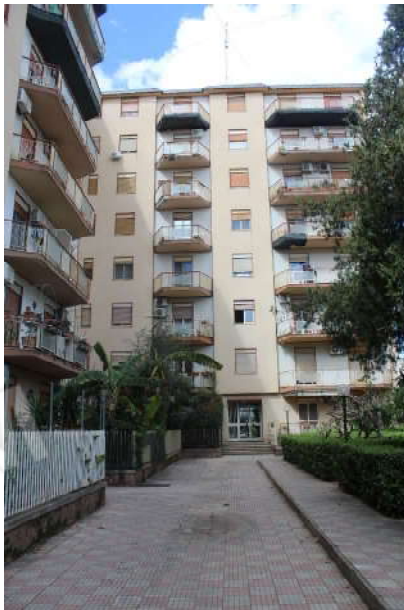
Foto nn. 3, 4: Edificio "B"- scala D, prospetto principale e retro-prospetto.