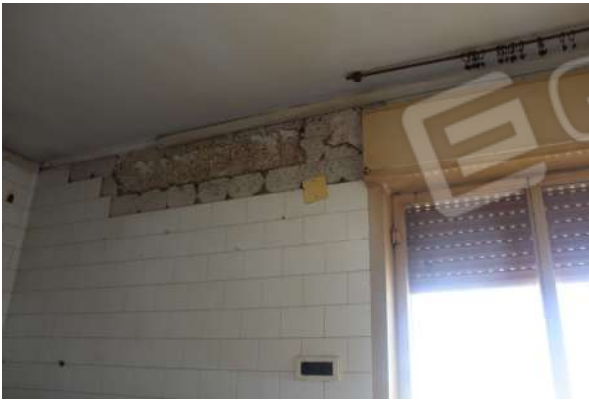
CM1: Rivestimento pareti Vano 7.