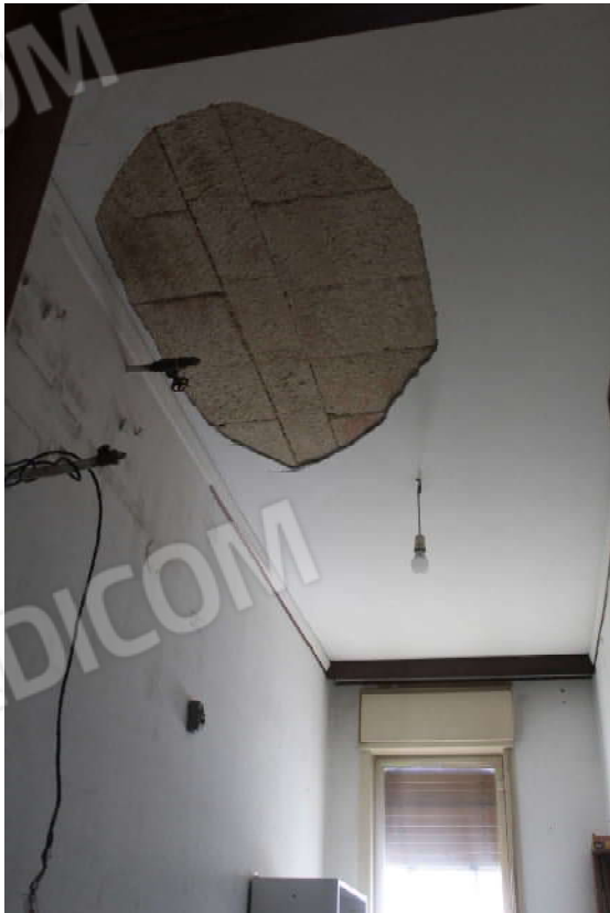
CM 3: Intradosso vano 14.