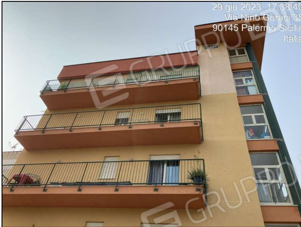
Foto n. 7 - Vista esterna Edificio Scala B