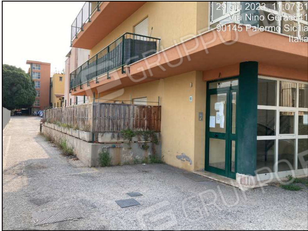
Foto n. 9 - Vista esterna Edificio Scala B