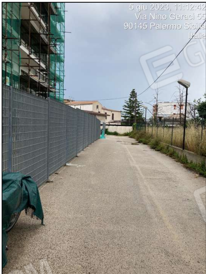
Foto n. 4 - Vista esterna del complesso immobiliare