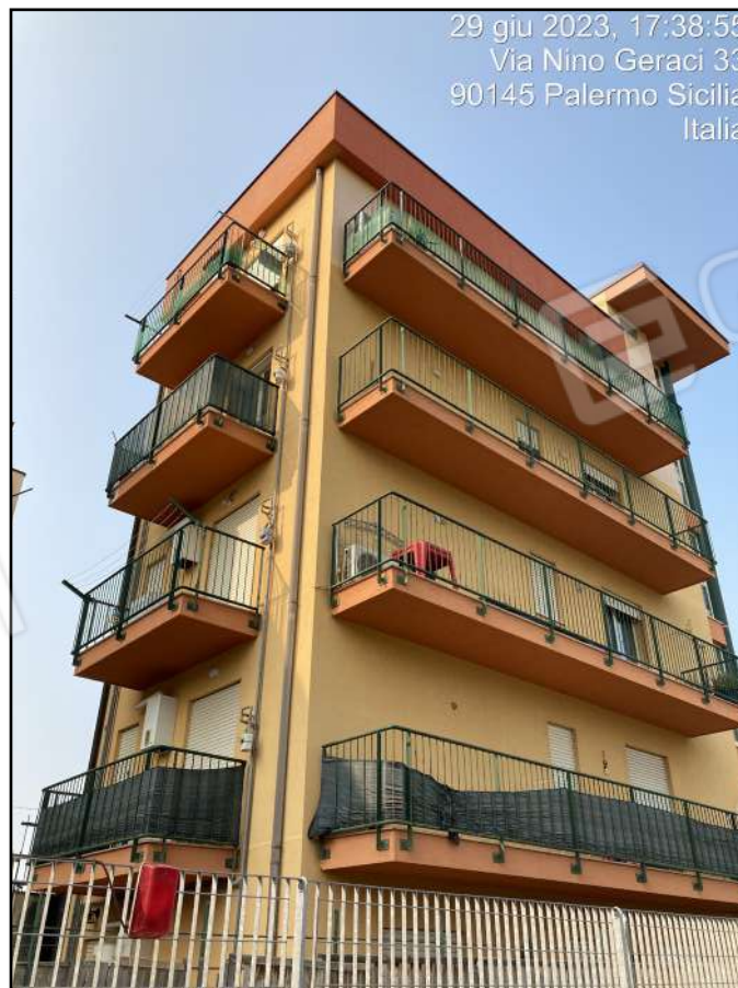
Foto n. 8 - Vista esterna Edificio Scala B