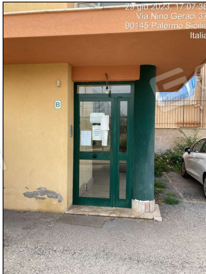
Foto n. 10 - Vista esterna Edificio Scala B