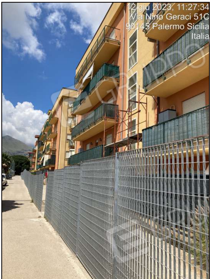
Foto n. 5 - Vista esterna del complesso immobiliare