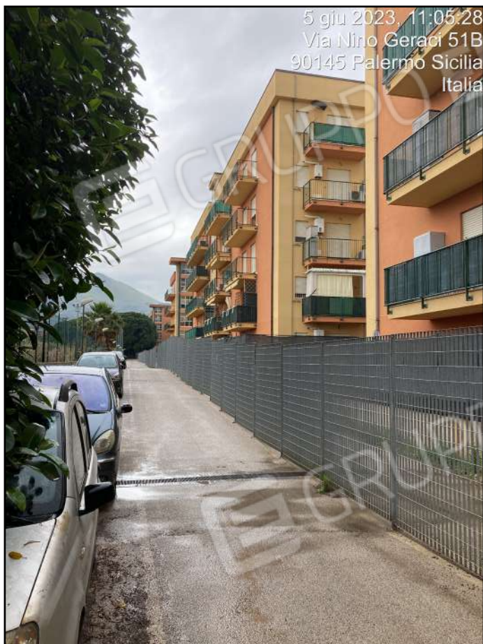
Foto n. 3 - Vista esterna del complesso immobiliare